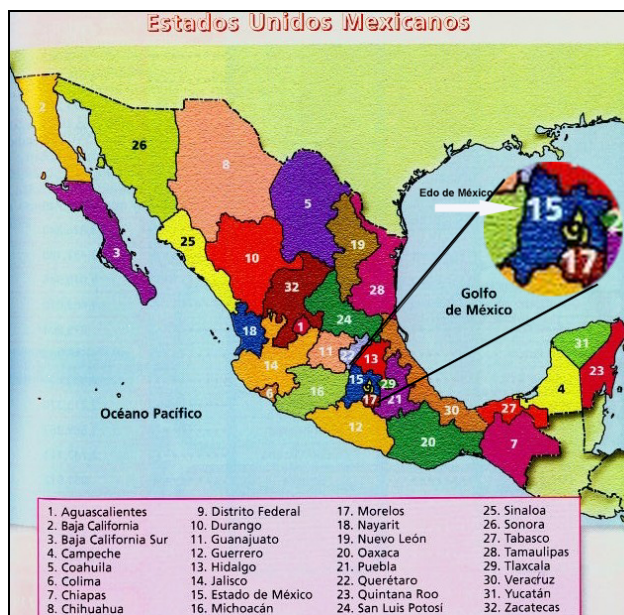
Ilustración 1 Mapa de la República Mexicana