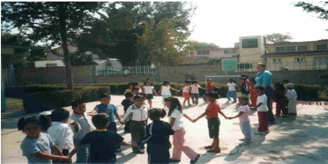
Foto tomada el 25 de Octubre del 2004, en las instalaciones del plantel.

La letra de la canción fue eje medular para esta sesión, por ser la primera repetimos dos veces el canto de bienvenida. Se cohibían al pasar al frente por binas, por lo que se realizó grupal. El propósito se logró porque la mayoría participo.