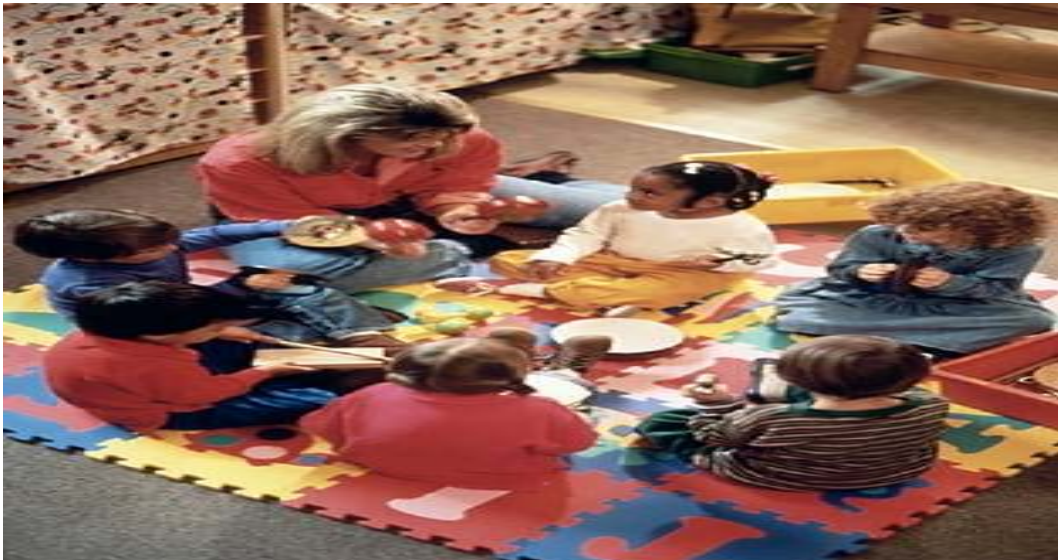
FOTO DONDE SE MUESTRA A LA EDUCADORA IMPARTIENDO UNA CLASE DE MUSICA (IMITACIÓN DEL ALUMNO).

Cuando al niño se le enseña a entonar una canción, siempre existe el modelo a seguir. La educadora tiene la función principal de indicar al niño qué y cómo realizar la entonación adecuada. Es aquí donde el niño preescolar aprende a dominar su conducta, al practicarla deliberadamente, jugando a cantar y danzar siguiendo las reglas de la actividad lúdica.