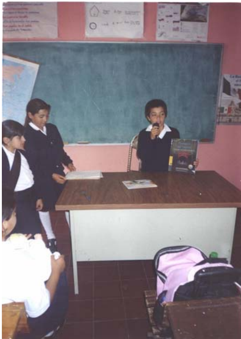
ALUMNAS LEYENDO PARA REALIZAR EL JUEGO “HOY TE RECOMENDAMOS”.