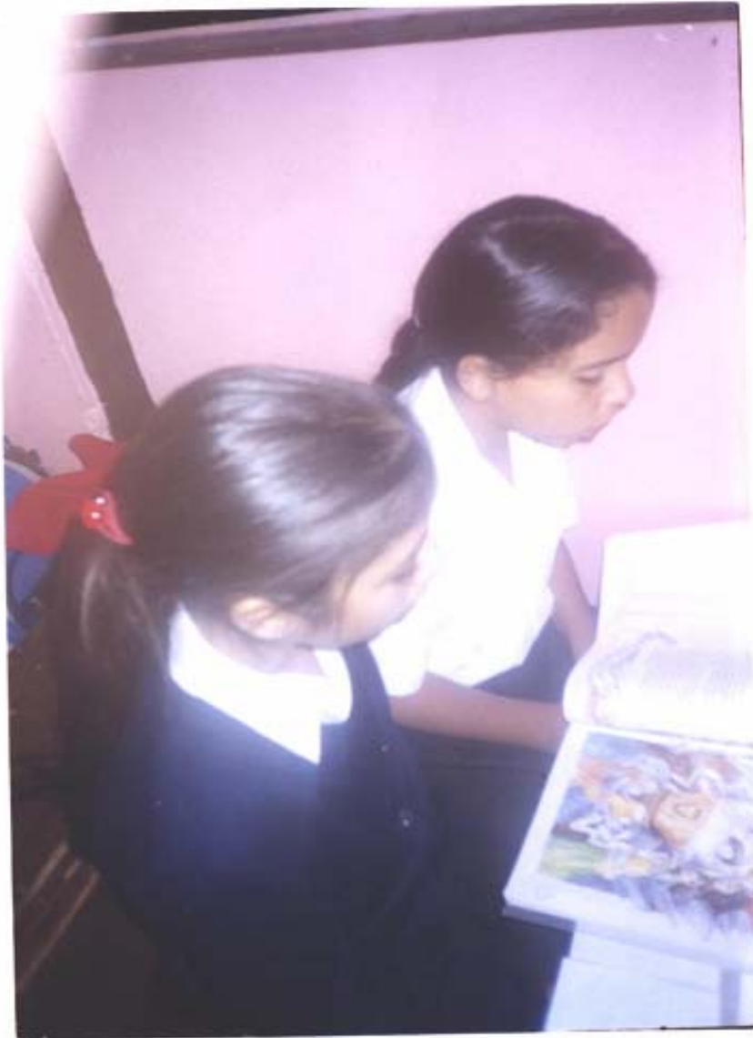
ALUMNOS LEYENDO PARA REALIZAR EL JUEGO “NO CIERTO”.