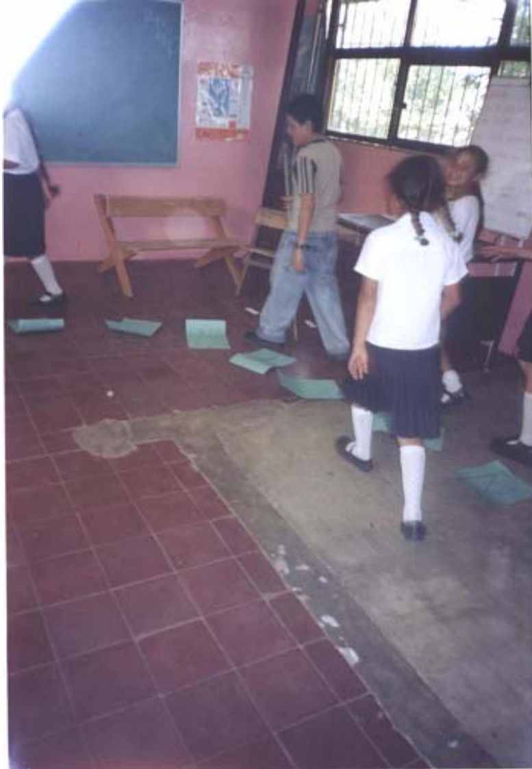
ALUMNO REALIZANDO “EL JUEGO DE LAS LETRAS”.