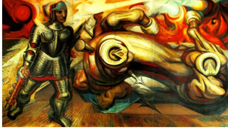
Apoteosis de Cuauhtémoc "Cauhtémoc redivivo", 1945 David Alfaro Siqueiros Piroxilina sobre celotex 449 x 795 x 6 cm. (Panel derecho del díptico)