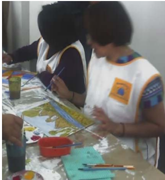
Curso para Maestros

Se pretende desarrollar procesos de aprendizaje artístico, en los docentes que trabajan frente a grupo especialmente se enfocan en la educación básica.