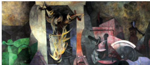
"México de hoy", 1953 Rufino Tamayo Óleo sobre tela 510 x 1 128 x 10 cm.