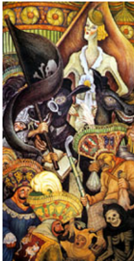
Carnaval de la vida mexicana