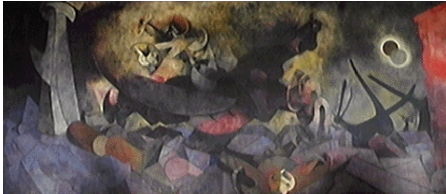
Nacimiento de la nacionalidad, 1952 Rufino Tamayo Óleo sobre tela 510 x 1 128 x 6 cm.