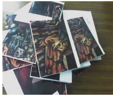
Rompecabezas Tormento a Cuauhtémoc (2006) Museo del Palacio de Bellas Artes

Esta actividad fue diseñada para jóvenes de entre 12 y 15 años de edad, requiriendo la elaboración de un rompecabezas alusivo al mural Tormento a Cuauhtémoc del pintor David Alfaro Siqueiros, el rompecabezas cuyos números de piezas fue 19 se caracterizó por ser resistente, las piezas fueron 19, y el rompecabezas fue tridimensional, la intención fue poner en práctica elementos del lenguaje plástico como lo son los planos de una pintura, la proporción y la técnica de poliangularidad que utilizó el pintor para lograr un efecto de movimiento en su pintura mural.