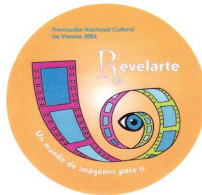
Imagen del programa de verano Revelarte. Un mundo de imágenes para ti. Verano 2006

En este capítulo narro y analizo mi experiencia en el Museo del Palacio de Bellas Artes, ya que como he mencionado en líneas anteriores tuve la oportunidad de participar como Asesor Educativo en el período comprendido entre el 24 de febrero de 2006 y el 26 de mayo de 2007. Reconozco que durante mi estadía, mi desarrollo profesional se enriqueció al tener un contacto cercano con el público escolar en todos sus niveles, con público de la tercera edad, estudiantes militares, personal que labora en las embajadas, público extranjero, público conocedor especialista en arte, con docentes de distintos niveles. Sin duda, estas experiencias han modificado mi estructura cognitiva y permeado mi personalidad.