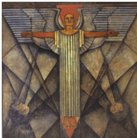
"Alegoría del viento". El ángel de la paz, 1928 Roberto Montenegro. Fresco sobre bastidor transportable 326 x 301 x 1 cm

José Clemente Orozco Fresco sobre bastidor metálico móvil 446 x 1 146 x 5 cm.