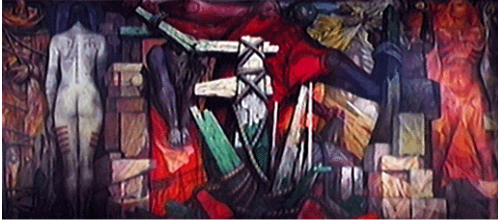
Liberación "La humanidad se libera de la miseria", 1960 Jorge González Camarena Acrílico sobre tela 449.5 x 993 x 5 cm.