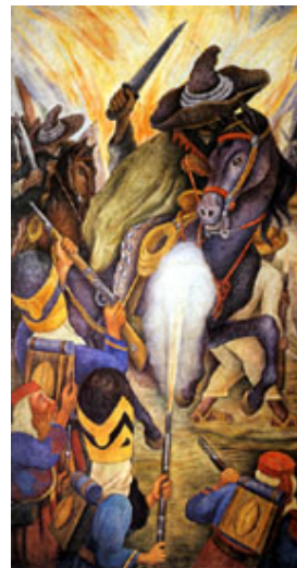
Carnaval de la vida mexicana