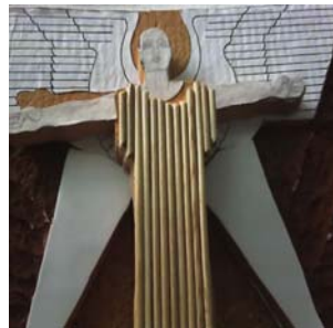
“Alegoría al Viento” (2006). Museo del Palacio de Bellas Artes.