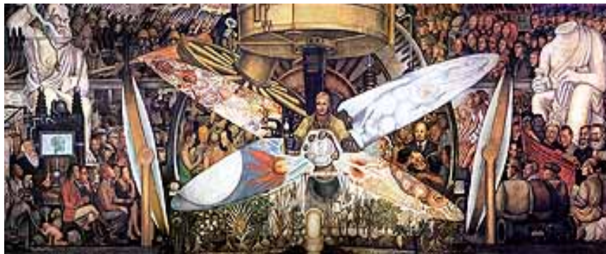
"El hombre contralor del universo" , 1934 Diego Rivera Fresco sobre bastidor metálico móvil 480 x 1 145 cm.