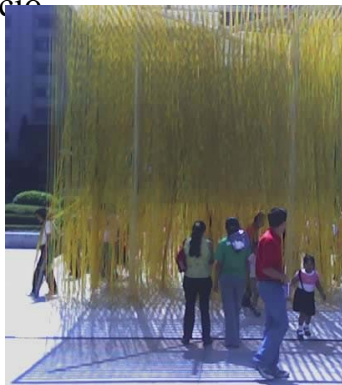
Penetrable. Jesús Soto. (1969)

La museografía interviene directamente en cómo nos muestran la obra, no necesariamente en el interior del museo, en la actualidad la museografía irrumpe espacios públicos, como las recientes exposiciones en la explanada de Palacio de Bellas Artes, Oasis Sonoro , en junio del 2006, y Cruce de miradas. Visiones de América Latina , en octubre del 2006; con la intención de modificar el espacio en el que interviene cotidianamente el público, y proponer un sentido estético. Los museógrafos se encargan de diseñar el espacio que ocupará la exposición, así como la ubicación de las piezas en ese espacio.