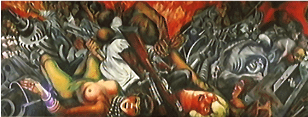
"La katharsis", 1934-1935

José Clemente Orozco Fresco sobre bastidor metálico móvil 446 x 1 146 x 5 cm.