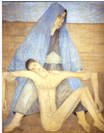
"La piedad en el desierto", 1942 Manuel Rodríguez Lozano Mural al fresco sobre bastidor transportable 260.5 x 229 x 4 cm (Pintado en Lecumberri y transportado posteriormente al Museo del Palacio de Bellas Artes)