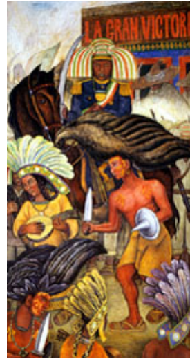
Carnaval de la vida mexicana