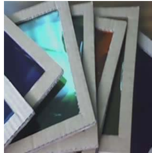
Ventanas de colores (2006) Museo del Palacio de Bellas Artes

Para los niños de entre 9 y 11 años se elaboraron ventanas de colores, que son pequeños rectángulos con marco de cartón de 18 x 24 cm. aproximadamente, cubiertos por papel celofán de seis colores diferentes, permitiendo apreciar una gama de colores diferentes, en las pinturas murales.