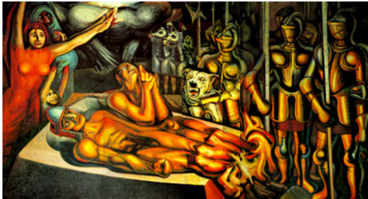
"Tormento de Cuauhtémoc", 1951 David Alfaro Siqueiros Piroxilina sobre celotex 453 x 814 x 6 cm. (Panel izquierdo del díptico)