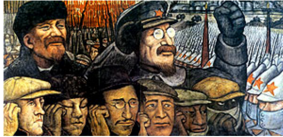
Tercera Internacional "La Revolución rusa" , 1933 Diego Rivera Mural al fresco sobre bastidor transportable 69 x 139 x 4 cm.