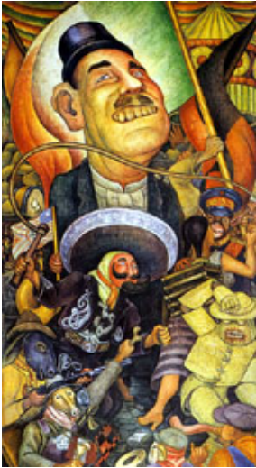
Carnaval de la vida mexicana