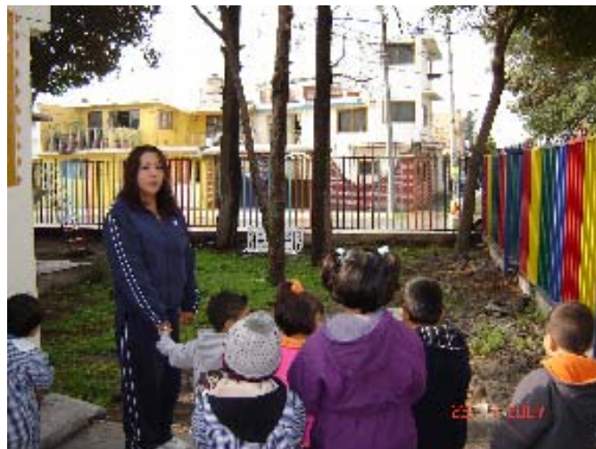
Anexo 3. Aplicación de la actividad "Un paseo por el patio"