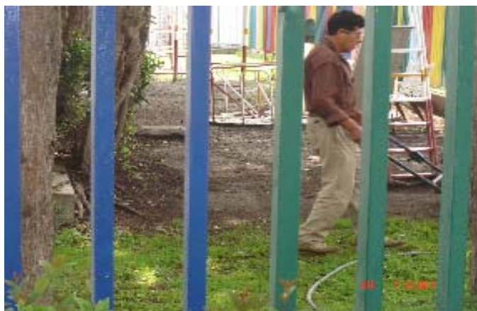
Anexo 8. Poda de pasto, días después de la aplicación del proyecto.