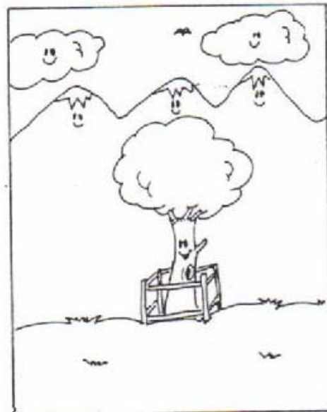
Anexo 6. Actividad de sucesión.