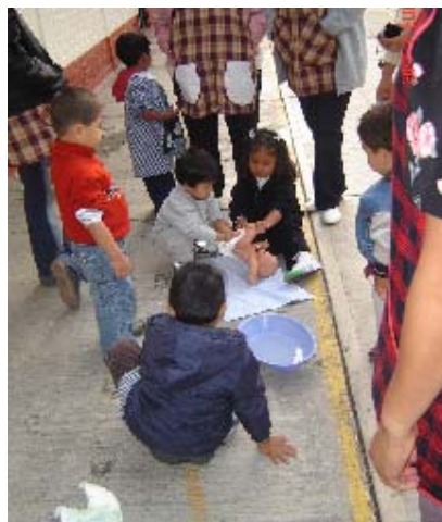
Anexo 4. Actividad “Baño de burbujas”