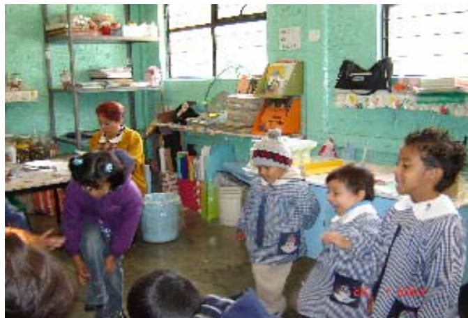
Anexo 4. Actividad “Un paseo por el patio” Los niños simulan que se están vistiendo.