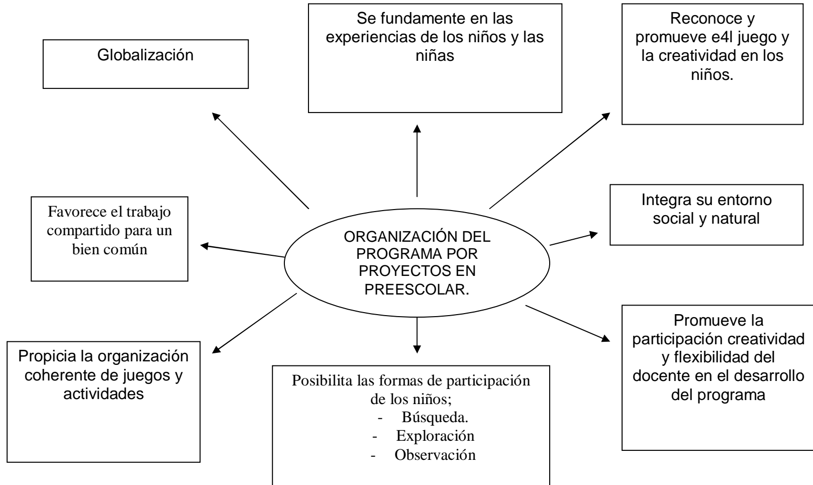
Cuadro tomado del Programa de Educación Preescolar 1992.