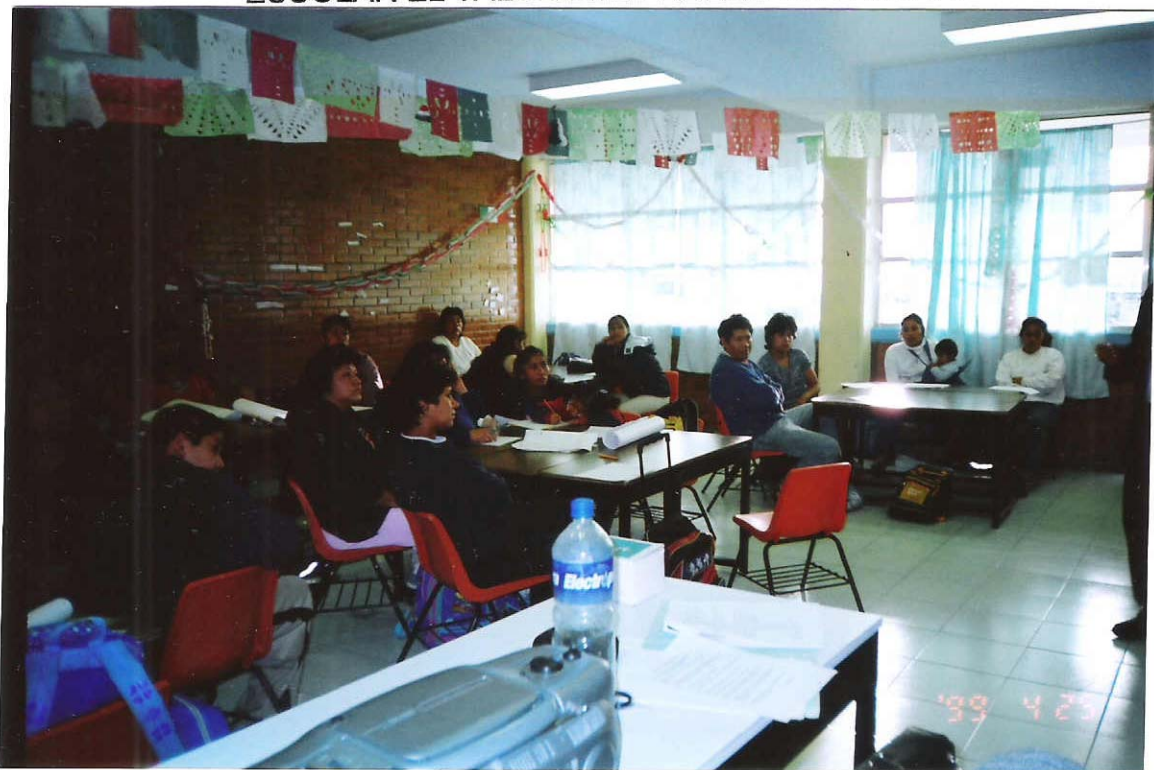
PERSONAS CONSTANTES QUE ASISTIERON AL TALLER DE PADRES DE FAMILIA