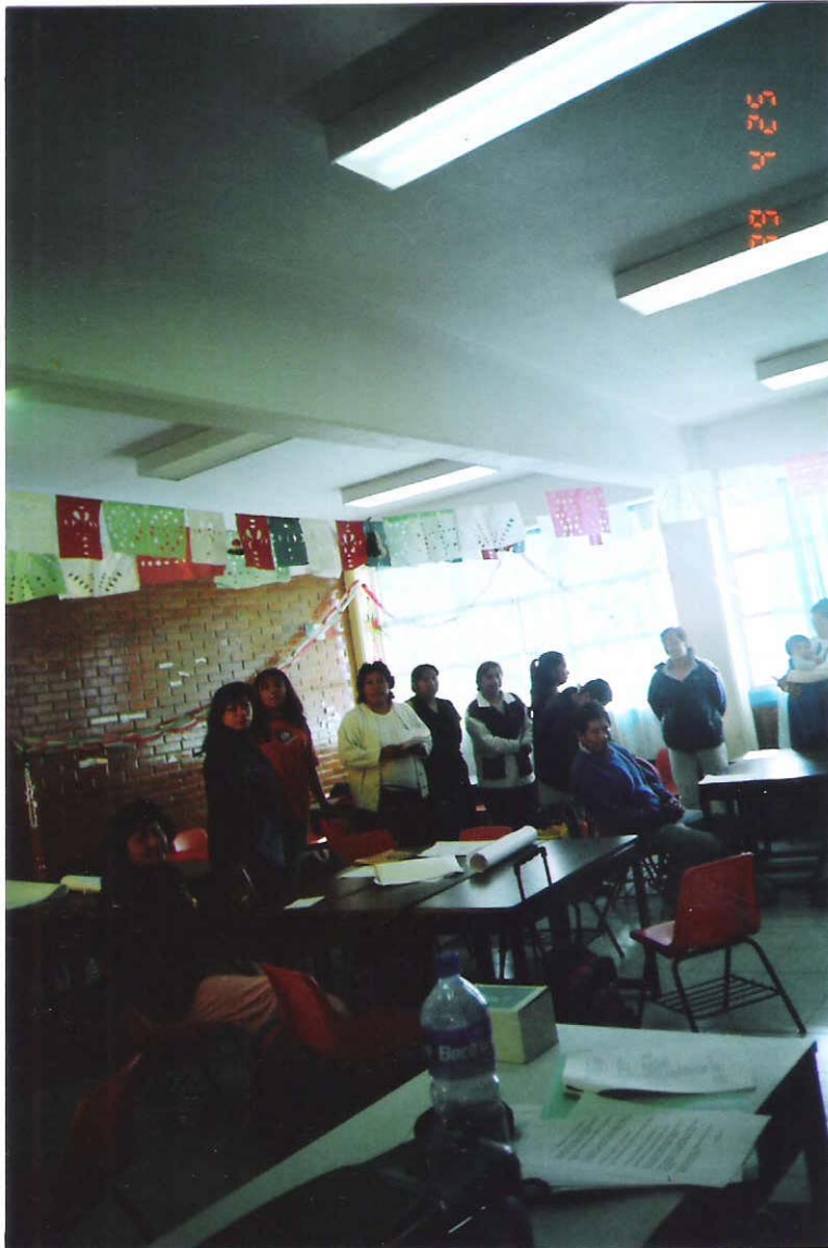
PERSONAS PARTICIPANDO EN DE UNA ACTIVIDAD DEL TALLER DE PADRES DE FAMILIA