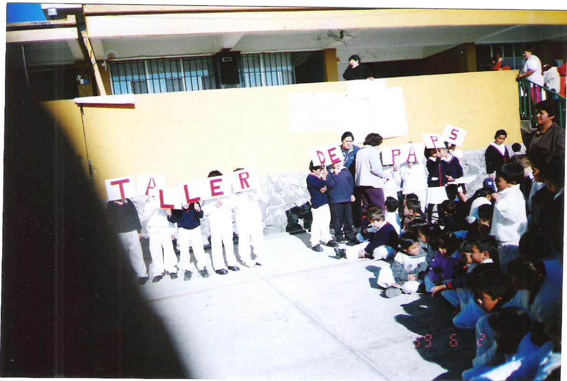
NIÑOS DE 2º "B" DE LA ESCUELA RAFAEL HERNÁNDEZ LÓPEZ QUE PRESENTARON UN ACRÓSTICO PARA DAR A CONOCER A LA COMUNIDAD ESCOLAR EL TALLER DE PADRES DE FAMILIA.