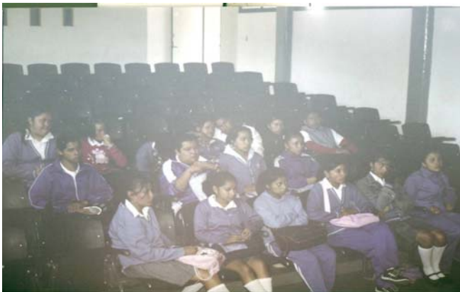
Foto Núm. 3 Sesión de trabajo de Concientización sobre la importancia del proceso de comunicación en el aula escolar.