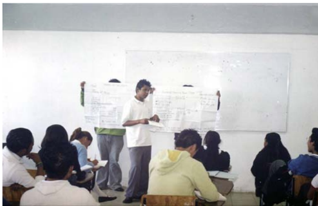
Foto Núm. 5 Sesión de trabajo “Escúchame y Compréndeme” trabajo de exposición, para determinar la importancia del alumno en su rol protagónico dentro del aula de clase.