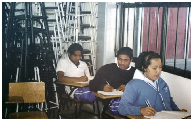
Foto Núm 8 Sesión de trabajo “nuestro trabajo” Interpretación e importancia de la comunicación dialógica en el aula.