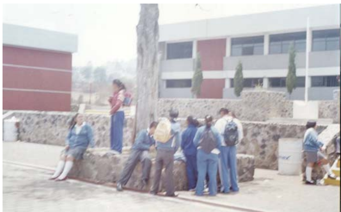
Foto Núm 7 Diagnóstico sobre las formas de Comunicación de los alumnos fuera del aula escolar. (integración Grupal por afinidades)