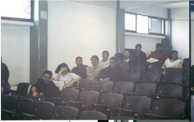
Foto Núm.1 Sesión de trabajo número 1 de Sensibilización y comunicación con los docentes de la Institución.