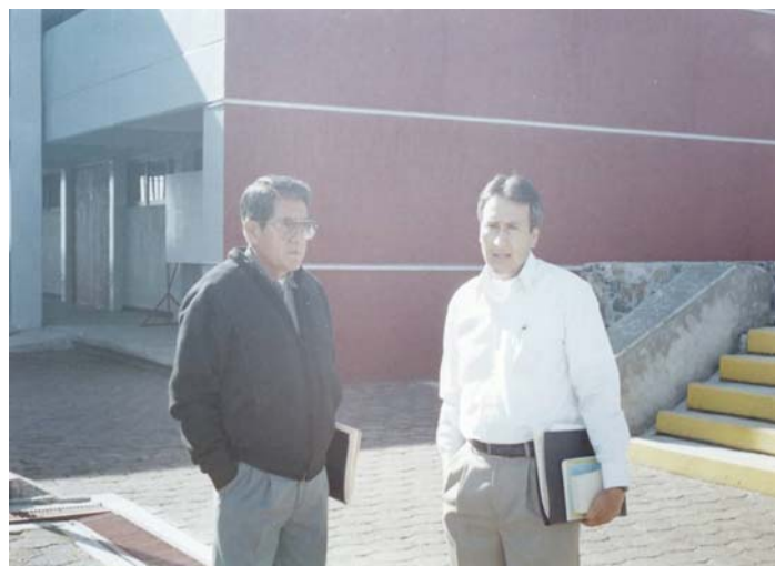
Foto Núm. 12 Diagnóstico sobre el proceso de Comunicación entre los docentes de la Institución fuera del aula escolar.