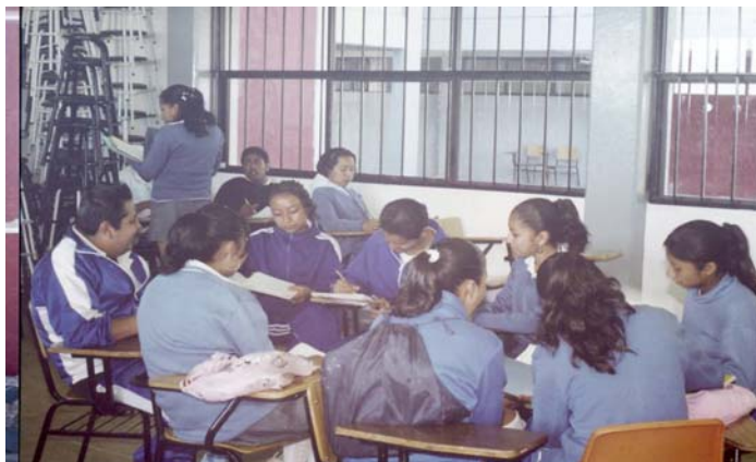
Foto Núm. 6 Sesión de trabajo “pláticame “ Dinámica de grupos para determinar cuales son los factores que inciden en el proceso de comunicación en el aula de clase.