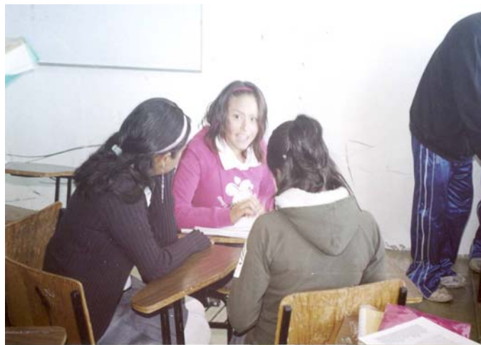
Foto Núm. 10 Sesión de trabajo “Reproducción de Figuras” Que el alumno adquiriera la habilidad para comunicar mensajes entre sus compañeros de aula.