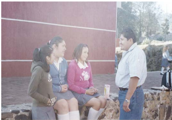
Foto Núm. 9 Sesión de trabajo “nuestra Tarea” Lograr un acercamiento maestro alumno para mejorar la comunicación entre ambos.