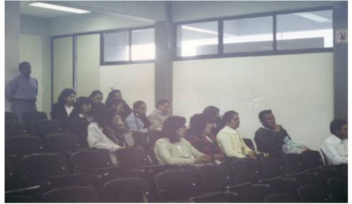
Foto Núm.2 Sesión de trabajo número 2 Importancia de comunicación en el aula de clase con los docentes de la Institución.