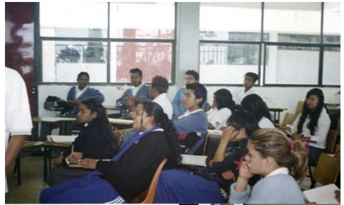
Foto Núm. 4 Sesión de trabajo para determinar la importancia de los elementos que constituyen el proceso de la comunicación dialógica en el aula.