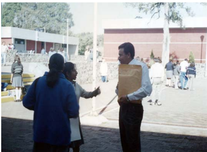
Foto Núm. 11 Sesión de trabajo “nuestra Tarea” Lograr un acercamiento maestro alumno para mejorar la comunicación entre ambos.