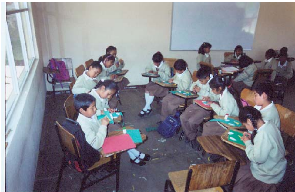
Alumnos construyendo sus máscaras, que utilizarán para la dramatización.