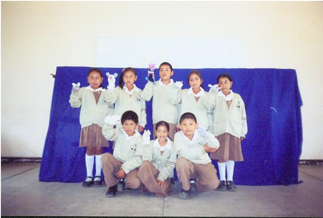
Alumnos contentos muestran su personaje frente al escenario.