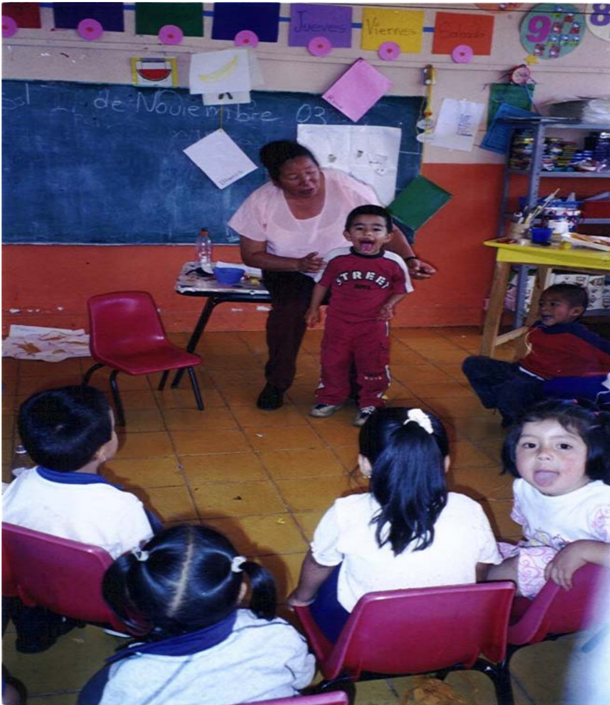
Prácticas de apoyo a los niños para mejorar la pronunciación.