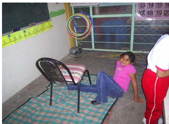
Se muestra como pasa por debajo de la silla en diferentes posiciones