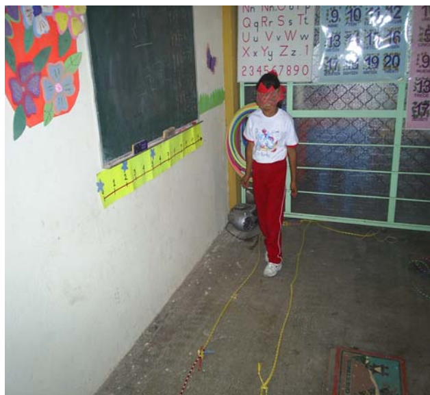
Se muestra la percepción auditiva.

Este ejercicio es de gran ayuda e importancia porque se obtiene percepción auditiva y se desarrolla con la concentración de memorización; cuando se les dicta poco a poco escriben mejor las palabras y la pronunciación se ve reflejada en la lectura, este ejercicio beneficia en el aprendizaje de la lecto-escritura