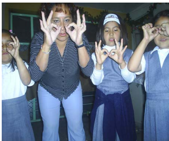
En esta foto se está imitando cazar a un león utilizando los indicadores como la imitación y concentración

El indicador de orientación corporal es cuando la orientación del propio cuerpo se haya asimilado para poder pasar a la orientación corporal, éste consiste en reproducir movimientos, gestos o posiciones.