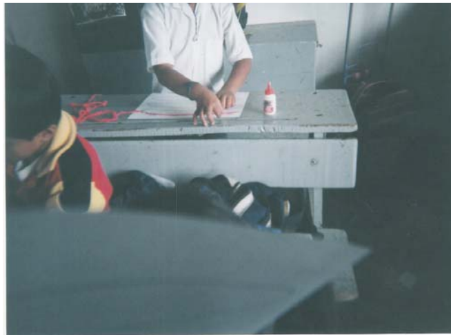
En esta foto se observa que hay niños que tienen más habilidad de manejar el pegado de papel.

Asimismo la motricidad fina se desarrolla en el boleado y rasgado de papel, donde se observa la soltura o rigidez de los dedos toma de pinza y el control muscular.