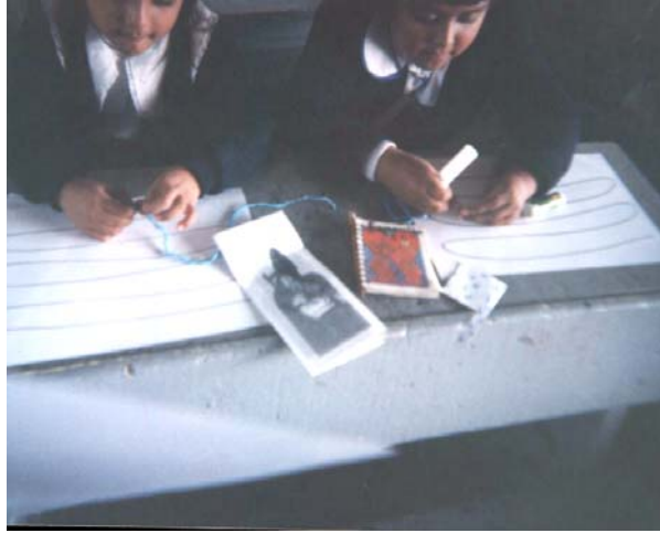
En esta foto se observa que primero se elaboró la colita de ratón para después pegarla en la hoja.