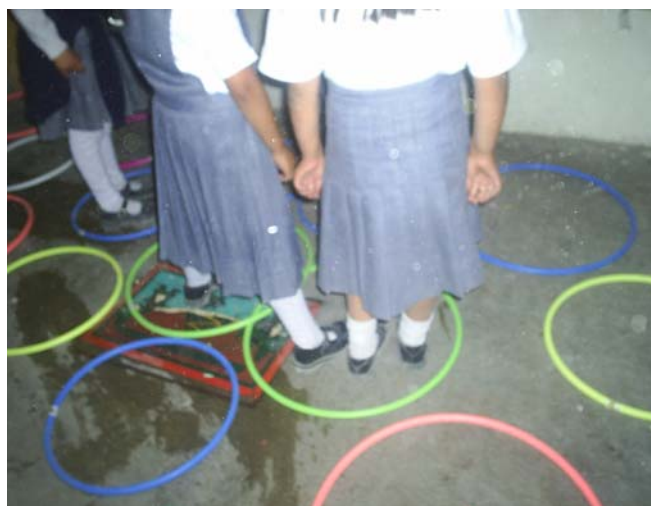
En la foto se observa la actividad como la desarrollan