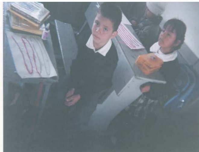
El grupo trabajando la motricidad fina.

En la mayoría de los niños observé que se requiere trabajar más este tipo de ejercicios porque el boleado aún no es uniforme, y cuando se hace el pegado en la hoja se salen de la línea y se requiere que lo hagan en menos tiempo y con debida limpieza.