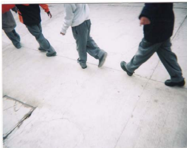
Se observa como los niños se salen de las líneas, dibujadas en el piso

A los niños le es divertido, pero observé que al principio se les dificultó caminar sobre las líneas, se puede apreciar en la foto, esta actividad se desarrolla principalmente la coordinación visomotora y la concentración, esta actividad está diseñada para que el niño adquiriera una adecuada lateralidad dentro de la lecto-escritura