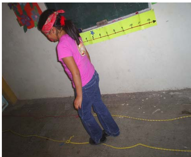
Se muestra el ejercicio en esta foto

El indicador de percepción visual se desarrolla en ejercicios de coordinación óculo-motriz y de percepción de la posición le ayuda al niño en la memorización, se mejora la observación, la concentración e identificación de objetos, el ejercicio que se propone dentro del esquema de intervención se desarrolla de la siguiente manera: el niño tiene que imitar con un objeto (globo, cuerda o paliacate) el ejercicio que se le indique cuando se le muestra un movimiento, el niño tiene que imitarlo para que así adquiera la percepción, se necesita tener concentración, observación, equilibrio, este tipo de ejercicios ayuda al niño cuando se le coloca en el pizarrón algún ejercicio y lo anoten en la libreta.