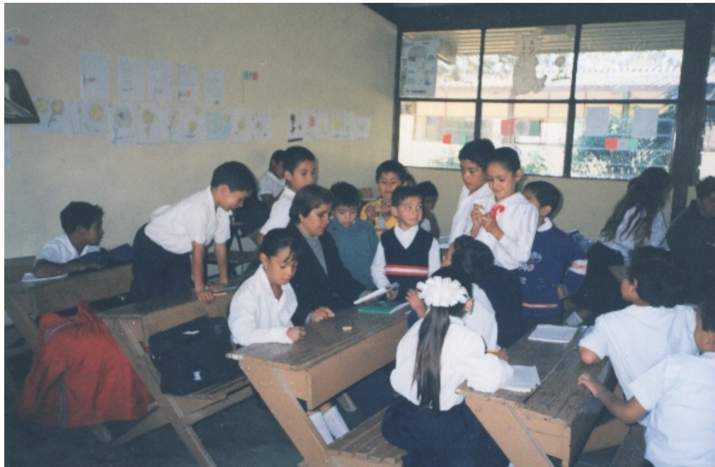
Alumnos recibiendo indicaciones de un padre de familia