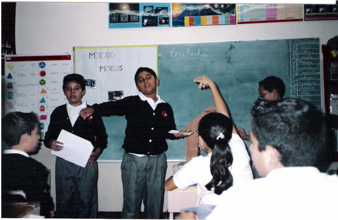
Alumnos exponiendo la investigación realizada sobre el “Mercado Morelos” de Zamora Mich.