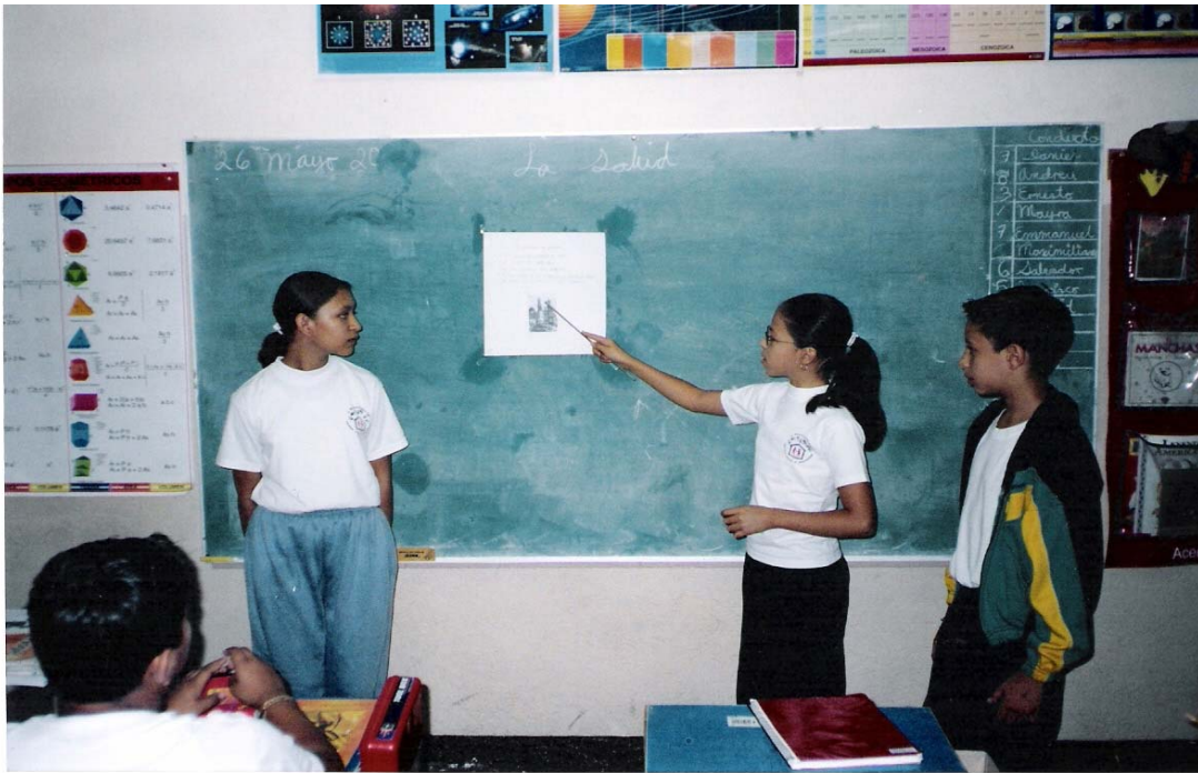
Alumnos Explicando la fundación de la Catedral de Zamora Michoacán.