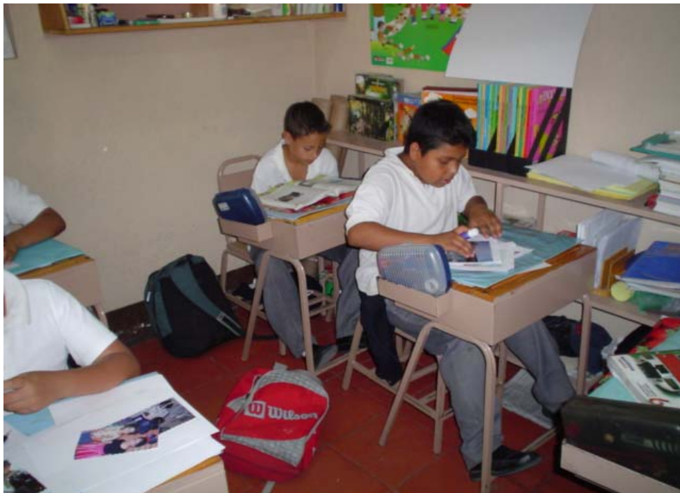
Alumnos redactando "La Historia de mi familia"