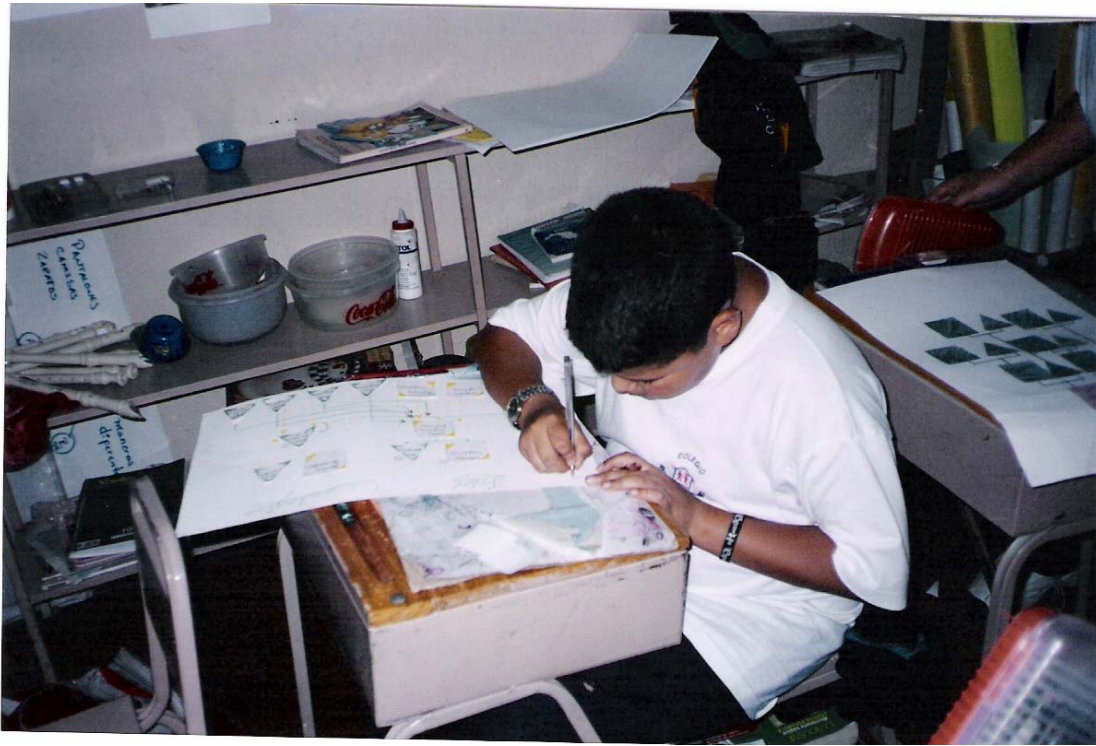
Elaborando su árbol Genealógico.