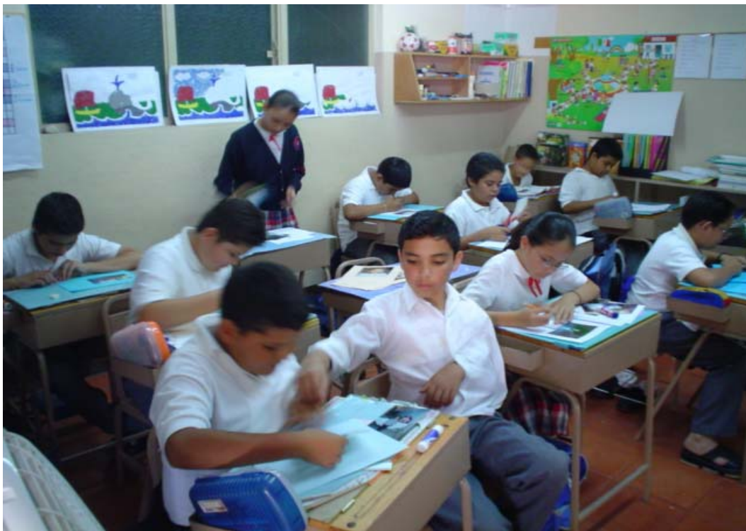
Alumnos redactando "La Historia de mi vida"