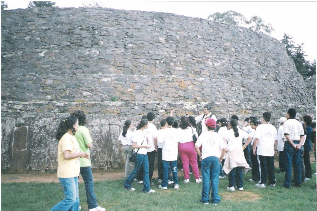
Los alumnos al pie de una Yácata en "Tzintzuntzan"