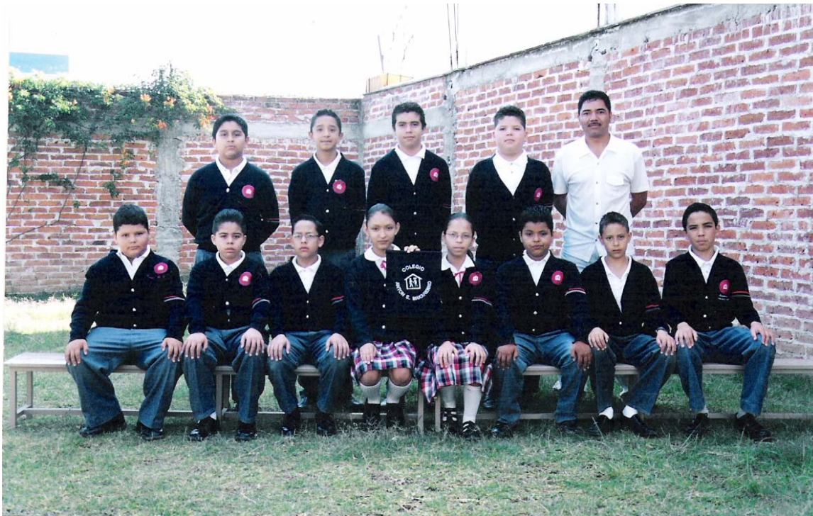
Grupo de Sexto grado. Un buen equipo de trabajo