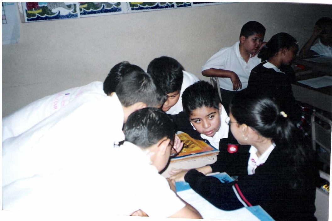
Los equipos preparándose para la investigación sobre la entidad de "Tzintzuntzan y Pátzcuaro"