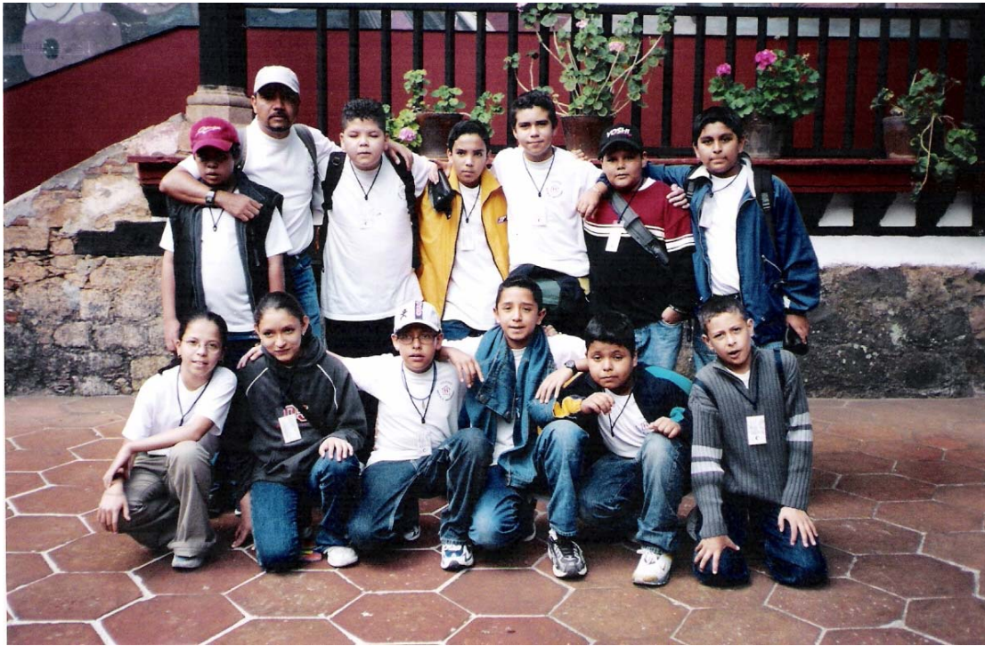
El equipo de trabajo en Pátzcuaro.