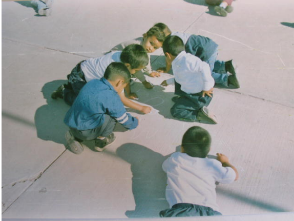
Estrategia 8 “Saludémonos Diariamente”