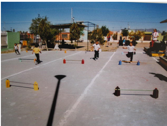
Estrategia 7 “Transformándonos en objetos”