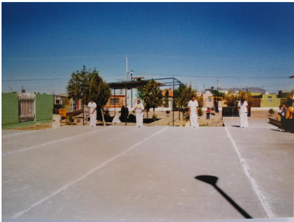
Estrategia 3 “Carreras de costales”