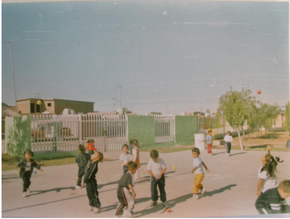
Estrategia 5 “Pelotas Flotantes”