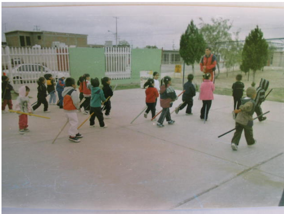
Estrategia 2 “Mover nuestro cuerpo”