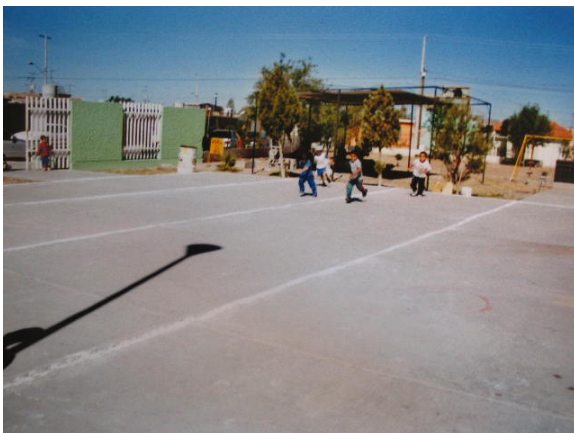
Estrategia 6 “Juguemos con los costales”