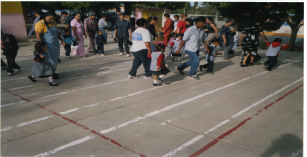
Padres de familia participando con sus hijos en una clase de música