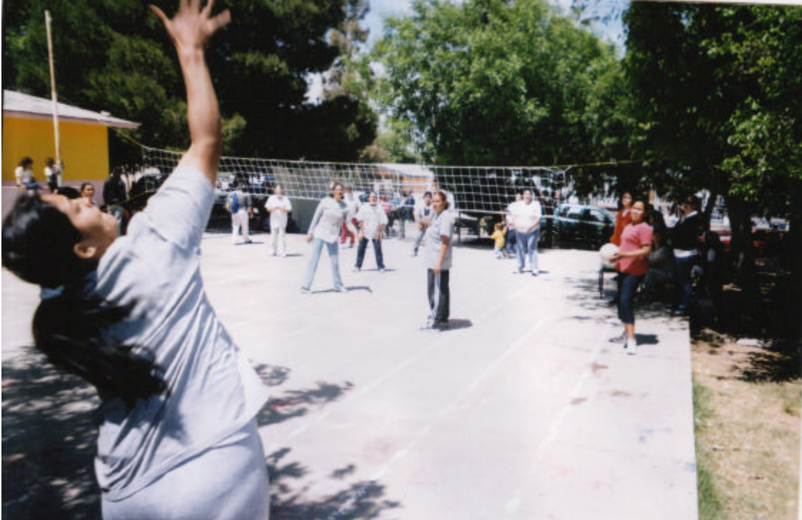
Padres de familia jugando un partido del torneo de voli bol