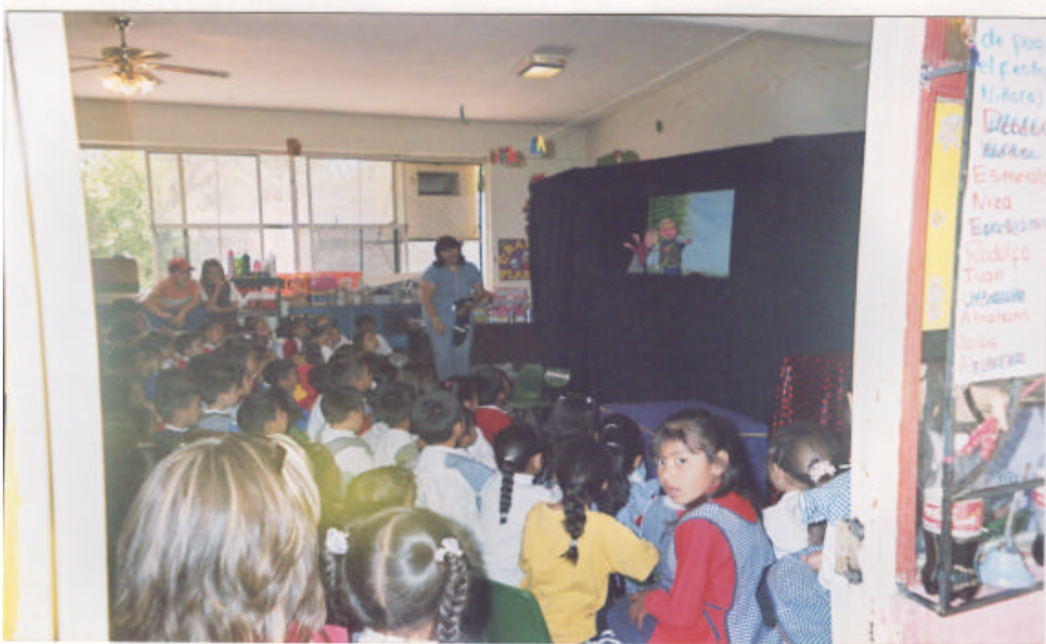
Función de títeres presentada por los padres de familia de primero a los niños del jardín