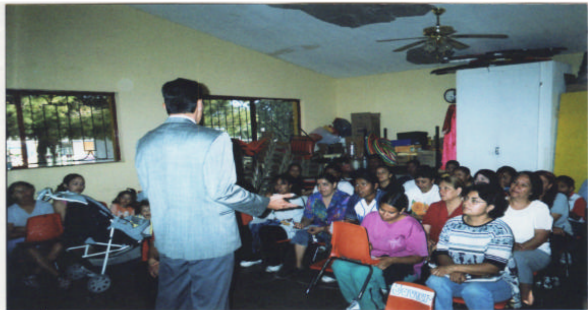
Madres de familia asistentes a la conferencia