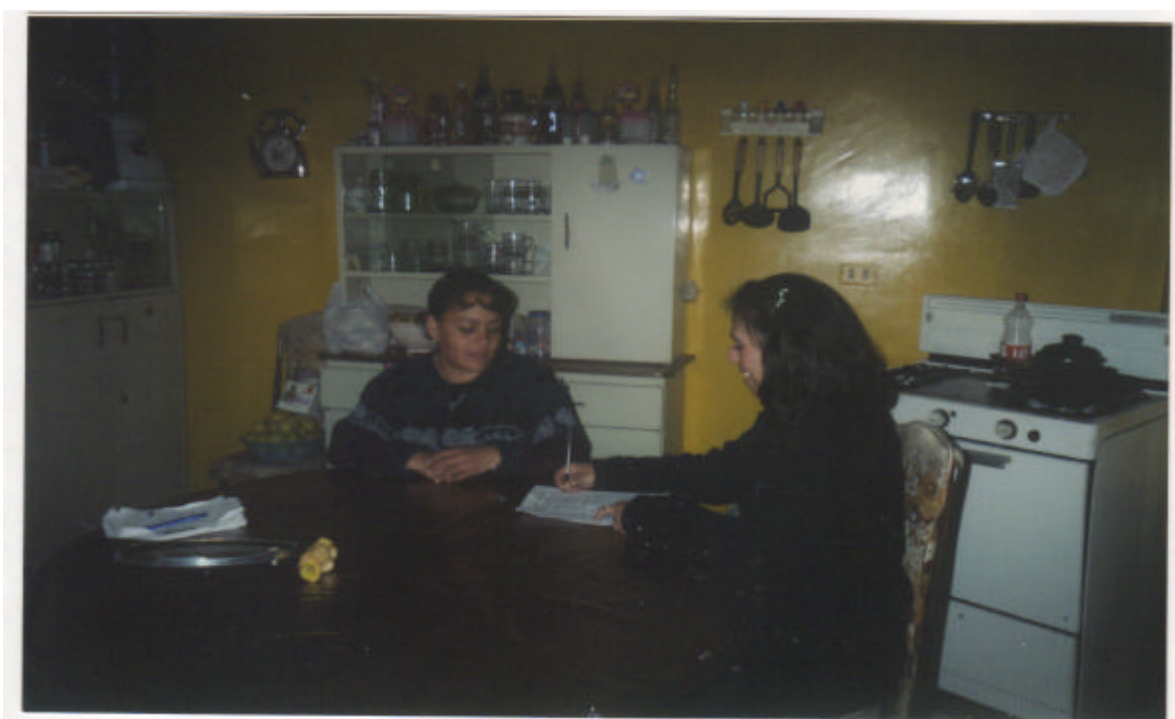
Entrevista a los padres de familia en sus hogares