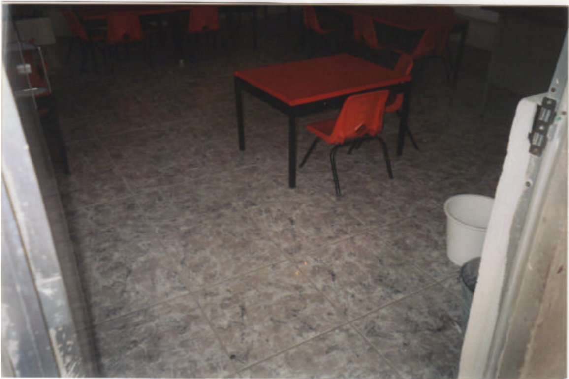
Salón de primer año con el piso instalado