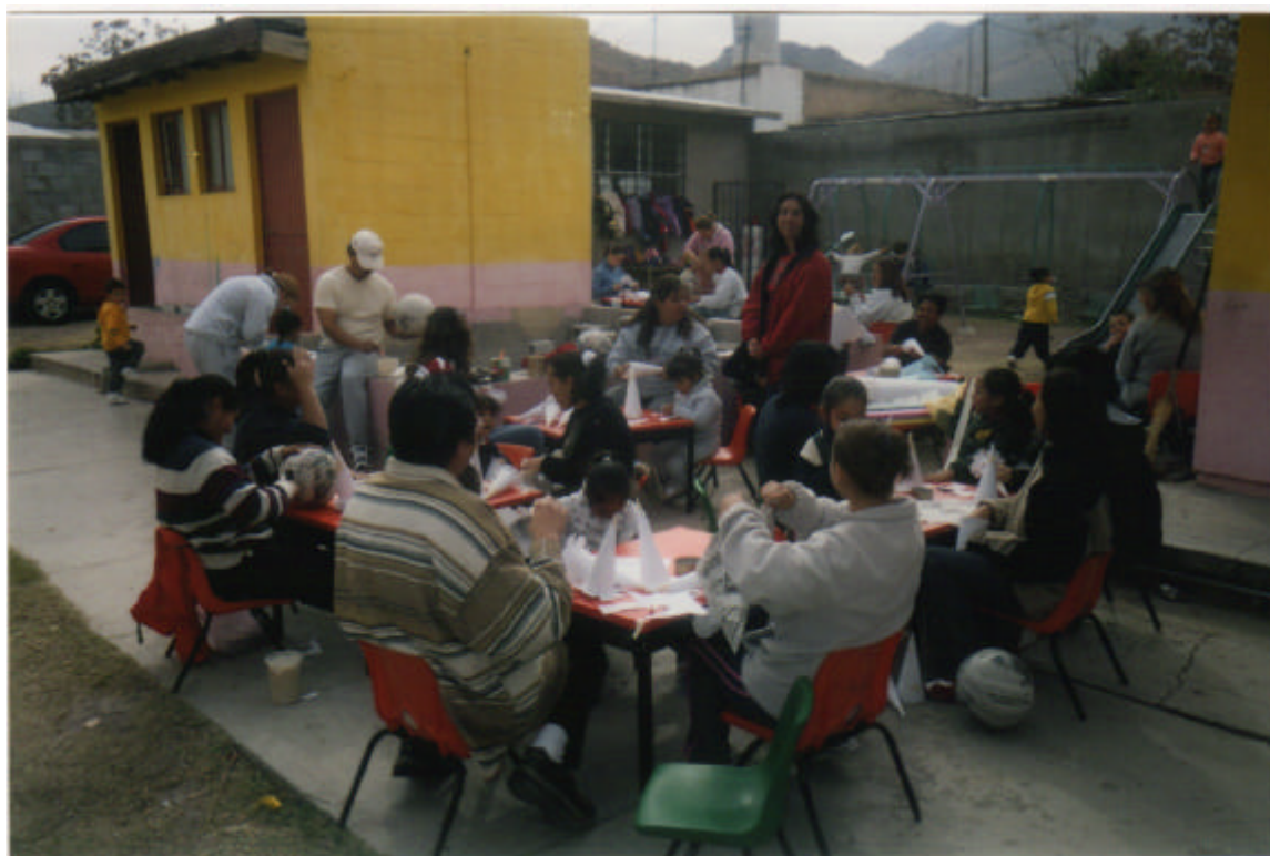
Elaboración de piñatas por los padres de familia y sus hijos