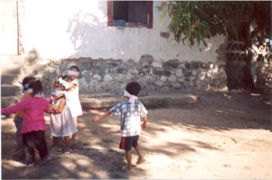
Estrategia # 2 (Actividad)