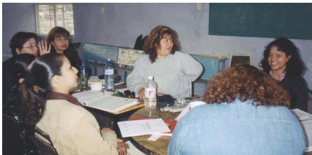
Anexo 5. Nombramiento del Consejo Técnico Escolar para el ciclo escolar 2003-2004, en la sede de la USAER.