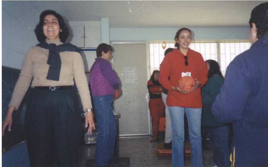
Anexo 16. Taller con Padres de Familia sobre “Atención a las Necesidades Educativas Especiales”.