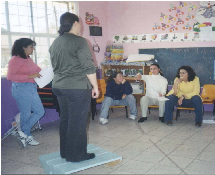
Anexo 10. . Reunión Colegiada con las maestras del Jardín Unidad, con el tema "Disciplina dentro del aula".