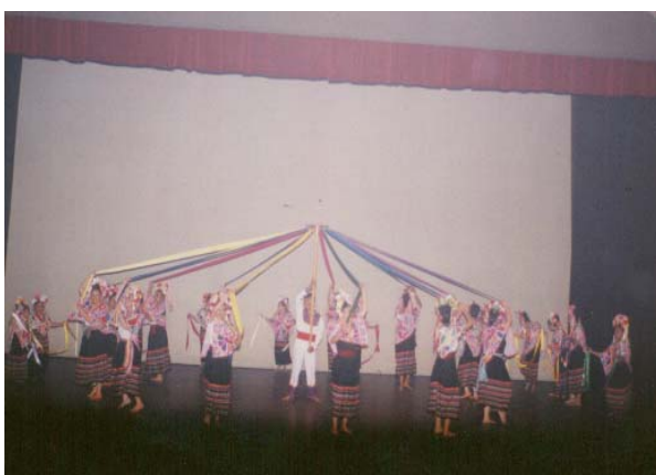
"Danza de Xochipiltzahuac" (Huasteca)

También las danzas fueron utilizadas para la fertilidad como: la danza de las cintas o palo mayo, que aun se practican en la Huasteca y Yucatán.