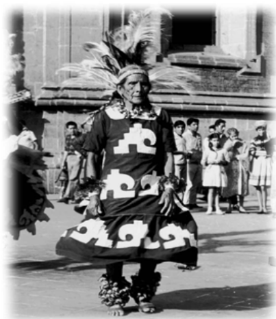
"Danza de Concheros"

En estos tiempos la danza religiosa ha tomado gran importancia en los días festivos: como el 12 de diciembre, una festividad muy significativa para México, día en el cual se llegan a ejecutar diferentes danzas de conquista, utilizadas para honrar y venerar a la Virgen de Guadalupe.