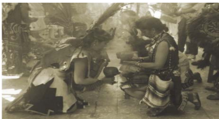
"Ritual de Concheros"

La Danza Primitiva. Se utilizaba para las ceremonias religiosas, para implorar la lluvia y así tener buenas cosechas, moviéndose a ritmo de los instrumentos rudimentarios de percusión que existían en esa época.