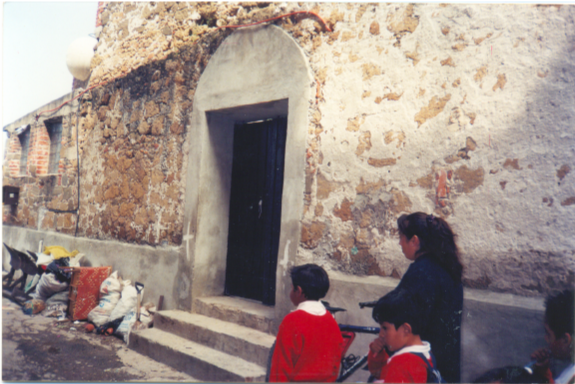
Casco de la Hacienda de San Miguel Bocanegra