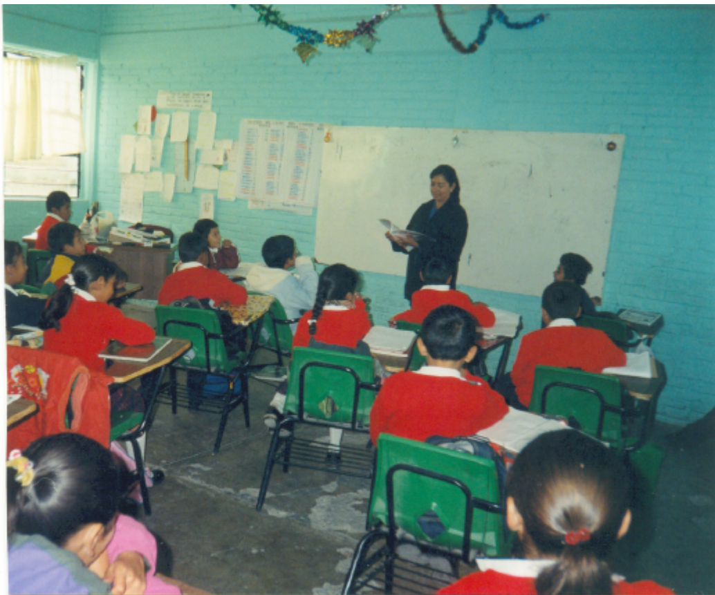
Madre de familia participando en las clases.

Gracias a las técnicas Freinet obtuve estos resultados: el grupo de niños es muy participativo en clase, la mayoría de ellos aprende rápidamente. Les motiva mucho las actividades de los ficheros, de ellos sacamos bastantes ideas para trabajar. El grupo es muy tranquilo a excepción de dos niños que son muy inquietos y son los últimos en terminar los trabajos. Otro punto de motivación para los niños es saber que las mamás están con frecuencia participando en la escuela.