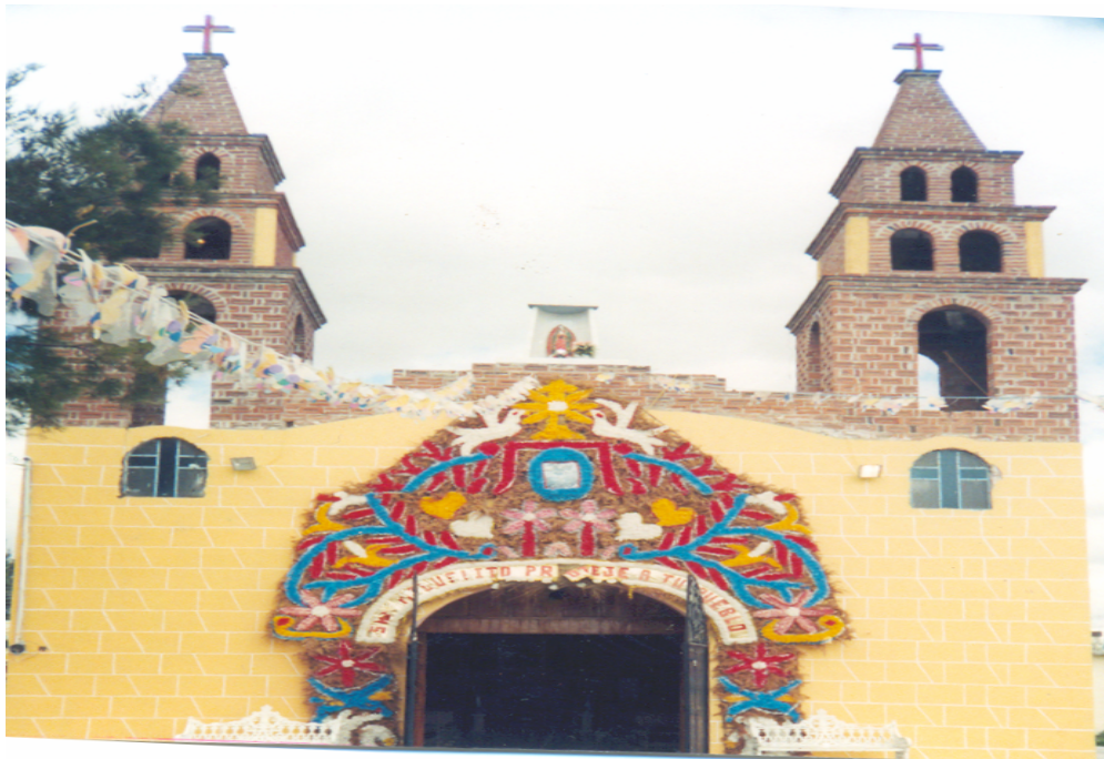
Iglesia de San Miguel Bocanegra.

El 29 de septiembre todos en el pueblo hacen comida, por las tarde hay juegos mecánicos y por la noche hay música de banda y juegos pirotécnicos. La gente convive y disfruta mucho de la fiesta. Además acude bastante gente de los pueblos vecinos.