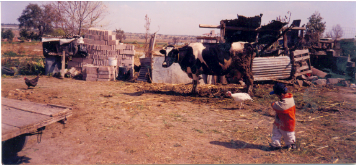
Condiciones en las que se encuentran los animales del campesino.

Entre los animales que se encuentran dentro de la localidad están el ganado: bovino, ovino, caprino, porcino y aves de corral.