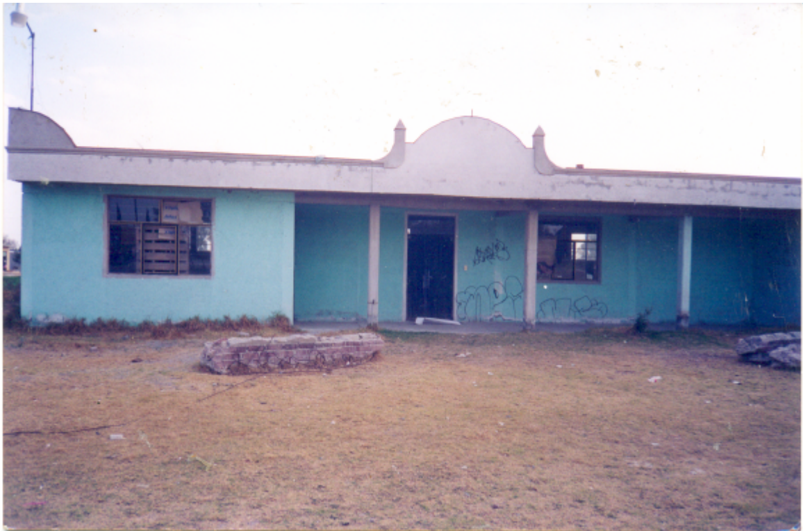
Delegación de San Miguel Bocanegra

En el pueblo se encuentra la presencia de dos partidos políticos: el PRI y el PRD. Estos no han contribuido a generar un ambiente de convivencia en el pueblo ya que se han presentado conflictos por cuestiones electorales.