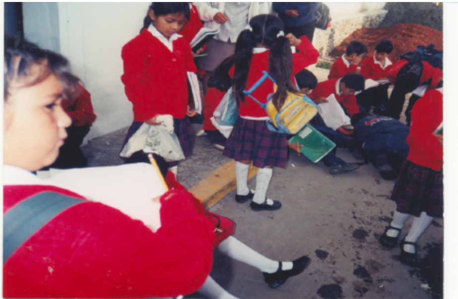
Sentados en plena banqueta escribiendo.

La ruta a seguir fue la siguiente: primero visitamos la tienda, en donde pedí a los niños encargados de hacer aquí su entrevista empezaran con ésta. Mientras tanto, los demás niños entraron a la tienda, observaron cuidadosamente todo y salieron a hacer sus anotaciones.