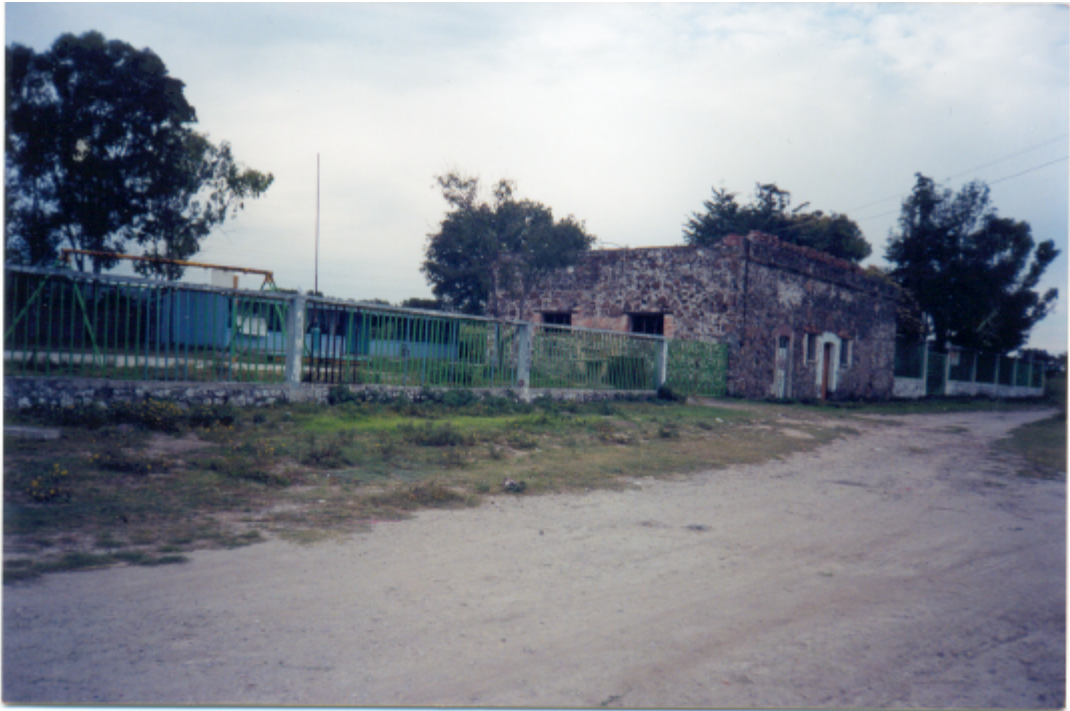
Escuela Primaria "Emiliano Zapata"