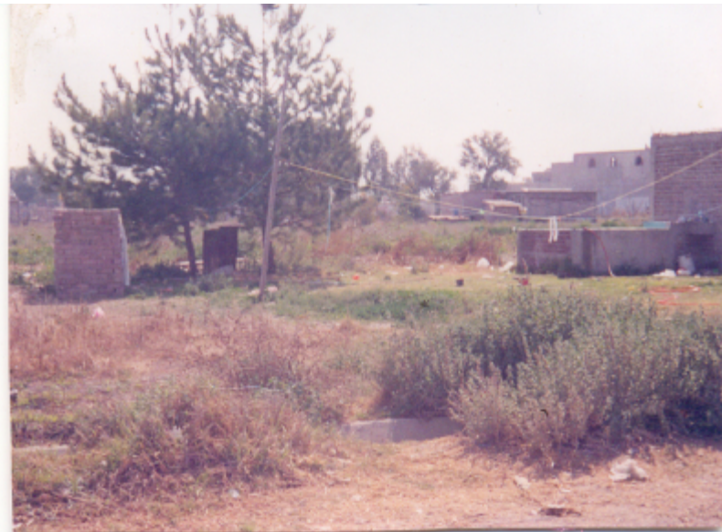
Aquí vemos una de las letrinas.

En el pueblo no se cuenta con drenaje público, la mayoría de las casas tienen solamente letrinas, que por cierto se encuentran en malas condiciones. Esto para los niños es perjudicial ya que han contraído diarrea, hepatitis, infecciones, entre otras enfermedades.