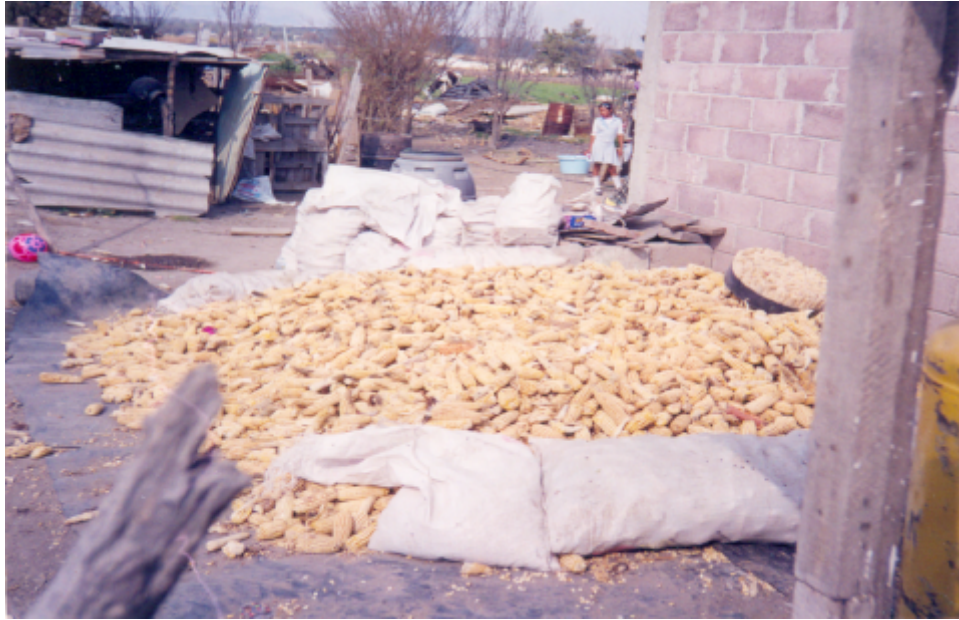
Cosecha de maíz.

Entre los animales que se encuentran dentro de la localidad están el ganado: bovino, ovino, caprino, porcino y aves de corral.