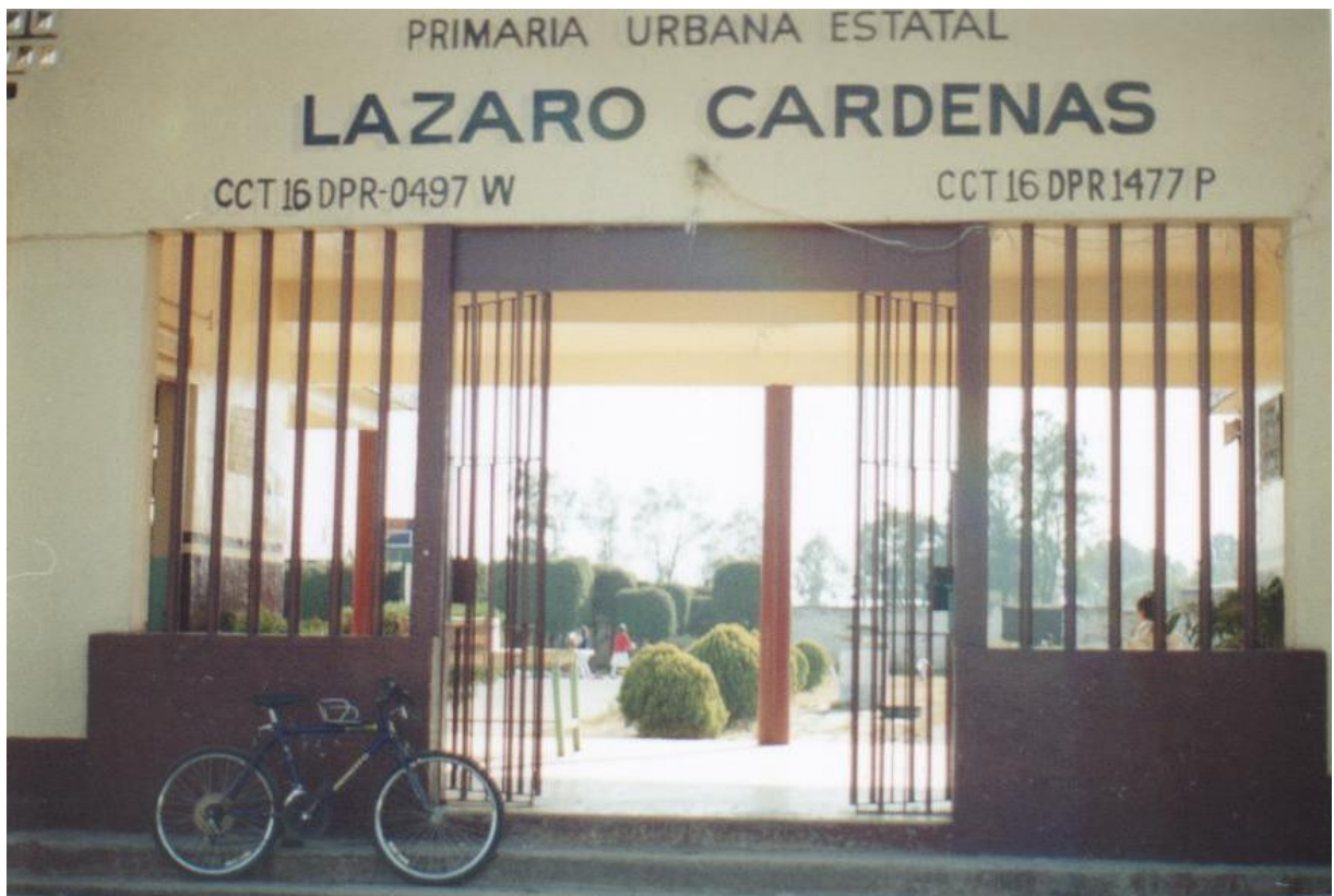
Foto 3 Entrada secundaria a la escuela Lázaro Cárdenas

Las familias son gente trabajadora que se preocupa por la educación de sus hijos y les compran los útiles necesarios; los trabajos que desempeñan la mayoría de sus padres son: panaderos, comerciantes, albañiles y algunos profesionistas. Es en esta comunidad rural-urbana, a la que se llega por la carretera nacional que une a la ciudad de Zamora, donde tuvo lugar la experiencia que en este trabajo se presenta. La escuela Lázaro Cárdenas tiene una gran reja de entrada y con varios jardines, le sigue otra reja junto con el recibidor, al lado derecho está la dirección, a un lado de ésta están las aulas con un corredor y al fondo los baños de los niños, del lado izquierdo están también salones; con otro corredor los baños de las niñas. Al centro de todo esto se encuentran dos grandes canchas que hacen destacar en medio de