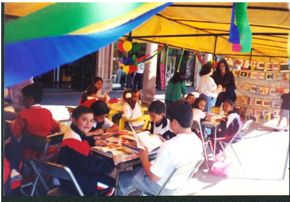
Niños trabajando en los talleres