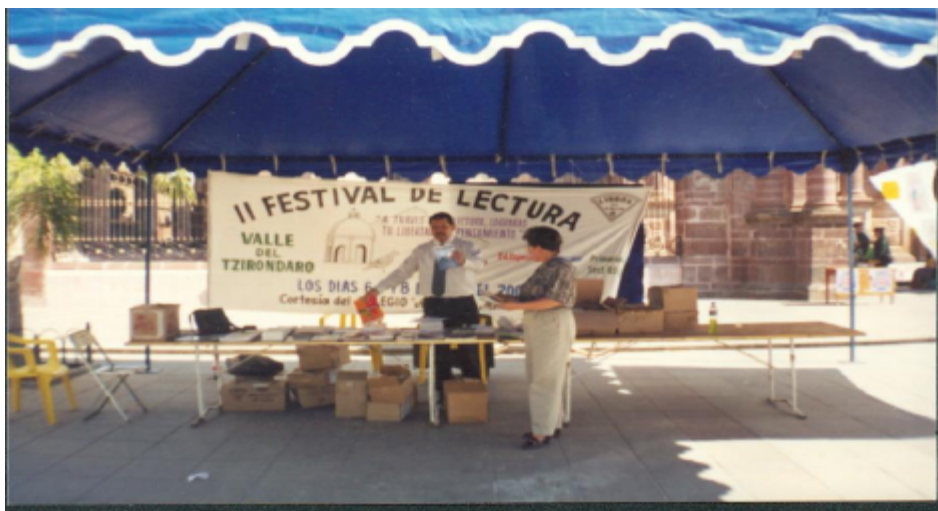
Exhibición y venta de Libros