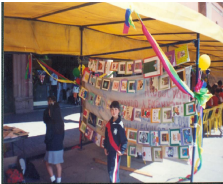
Exhibición de libros en una de las Escuelas

Hemos constatado mediante visitas hechas a las escuelas de que sí se está trabajando.