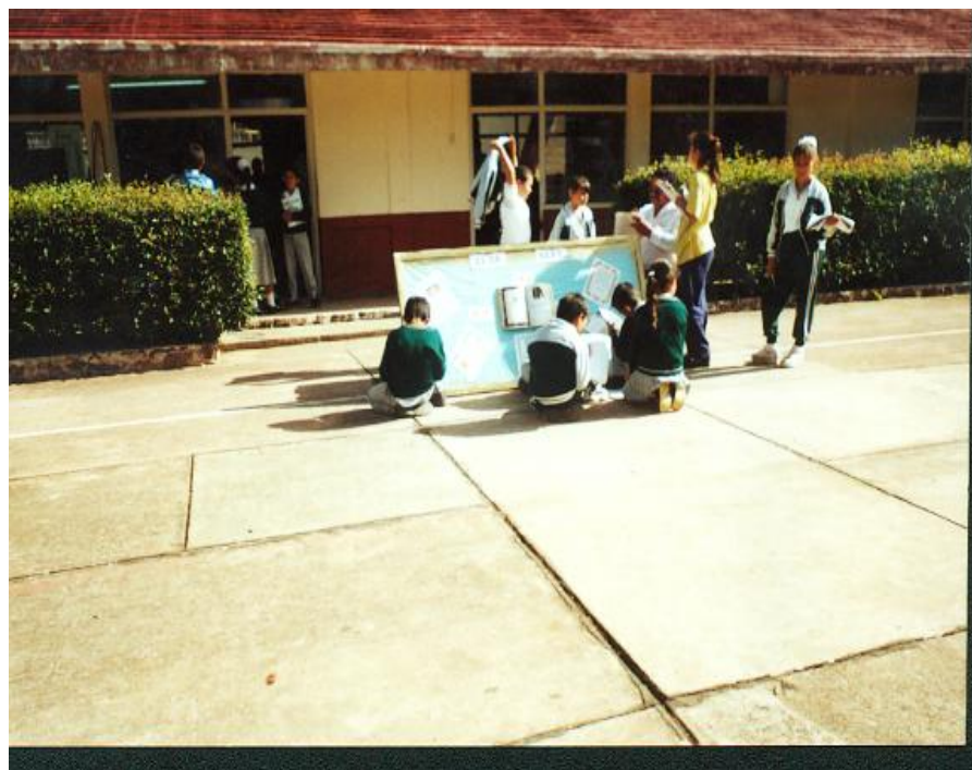
Niños aplicando su aprendizaje

El pensamiento de Rodari nos anima a mirar los textos desde distintos puntos de vista, a crear y recrear valores, a rescatar la importancia del juego en el aprendizaje, a recuperar la experiencia del sujeto, y a permitirle elegir.