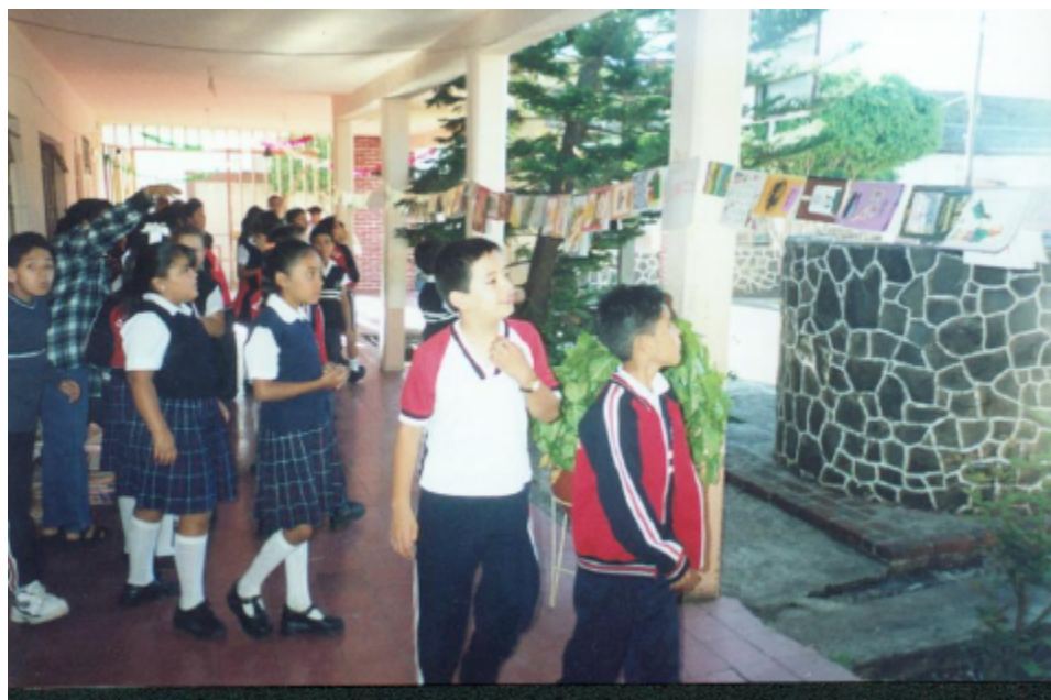
Niños explorando sus libros del Rincón

¡Esta es una vía para aprender a leer y a escribir!