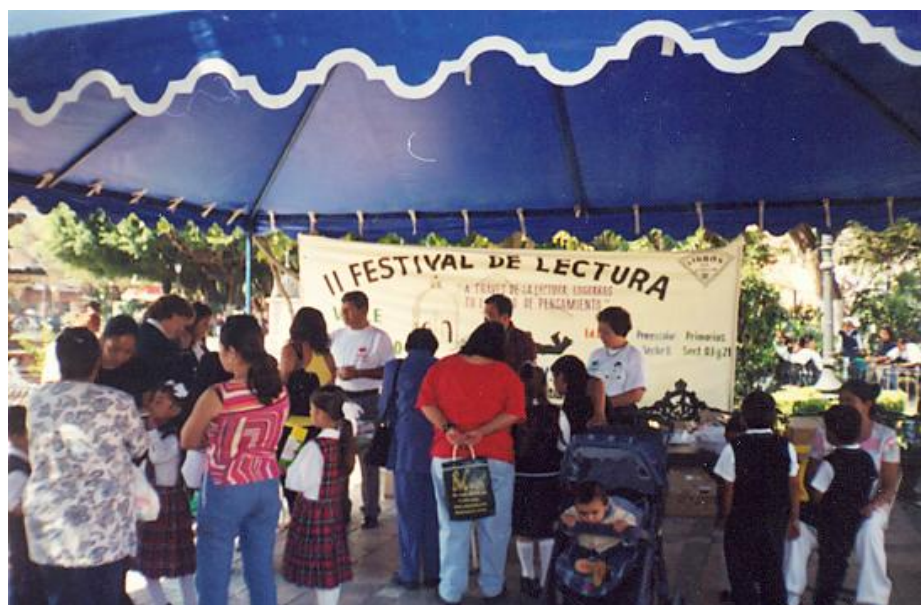
Exhibición y venta de Libros

El día 7 se realizaron 10 talleres para niños con los siguientes nombres: