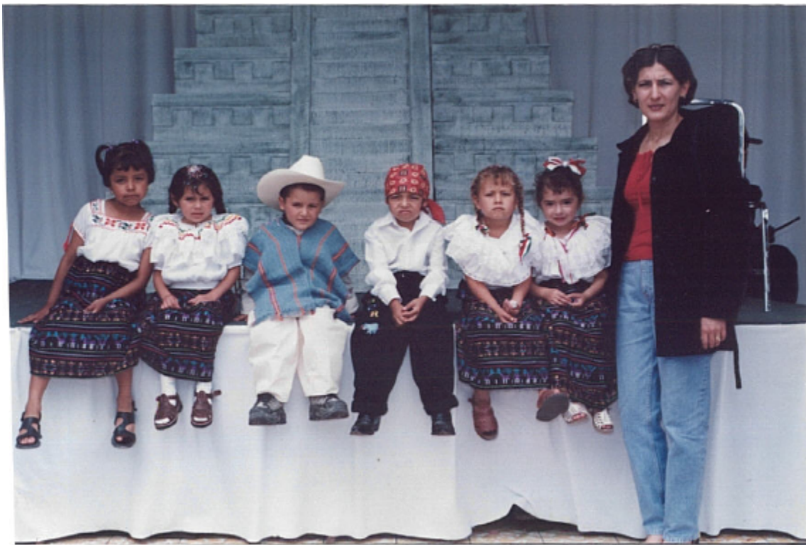
ANEXO N° 2: Clausura de la generación 2000 – 2001