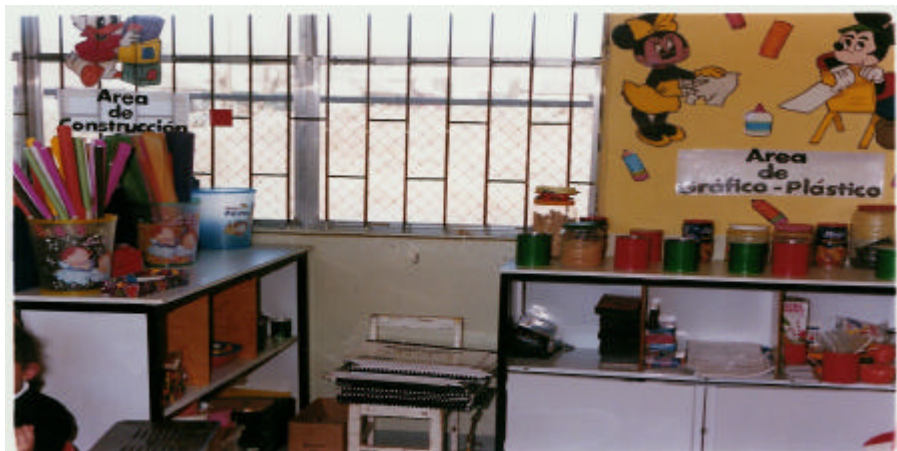
AREA DE GRAFICO - PLASTICO