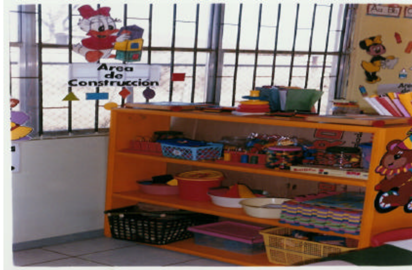
AREA DE CONSTRUCCION