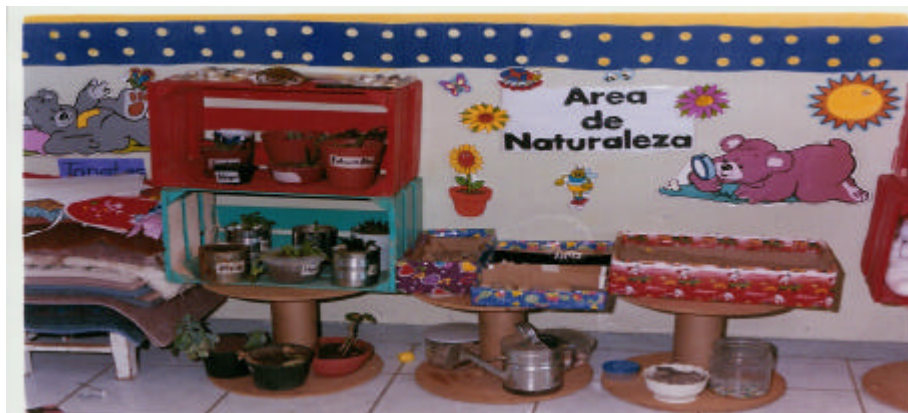
AREA DE NATURALEZA