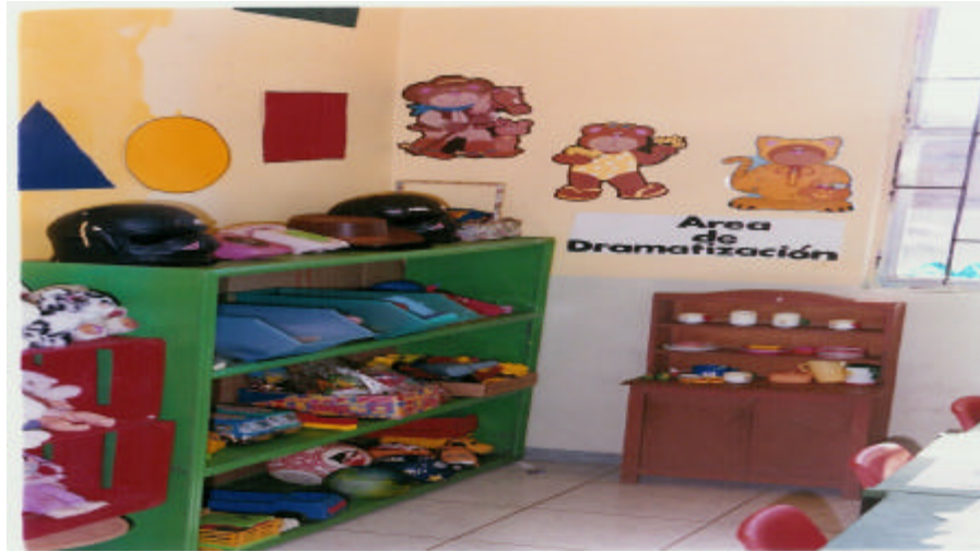
AREA DE DRAMATIZACION