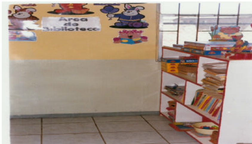
AREA DE BIBLIOTECA