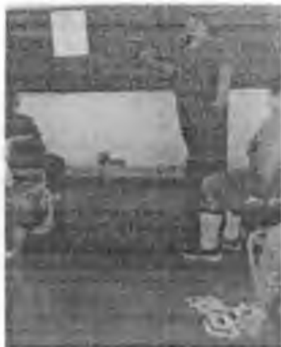
Ficha "Mi Problema" (7)