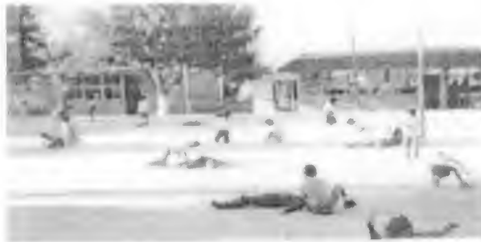
Ficha "Nuestro Cuerpo" (5)

Mediante el dibujo los niños fueron capaces de reproducir el cuerpo humano e identificar algunas de sus partes empleando así su expresión artística.