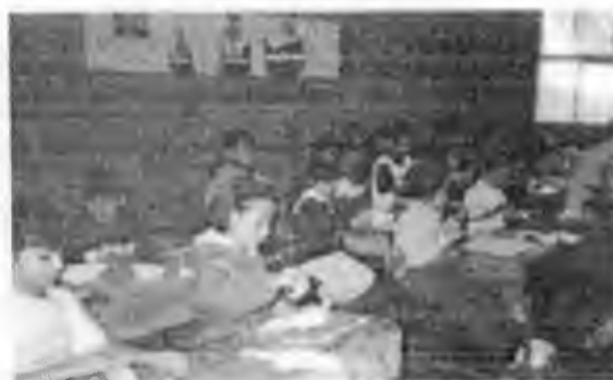
Ficha "Las Carabelas" (11)