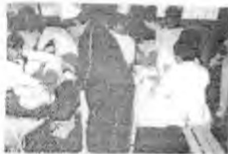
Ficha "Cruz Roja" (29)