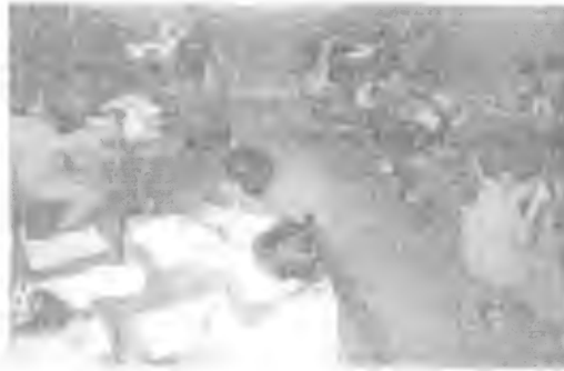
Ficha "Cuadro de Babelas" (18)

Los alumnos expresaron verbalmente sus comentarios sobre la actividad que desarrollaron, definieron con claridad las dificultades que tuvieron para armarlo y la manera de cómo consiguieron formar los cuadros. Estas expresiones de los niños se relacionan con la asignatura de Español.