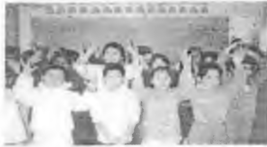
Ficha "Independencia" (3)