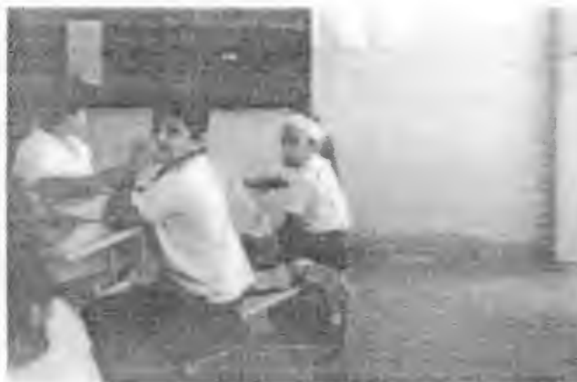
Ficha “¿Niño Problema?” (4)

Esta ficha se relaciona con la asignatura de Español debido a que propició en los alumnos la reflexión en base al tema, esto sirvió para que expresaran libremente sus ideas y de esta manera formular preguntas sobre el tema y a la vez proponer alternativas de solución.