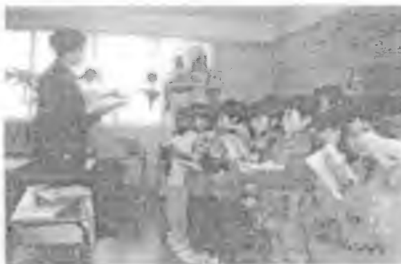
Ficha "Villancicos" (23)