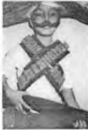
Ficha "20 de Noviembre" (19)