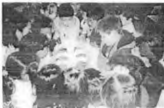
Ficha "Rosca" (25)