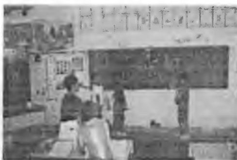
Ficha "Naturaleza" (21)