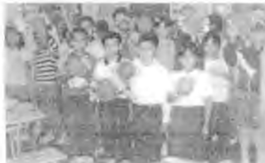
Ficha "Naciones Unidas" (15)