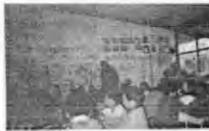
Ficha “El Príncipe Feliz” (28)