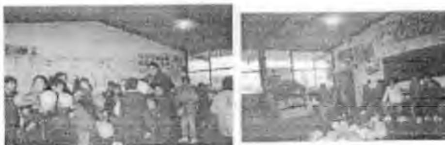
Ficha “Los Globos” (27)

Los alumnos se emocionaron al ver los globos de colores, siguieron las indicaciones como se esperaba, según el nombre del compañerito que le correspondió, al elegir y reventar los globos redactaron escritos amistosos y se los entregaron. Por lo tanto esta ficha se relaciona con la asignatura de Español.