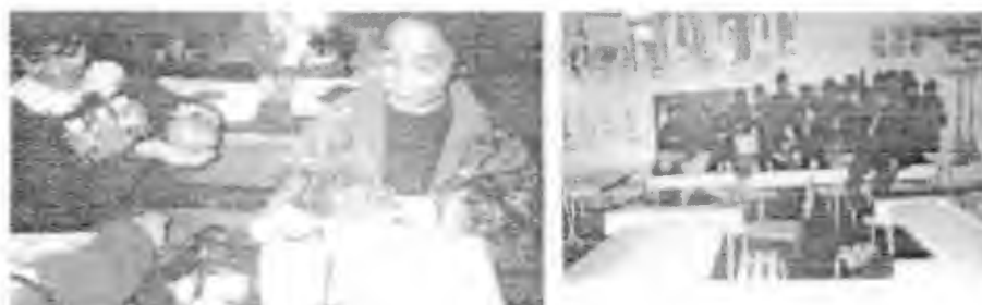
Ficha “Esferas” (24)

Los alumnos estuvieron atentos para elaborar una esfera, estaban ansiosos por manejar el material requerido, realizaron el proceso pacientemente, se observó su satisfacción al verla terminada. Dicha ficha se relaciona con la asignatura de Educación Artística.