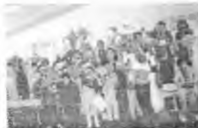
Ficha “La Piñata” (22)