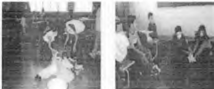
Ficha "Diálogo" (6)