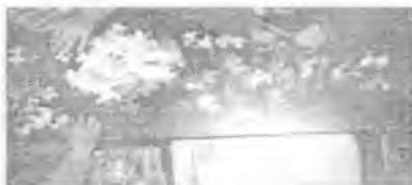
Ficha "Rompecabezas" (20)