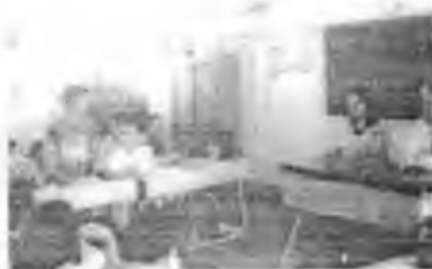
Ficha “Comité de Seguridad Escolar” (14)