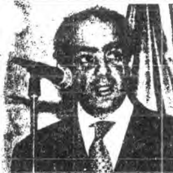
LUIS TELLEZ tomó posesión ayer como secretario de Energía. Era jefe de la Oficina de la Presidencia de la República, puesto que fue sustituido por las coordinaciones de asesores para Política Exterior y para Económica y Social