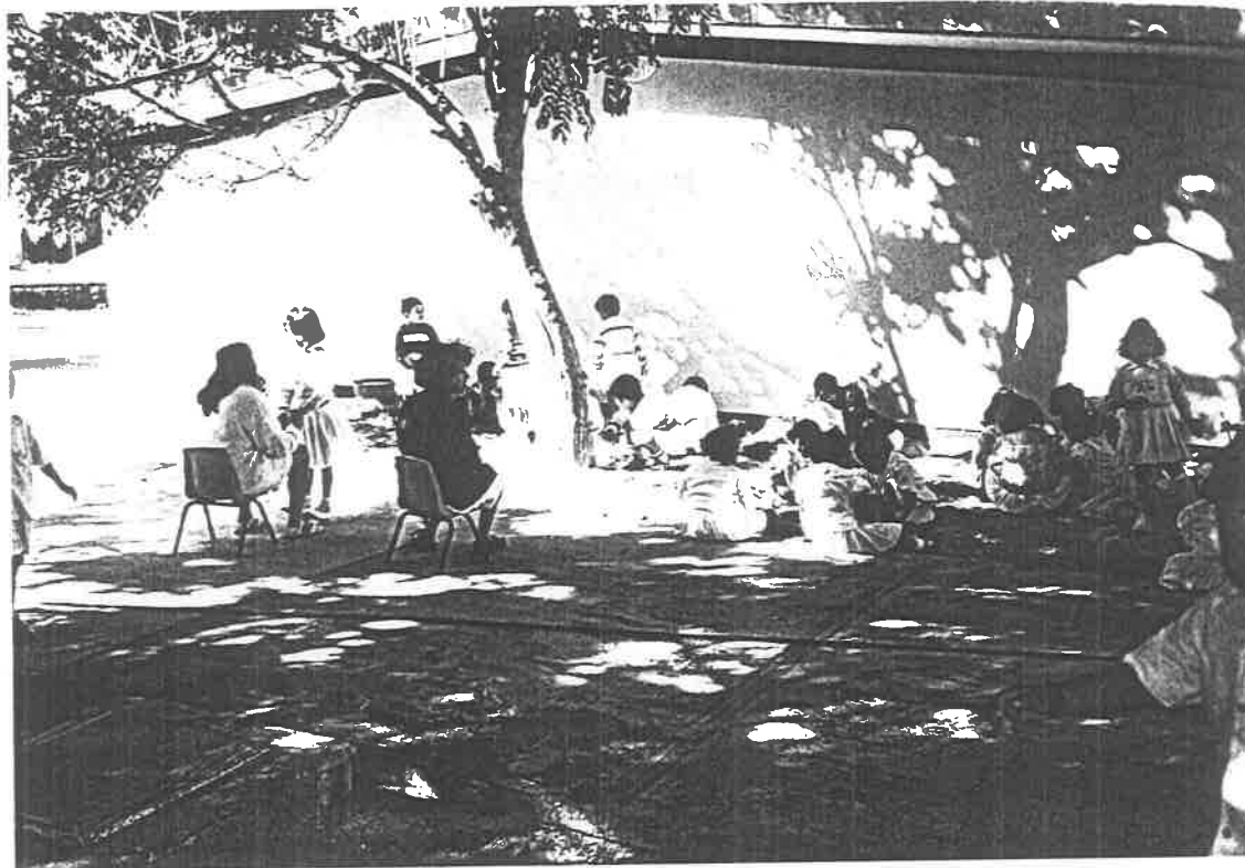
La educadora "cuida y vigila" el recreo