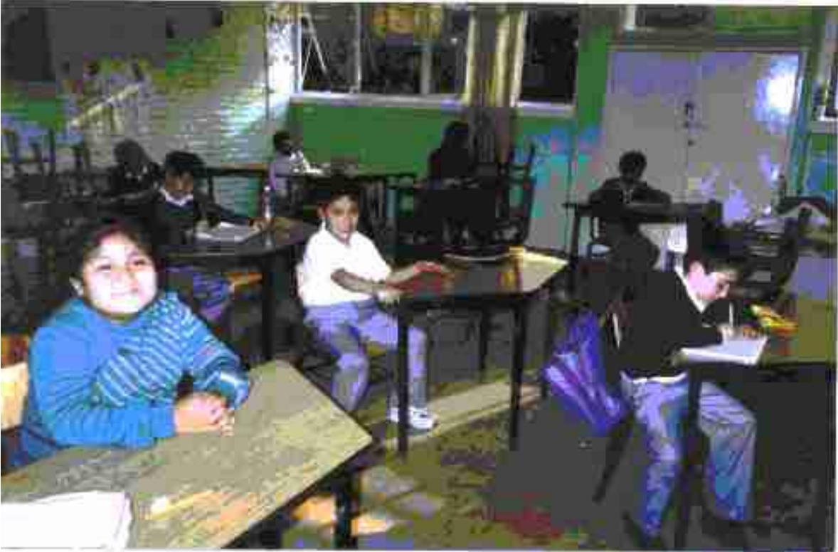
TRABAJO EN CLASE