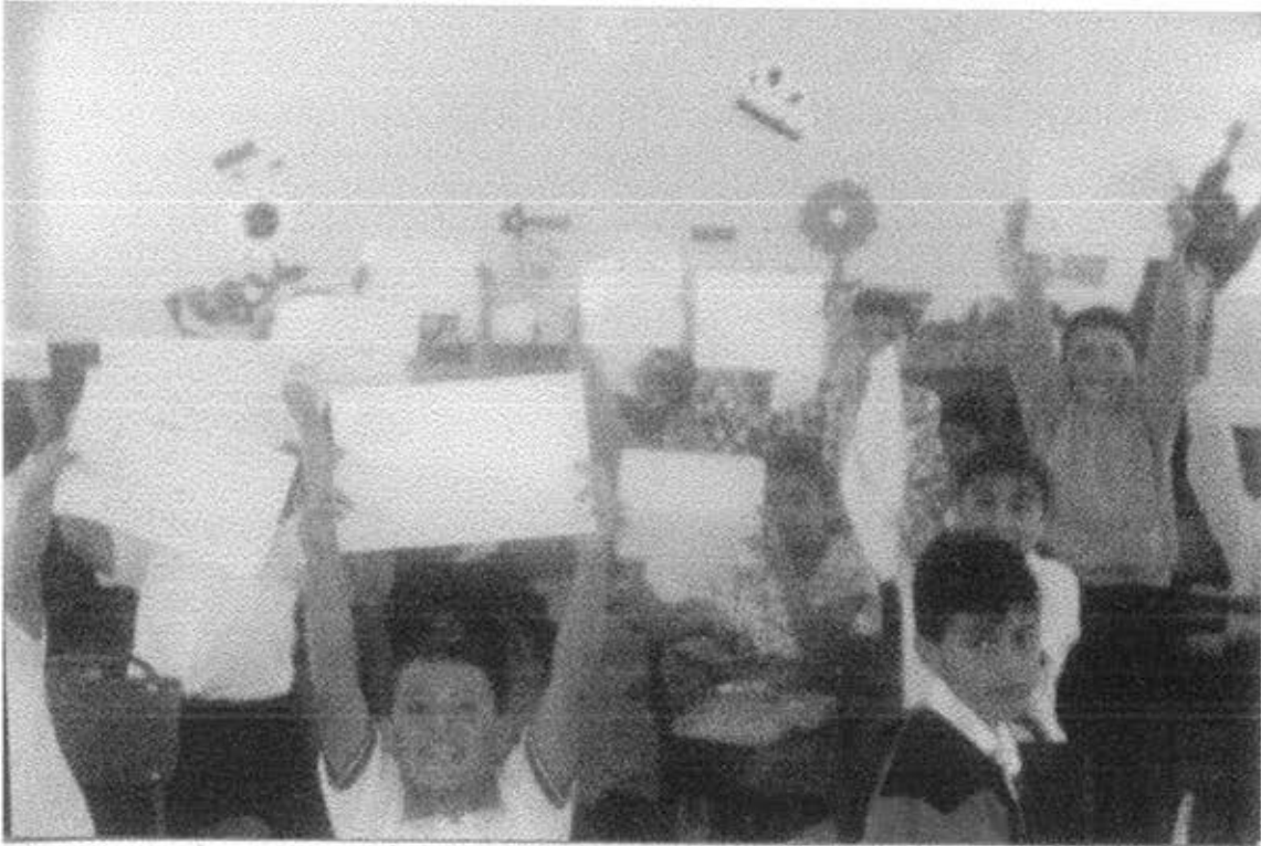
En un clima propicio, los alumnos pueden lograr excelentes creaciones.

El niño es espontáneo, y expresa cuándo no tiene ganas de "crear", por eso es importante tratar que el alumno esté en una atmósfera tranquila y libre de interrupciones.