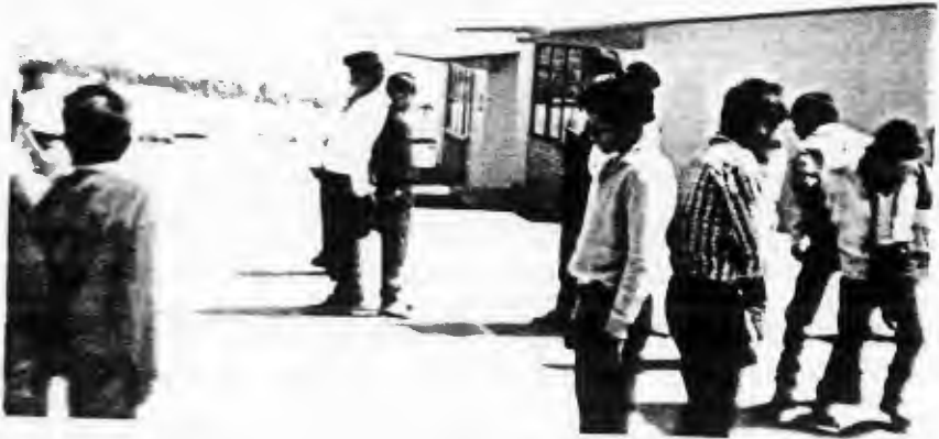
APLICACIÓN DE LA DINAMICA "EL REY Y SUS SIRVIENTES"