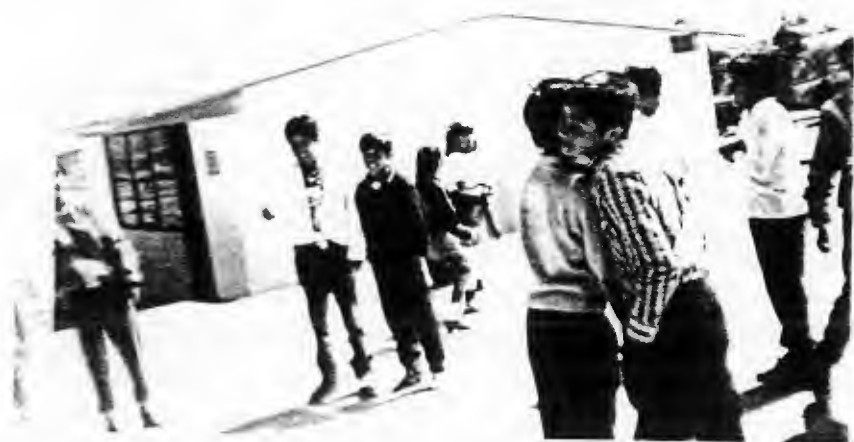
REALIZACION DE LA DINAMICA "PASANDO LA FRUTA"