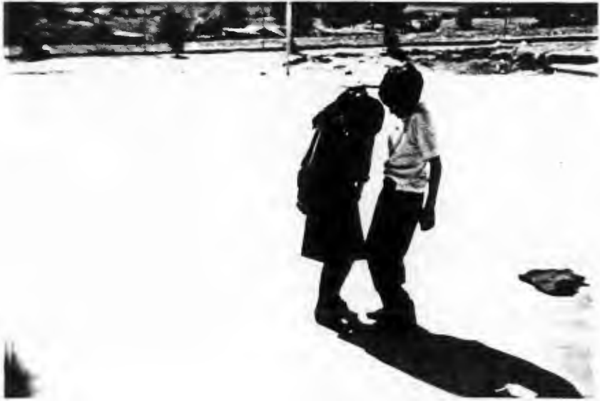
REALIZACION DE LA DINAMICA "PASANDO LA MADERA"