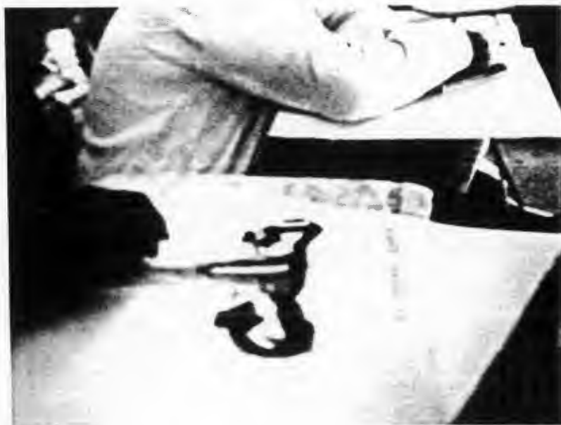
ELABORACION DE LAS MAQUETAS DE LOS APARATOS REPRODUCTOR MASCULINO Y FEMENINO