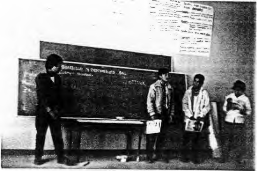
EXPOSICION POR EQUIPOS