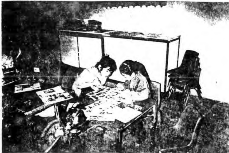
Actividades "Mi Familia y Yo " Elaboración de Periódicos Murales con recortes de revistas.