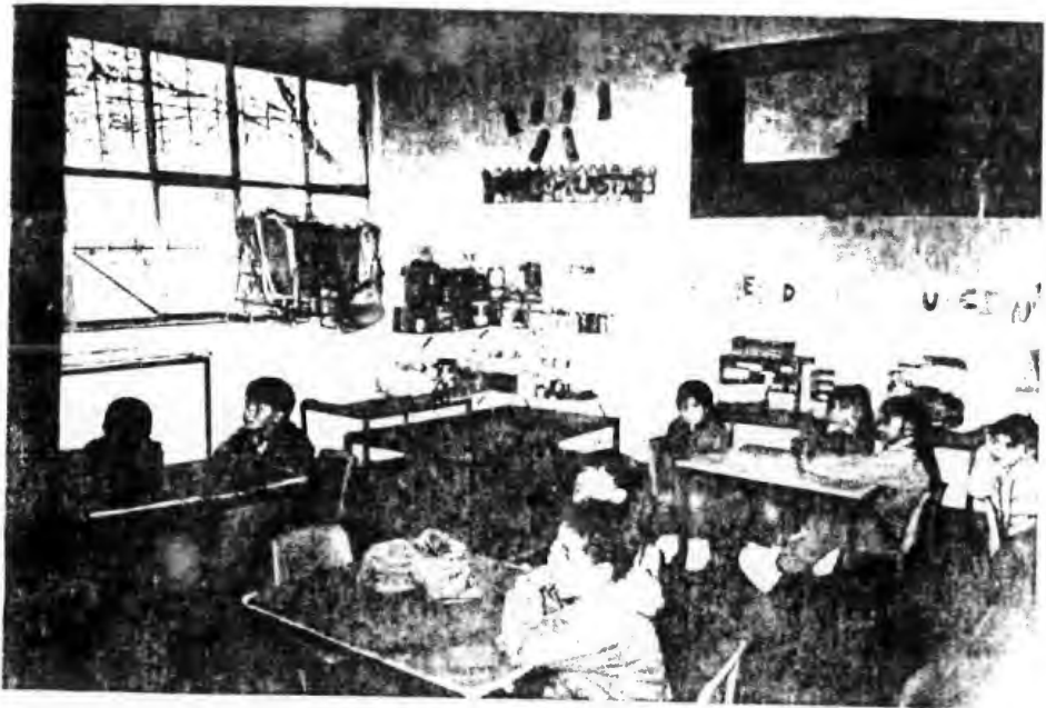
Lectura de Cuento