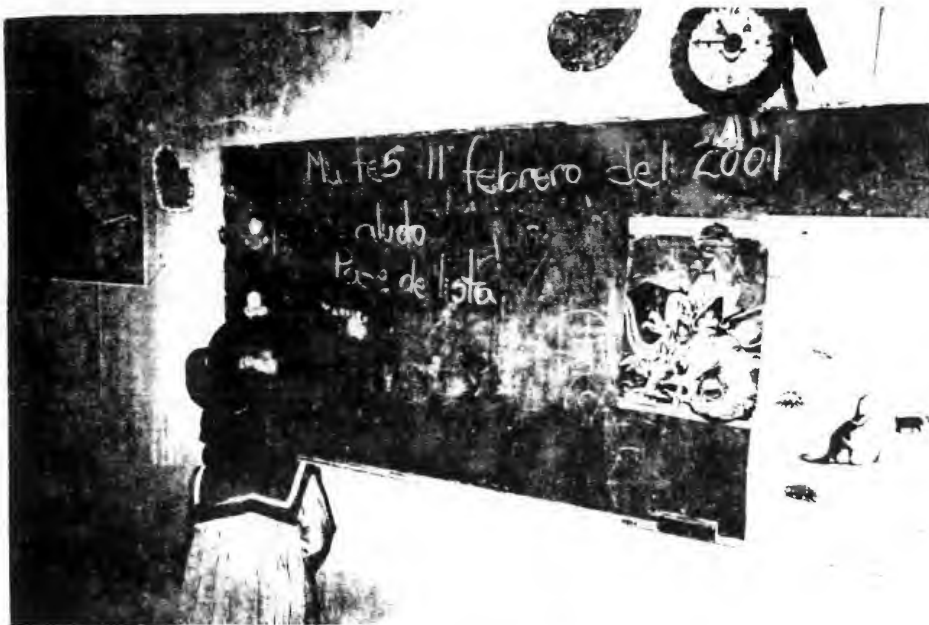
Colocación de Fecha y Copiado