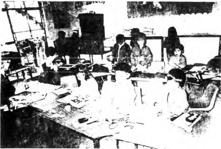
Apertura de proyectos utilizando los libros para recortar y revistas