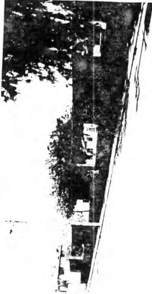
Exterior de la escuela