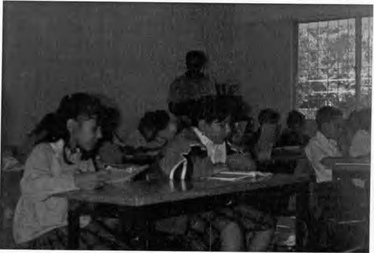
EN PLENA ACCION EN EL PROYECTO DE "MI ENCUENTRO CON LA LECTURA"