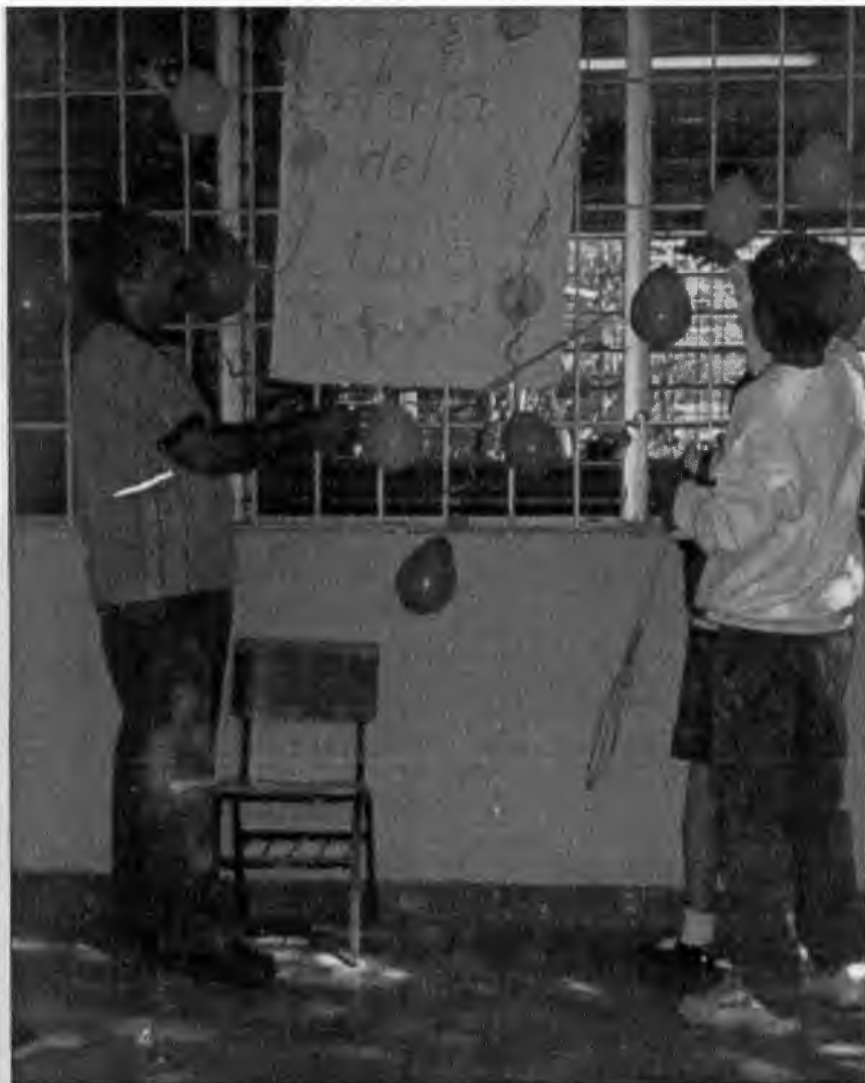
TERMINANDO DE COLOCAR EL LETRERO PARA DAR INICIO A "LA FERIA DEL LIBRO"