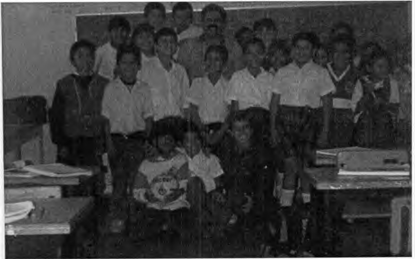
FOTO DEL RECUERDO UNA VEZ DE HABER TERMINADO CON EL PROYECTO.