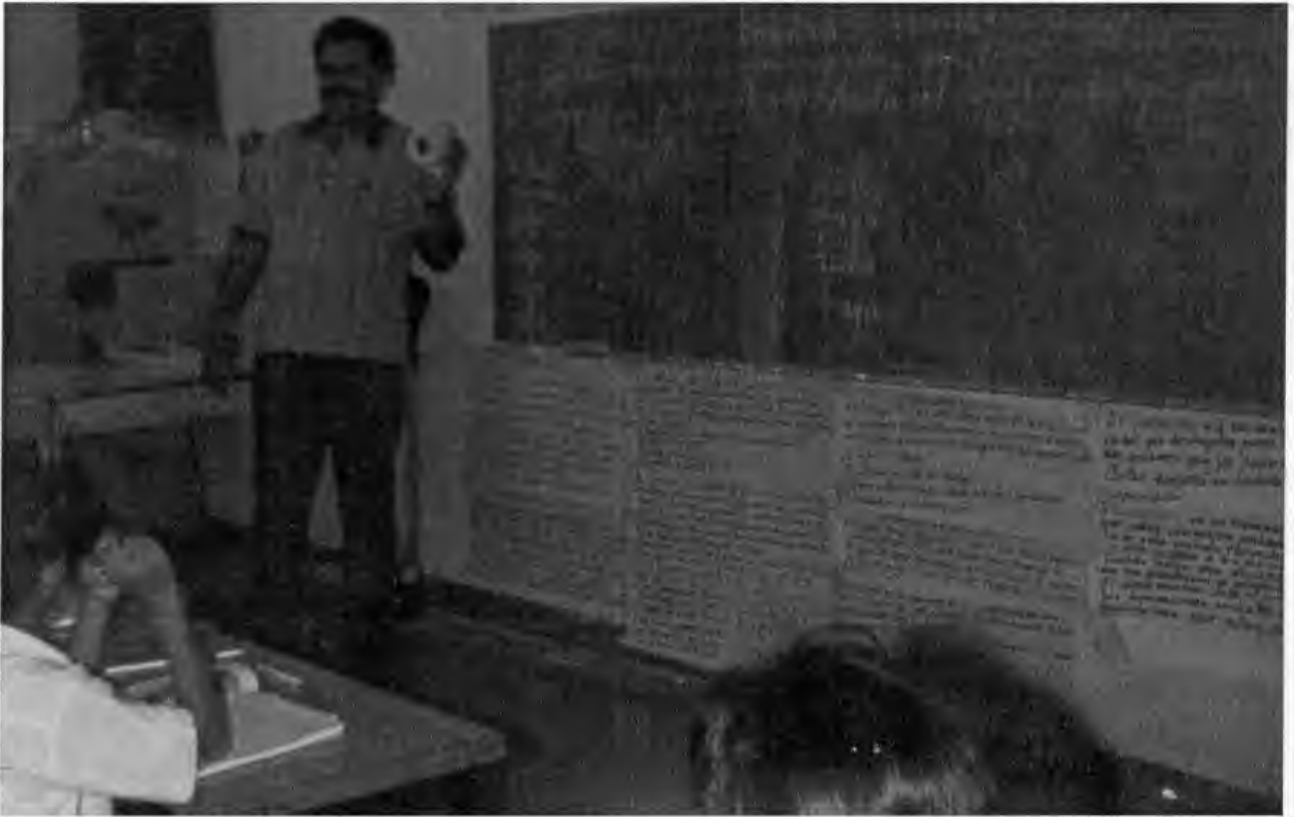
EXIBIENDO LO QUE ES EL PROYECTO DE "MUCHA IMAGEN, POCO TEXTO"