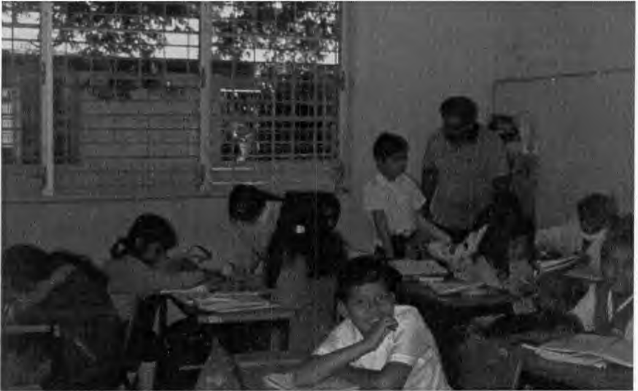
EN PLENA ACCION REVISANDO MATERIAL PARA UN PROYECTO.