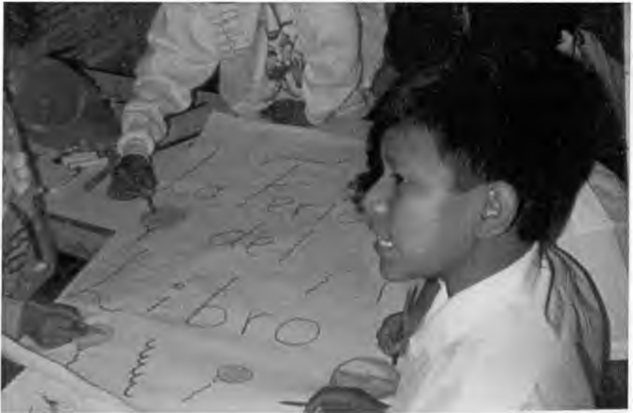
NINOS COLABORANDO EN EL PROYECTO "LA FERIA DEL LIBRO"