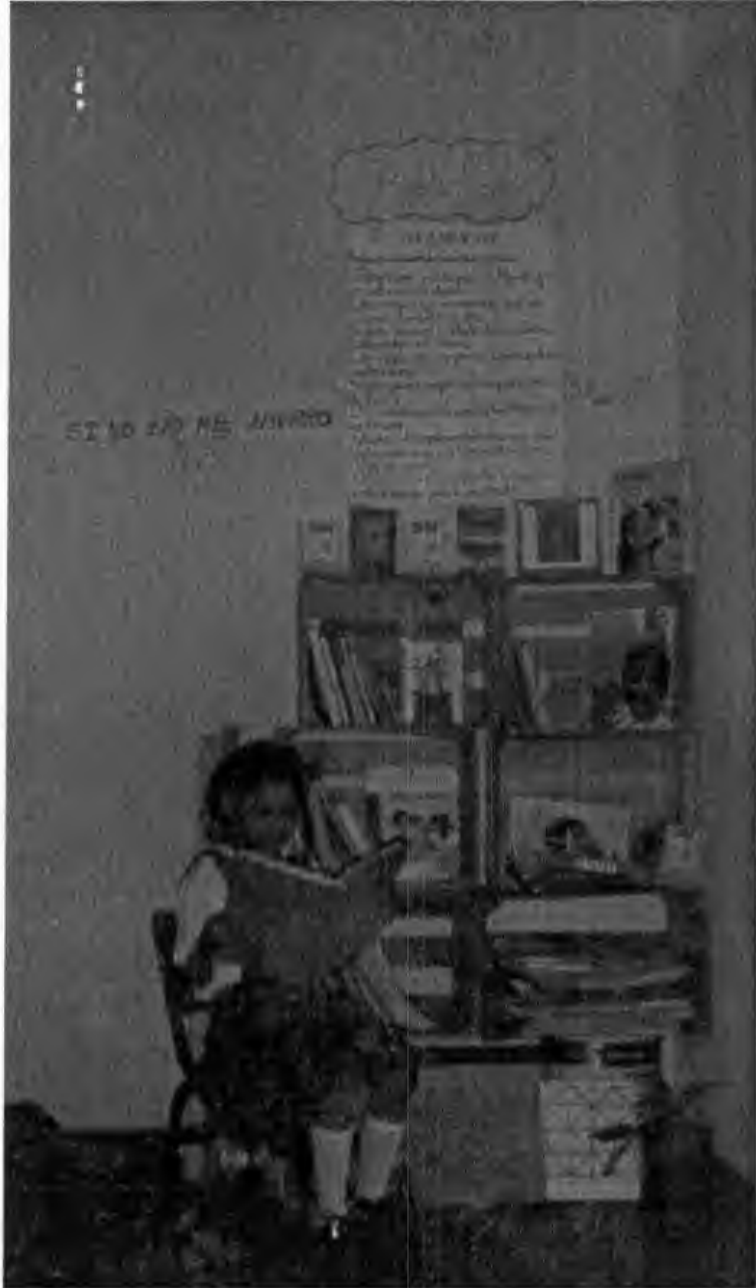
EN LOS RATOS LIBRES UNA ALUMNA PRACTICA LA LECTURA JUNTO A LA "BIBLIOTECA"