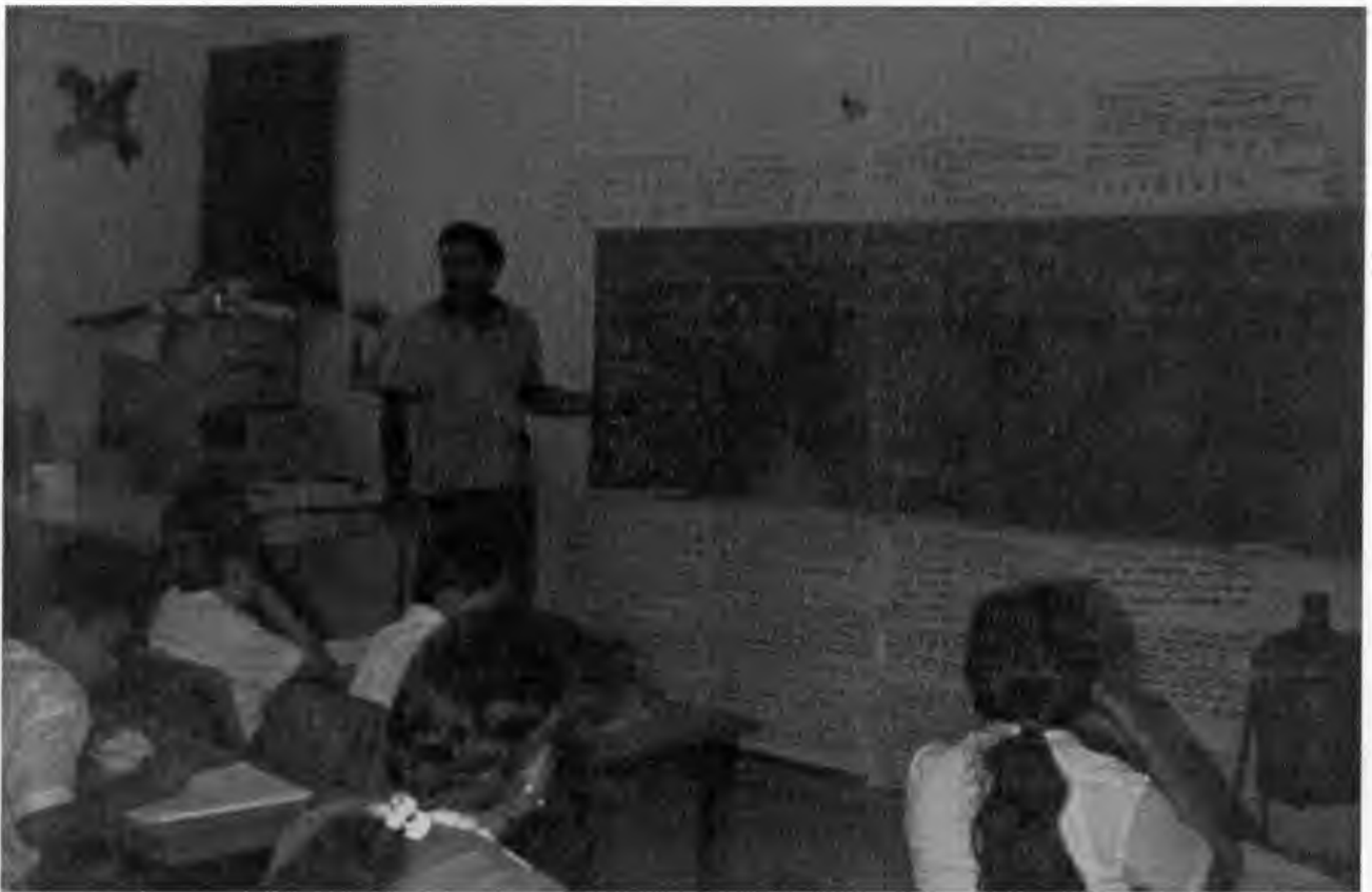
EN PLENA ACCION SOBRE LA EXPLICACION DE UN TEMA.