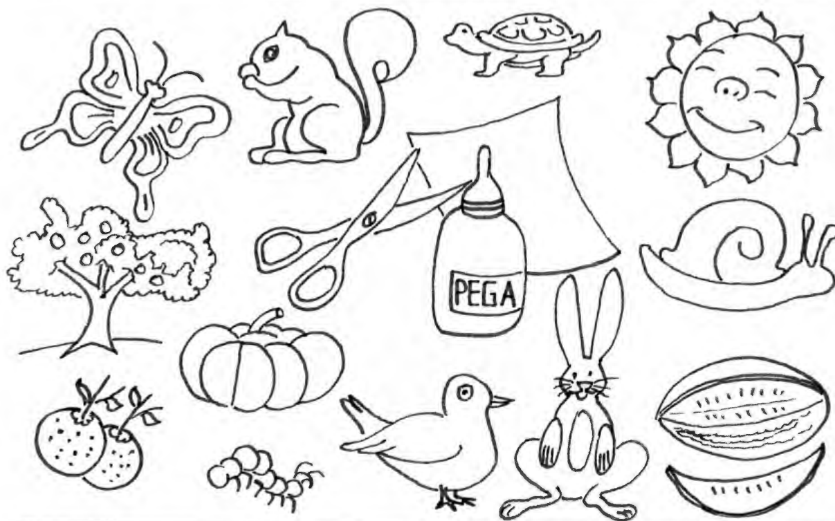
FRISO LA PRIMAVERA

se argumenta que en preescolar el niño lee y escribe, porque interpreta su mundo y externa sus observaciones.