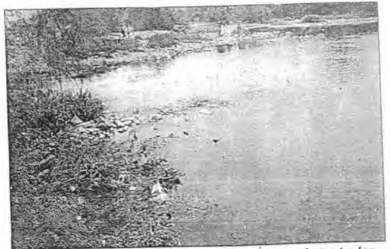
Axtla, S.L.P.- Habitantes de la localidad siguen sin acatar las disposiciones del Departamento de Agua Potable, de no tirar basura, de no bañarse y de no pescar cerca del cárcamo, ante lo cual podrían ser sancionados.

ne una extensión de casi 21,400 hectáreas, dijo, y que es considerada una de las zonas ecológicas más relevantes de la nación, por su contenido en especies endémicas y en peligro de extinción es hoy carne de cañón para empresarios y latifundistas, que se la están acabando por lo que urgía a los funcionarios encargados, vigilen de verdad esa zona del estado, de lo contrario apuntó, nuestros hijos lo lamentarán.