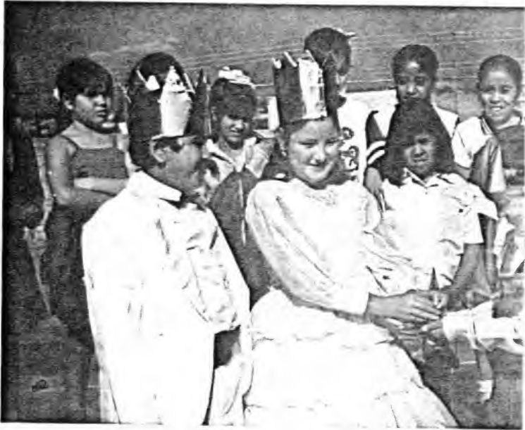
ESCENIFICACIÓN ESTRATEGIA 1