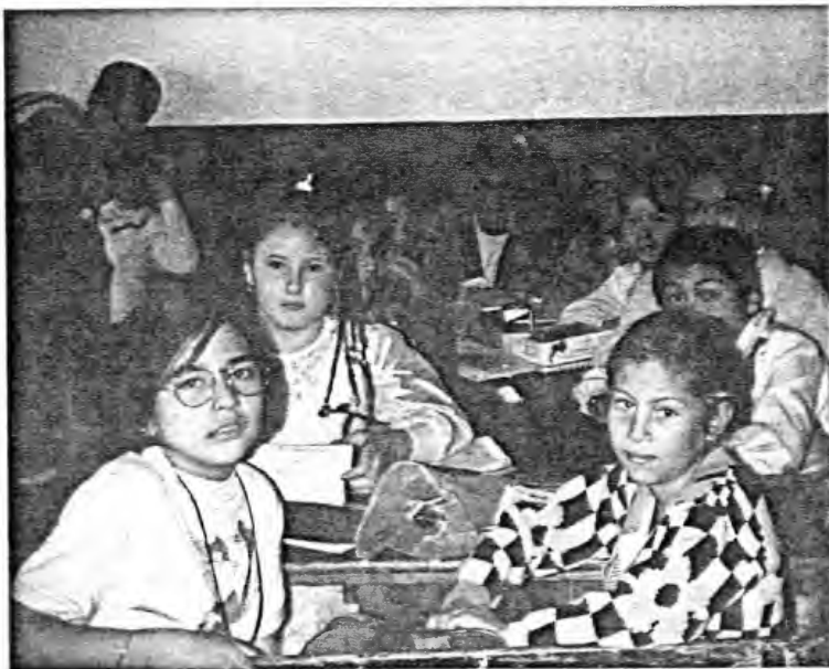
MESA REDONDA ESTRATEGIA 3