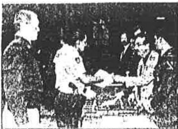
Cadetes recibieron su placa

Egresas generación de la Academia de Policía y Tránsito