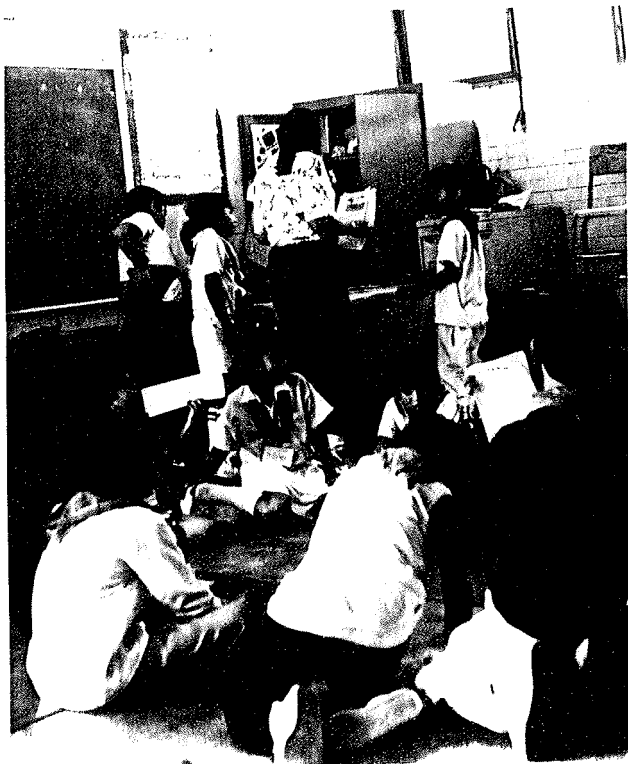
5.- Control natural del grupo. En la parte superior izquierda se observa el reglamento elaborado por la maestra.