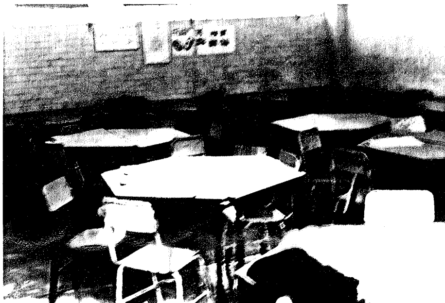
2.- Arreglo del mobiliario del salón para las actividades diseñadas.