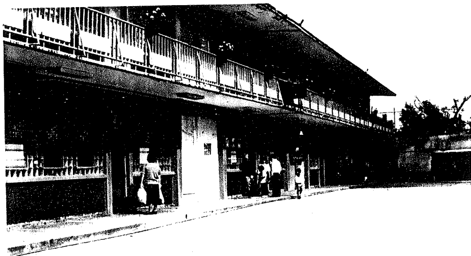
1.- Escuela Primaria Lázaro Cárdenas