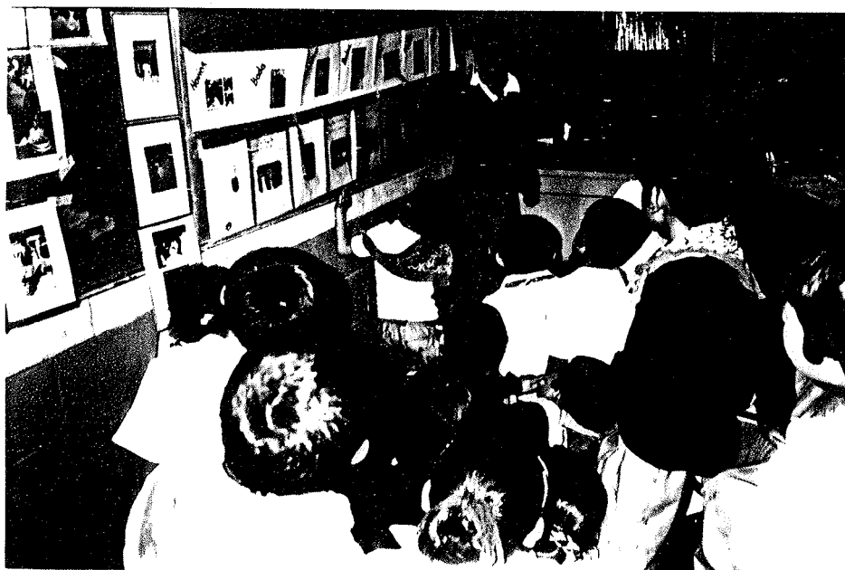
4.- Participación de los alumnos en nuestra forma de trabajo