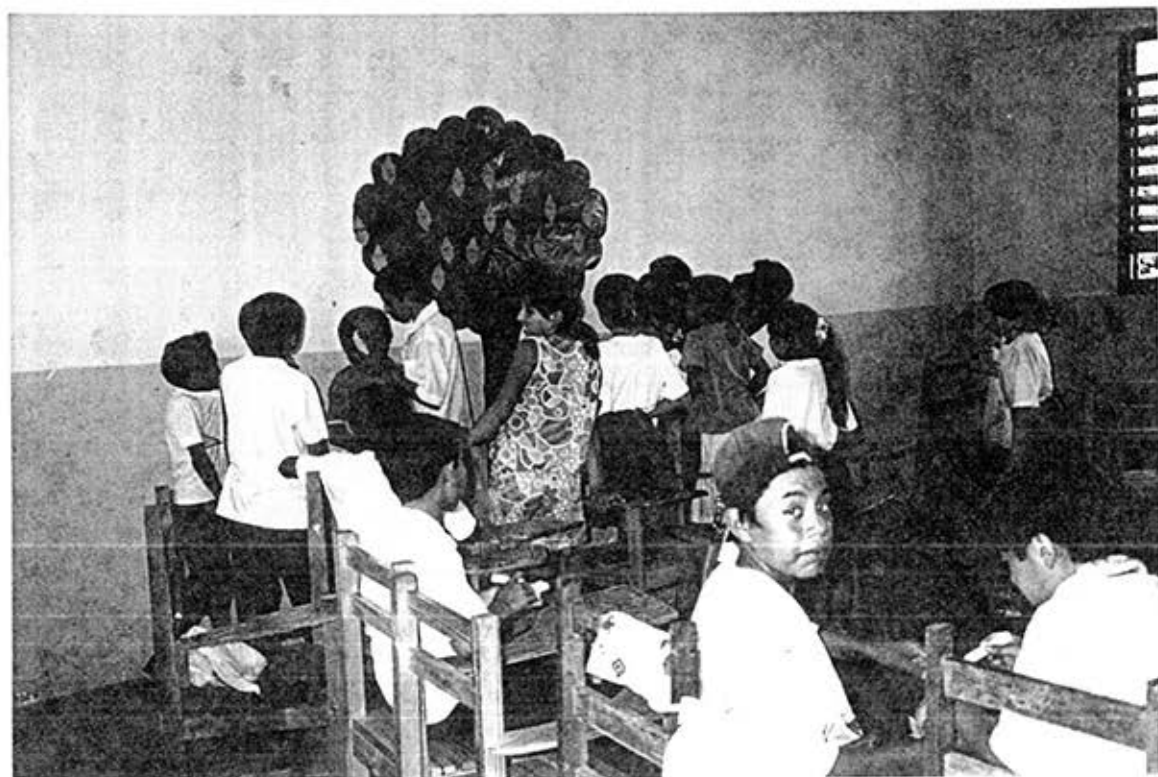
Los alumnos bajando las hojas del "árbol de la ayuda"