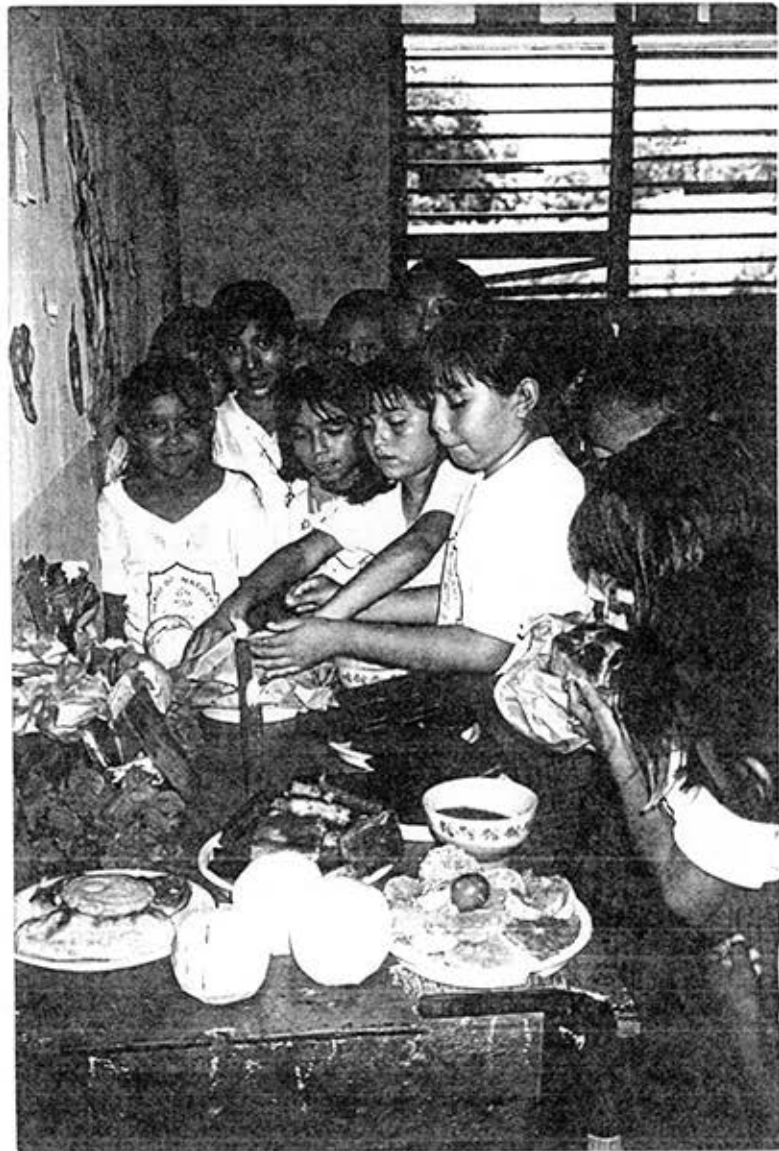
La Celebración del Día de Muertos