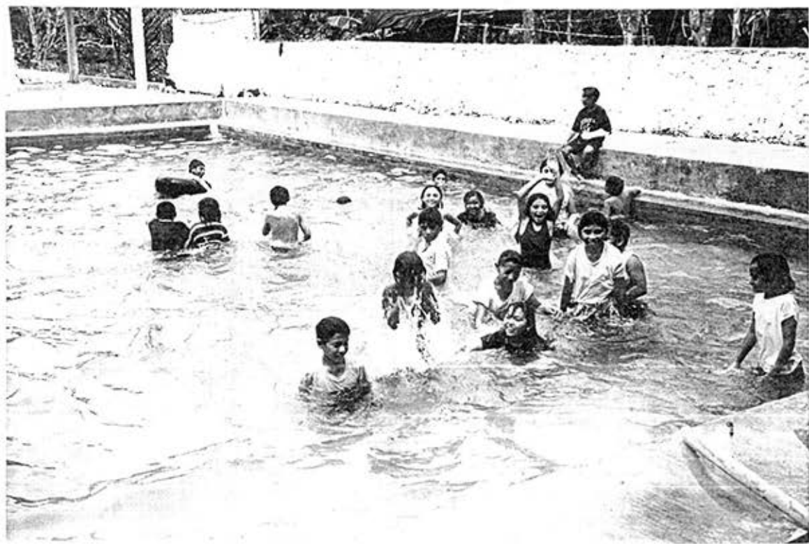
La excursión a la piscina