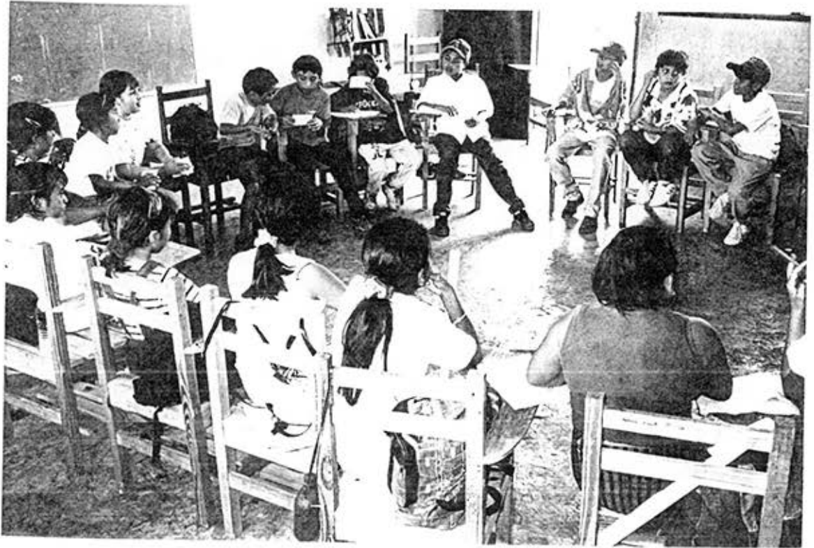
Los alumnos sentados en rueda