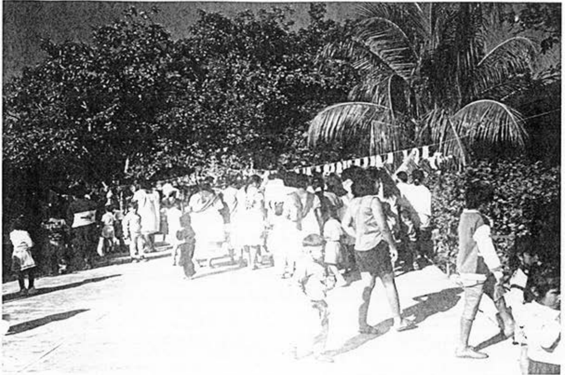
Exhibición de trabajos manuales elaborados por los niños.