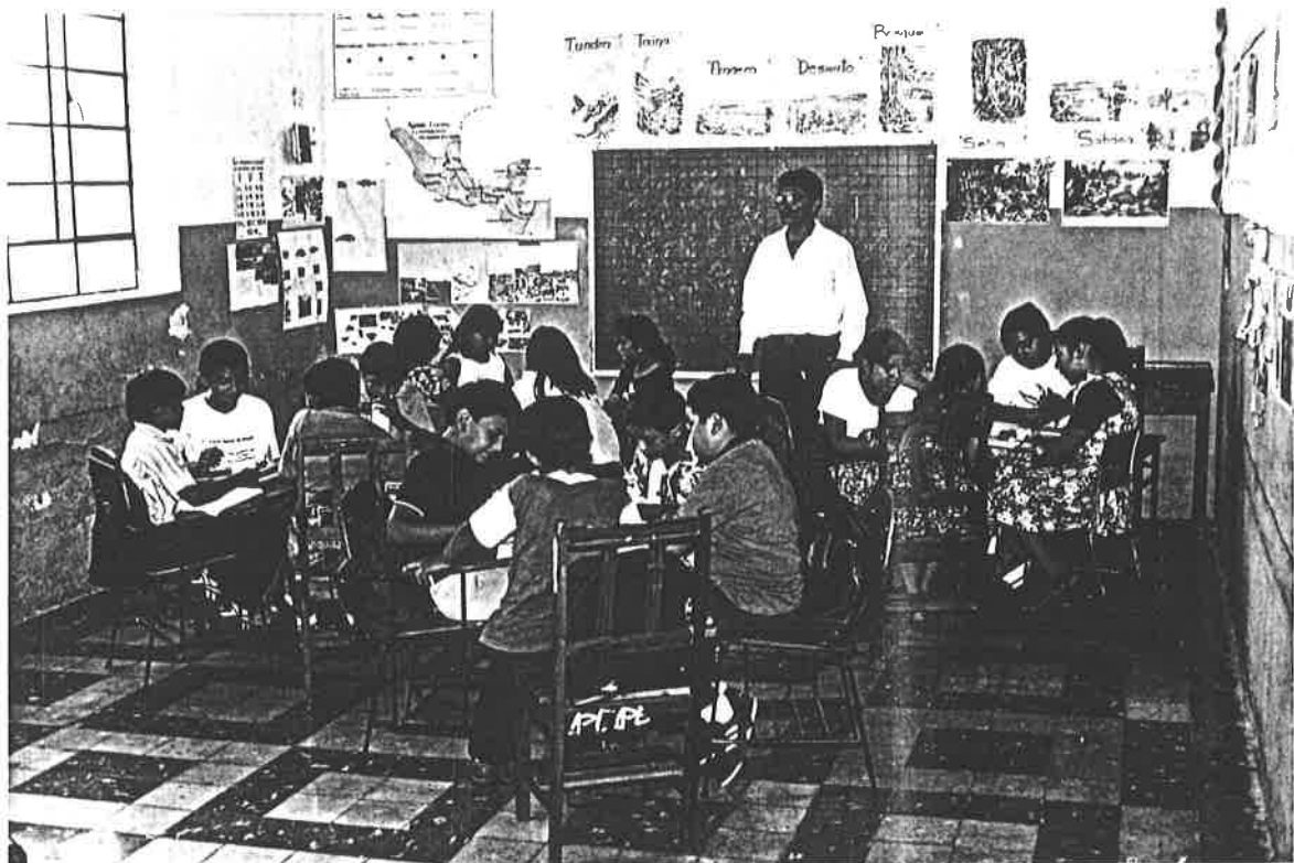
Niños comentando el texto que más les gustó.