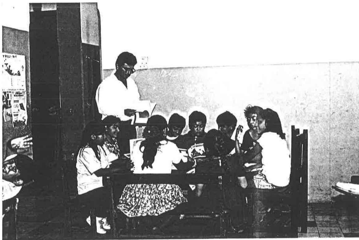
Niños seleccionando textos de su agrado en el Rincón de Lecturas.