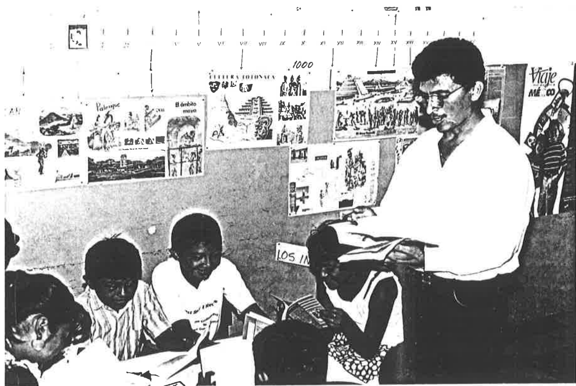
Niños identificando textos de guiones radiofónicos.