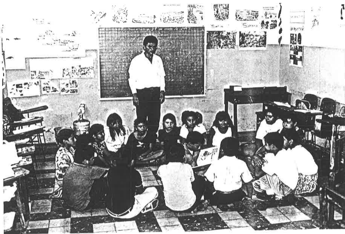
Niños leyendo el texto que ellos mismos señalaron.