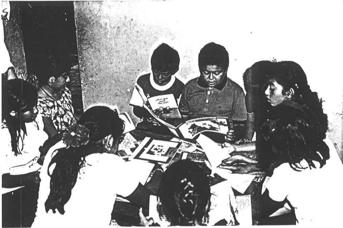
Niños en el Rincón de Lecturas.