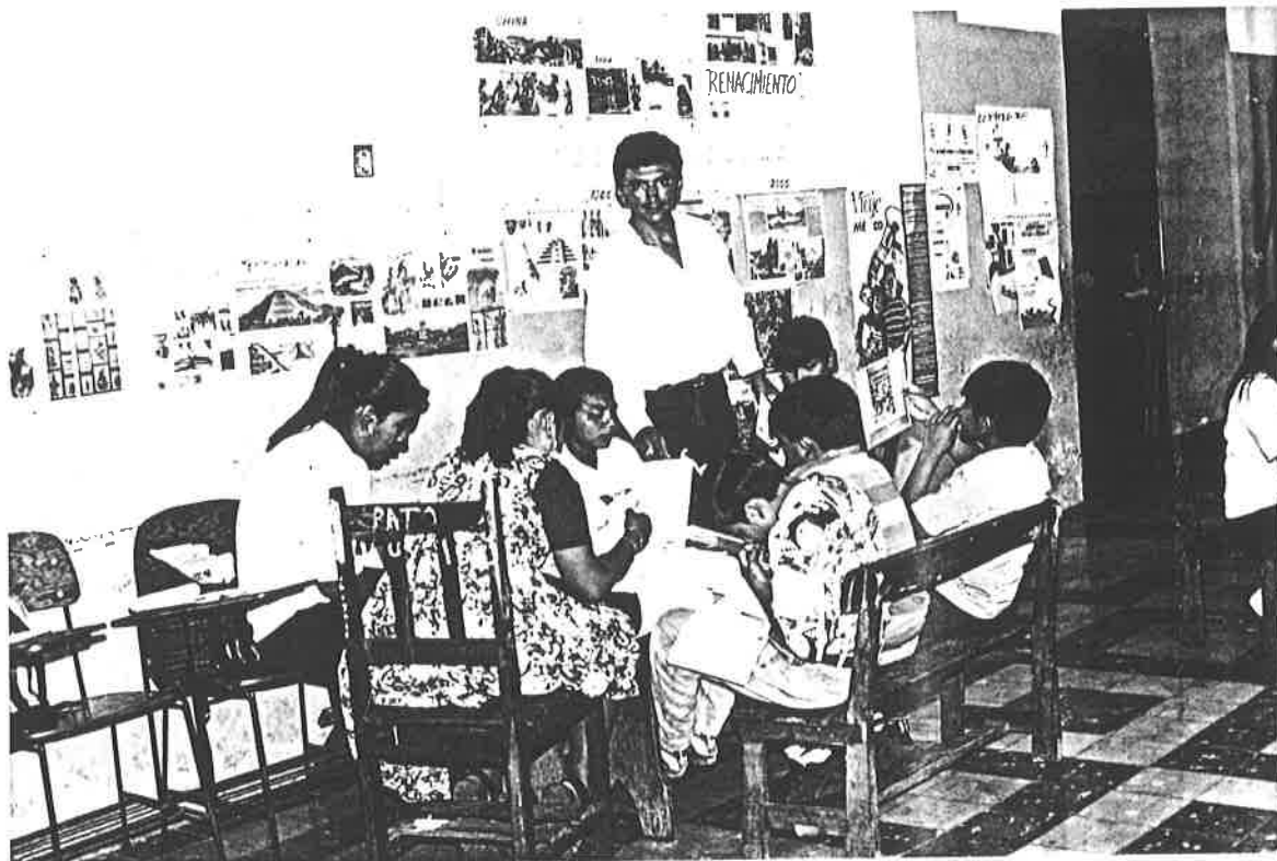
Niños elaborando sus guiones radiofónicos.