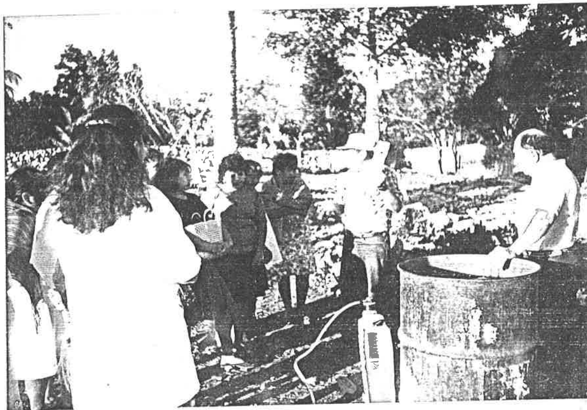
Explicación sobre el manejo y uso correcto de insecticidas y fertilizantes en los cultivos.