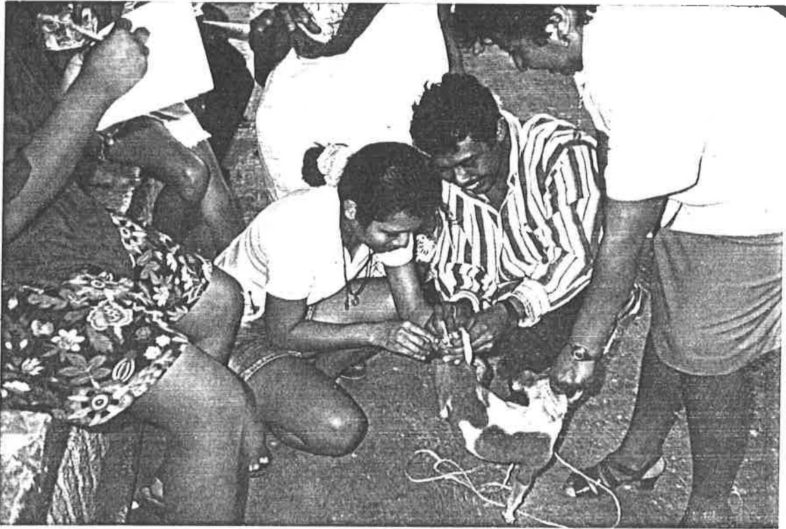
Demosttraciones prácticas sobre la aplicación de vacunas