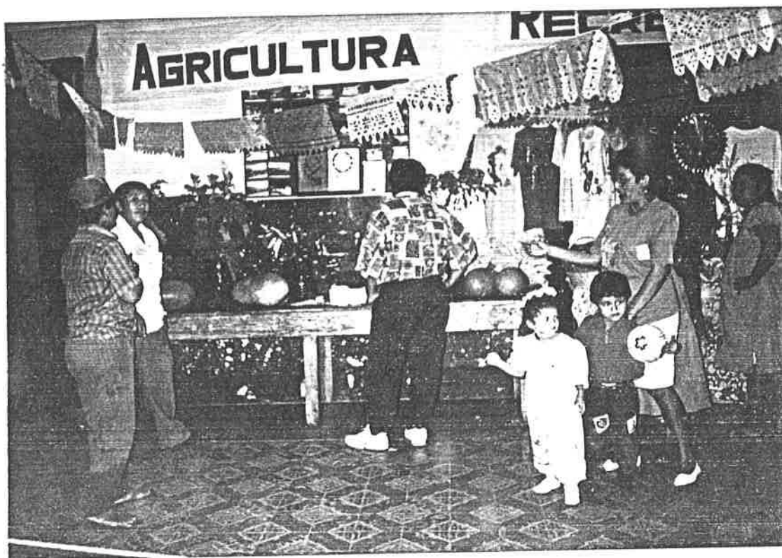
Una tarde en la exposición de trabajos y demostración sobre la industrialización de los productos hortícolas.