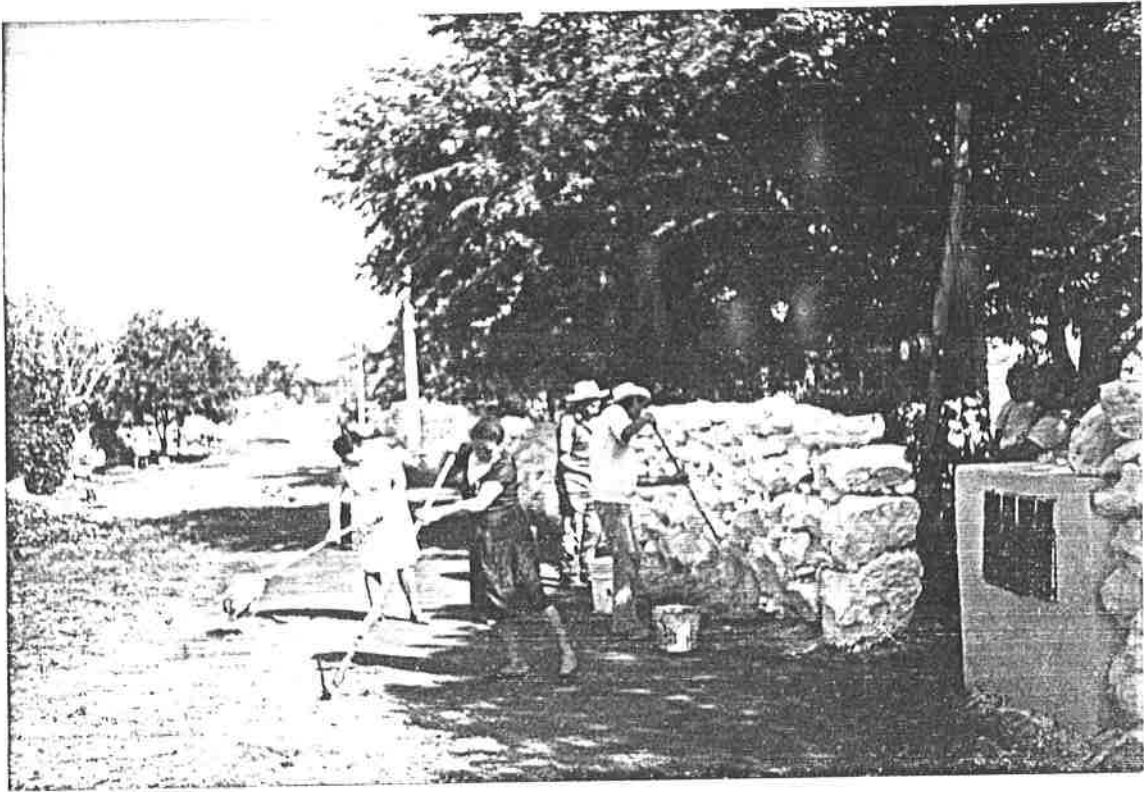
Alumnas Participando en el saneamiento del medio ambiente