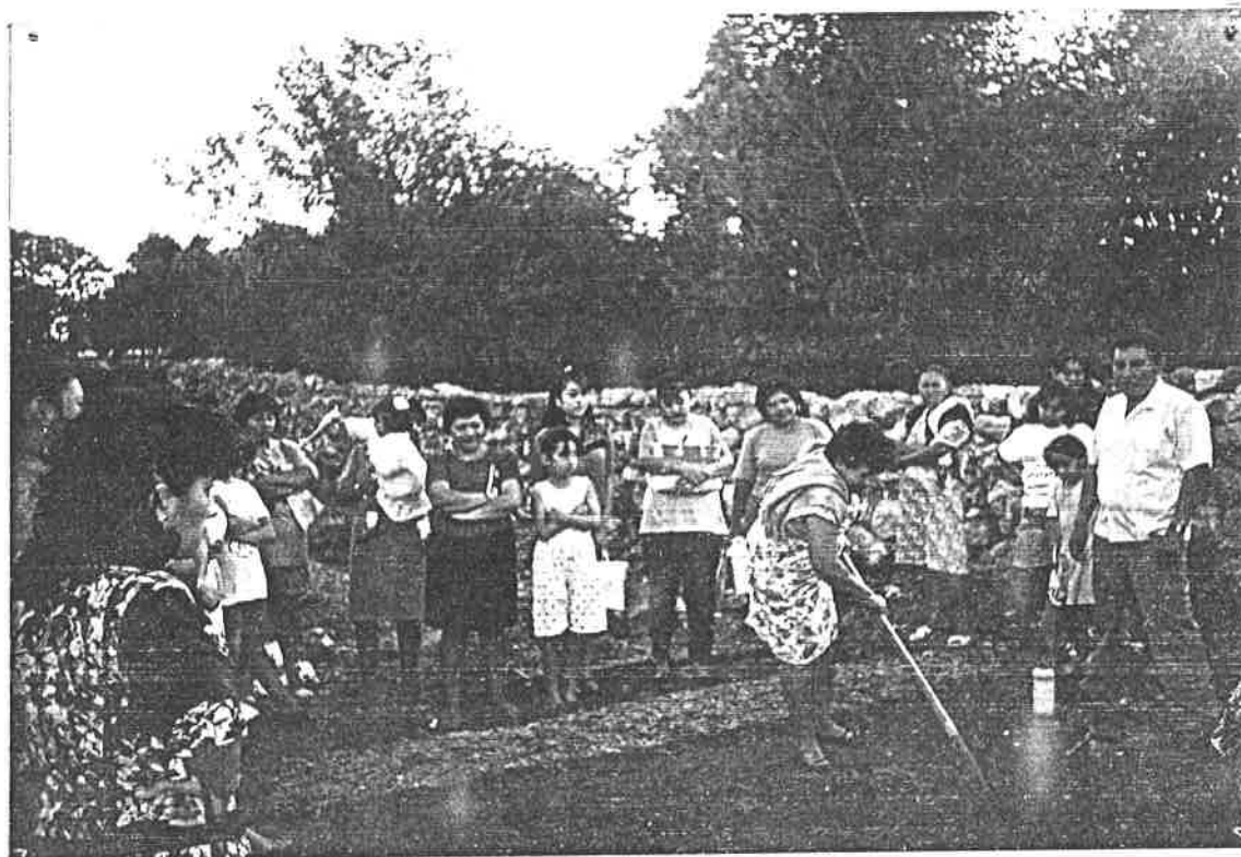
Una tarde de trabajo en el huerto comunal