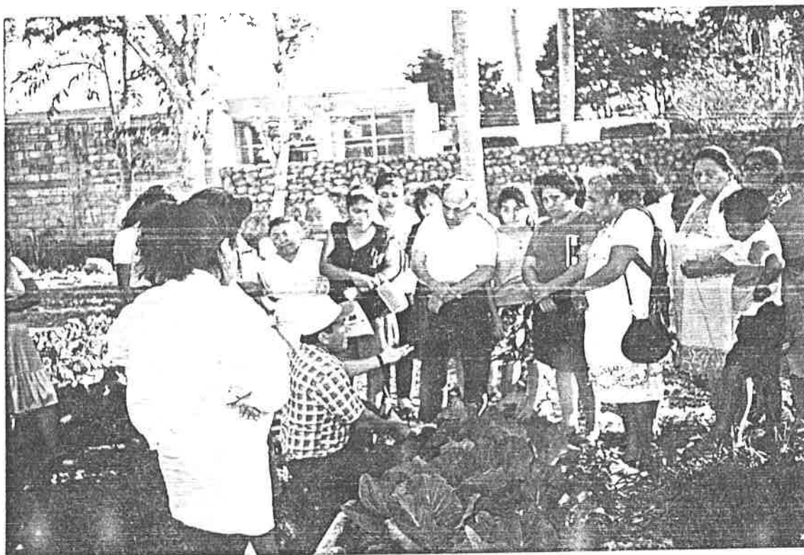
Información práctica sobre el ataque del pulgón verde en los cultivos.