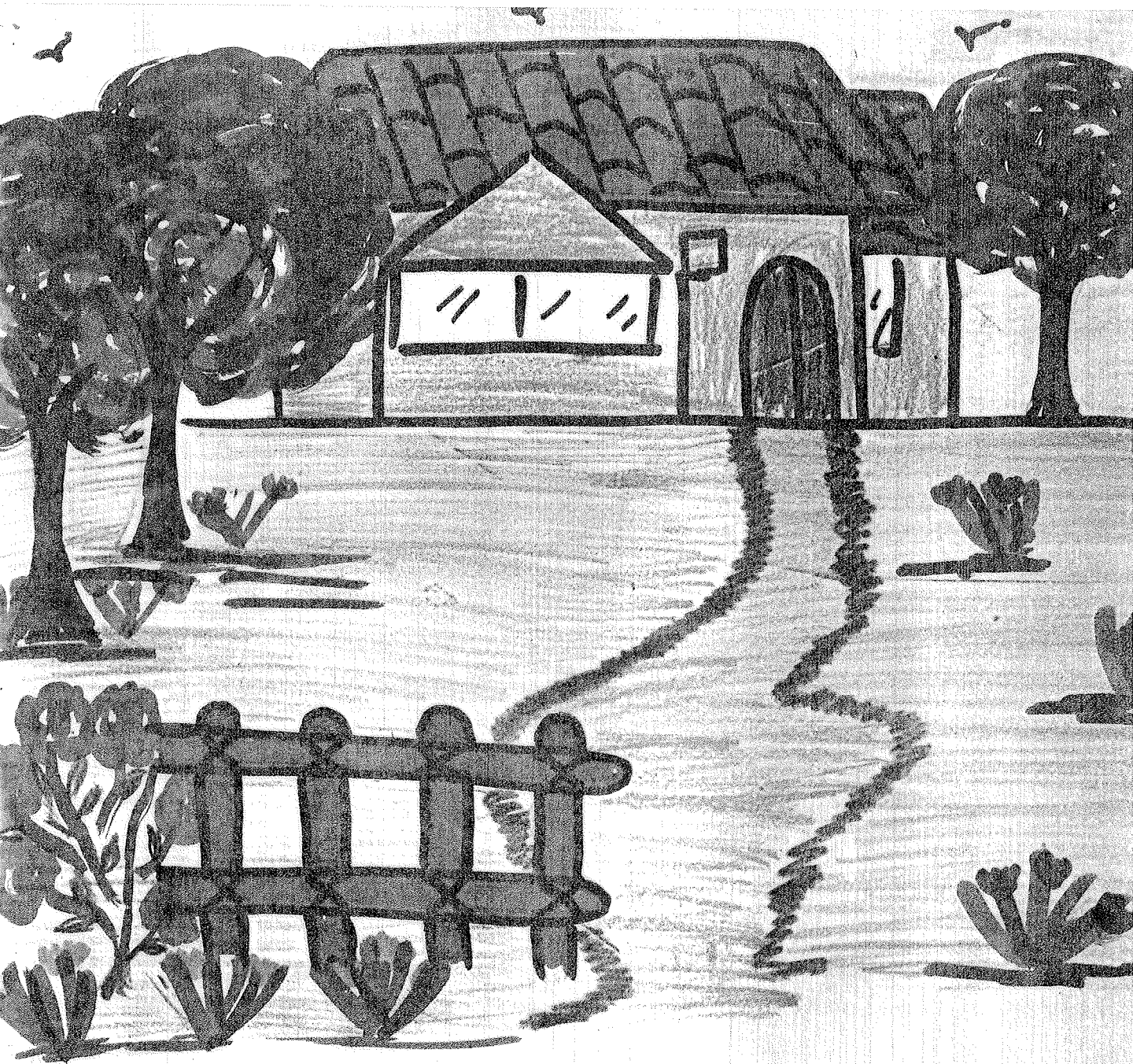
LA CASA DE MEMO DONDE VIVE CON SU FAMILIA.