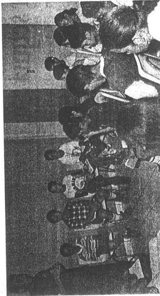
INFANTES de la primaria "Renato Vega Amador" recibieron pláticas sobre el funcionamiento del H. Cuerpo de Bomberos.

Tres niños que se habían rezagado de la plática se encontraban conversando arriba de una de las bombas y dos ellos comentaban las grandes hazañas que realizarían cuando fueran bomberos.