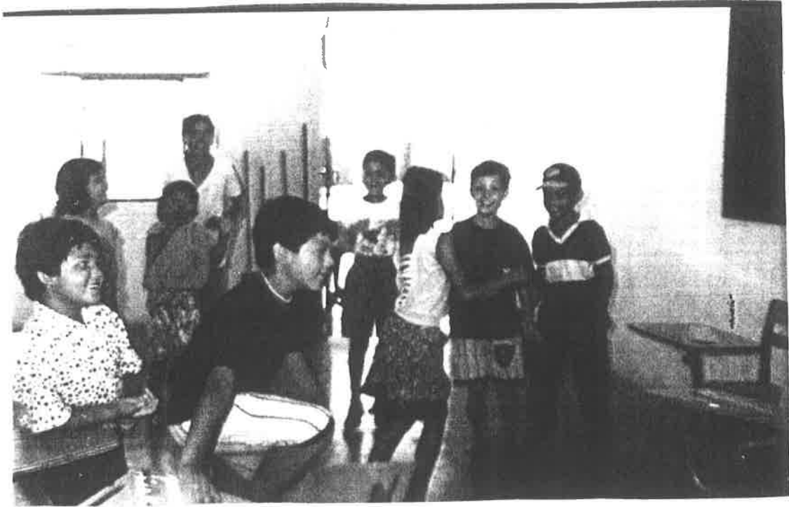
Niño tratando de comunicar mediante mímica, la tarjeta leída en la estrategia 2.