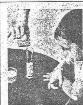
Desarrollo de la personalidad en el niño (ver página 18).