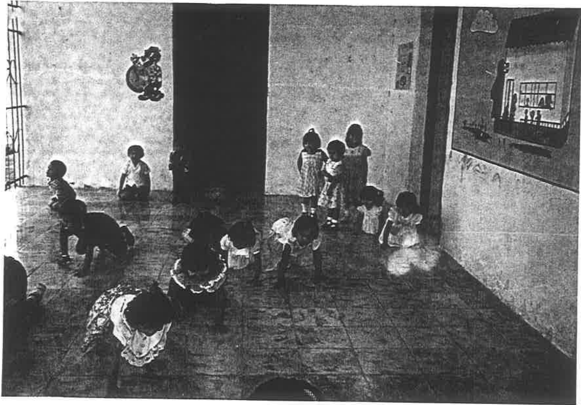
Realizando una actividad de Juegos Educativos.