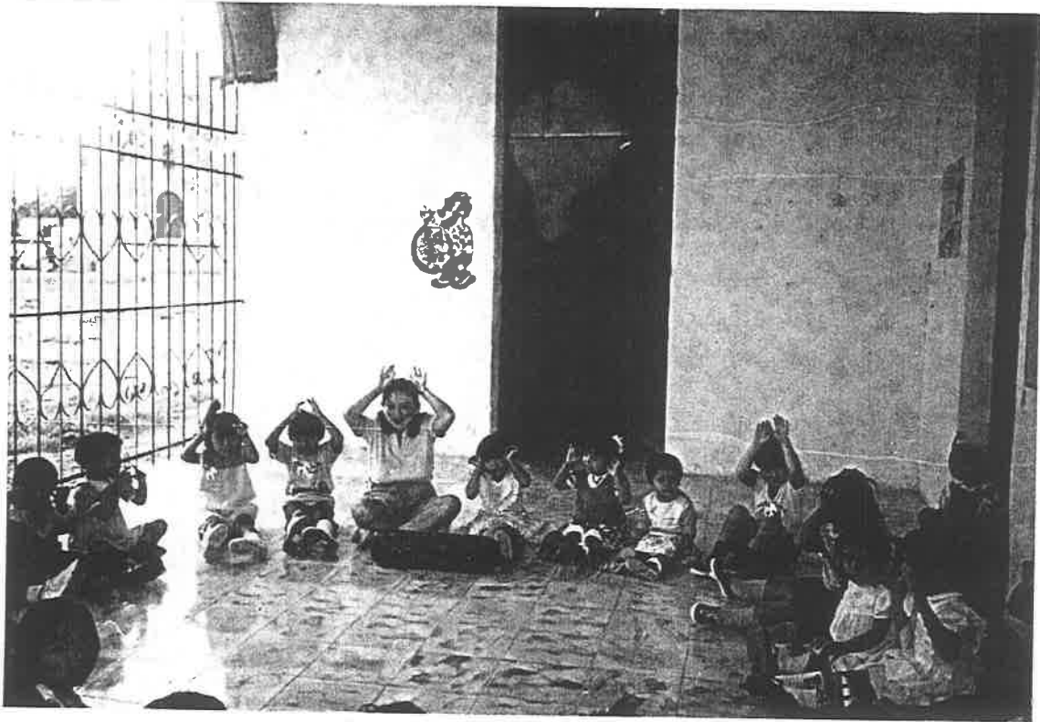
Realizando una actividad de Cantos.