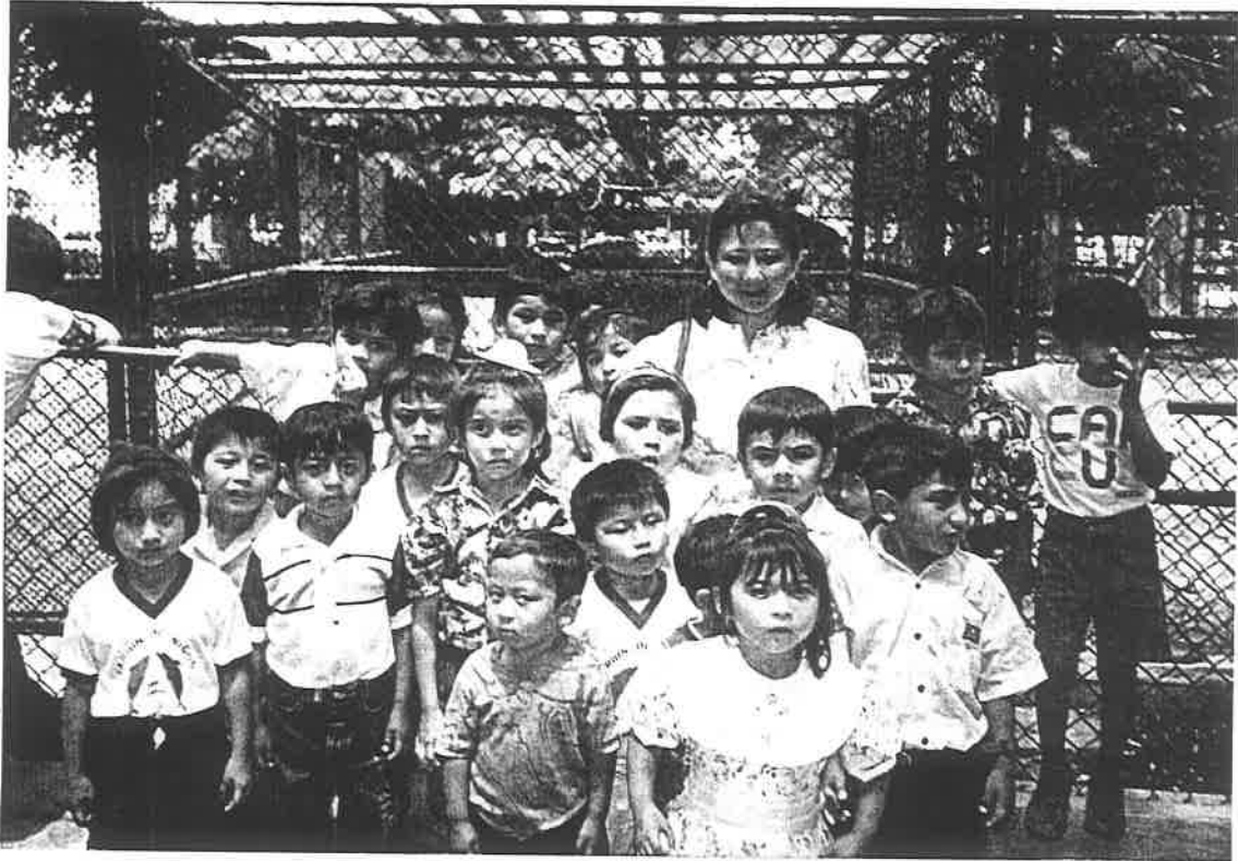
Visita realizada al Centenario de la ciudad de Mérida.