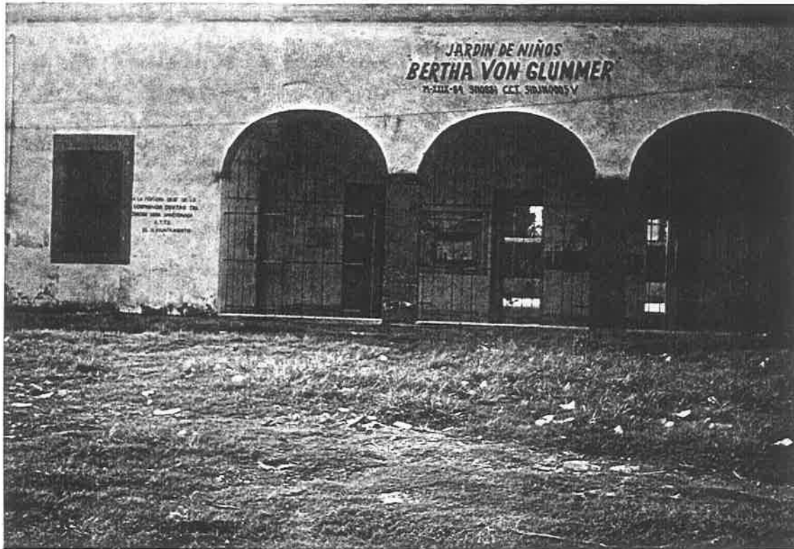
Aspecto del edificio escolar del Jardín de Niños "Bertha Von Glummer" de la comunidad de Tahmek, Estado de Yucatán.