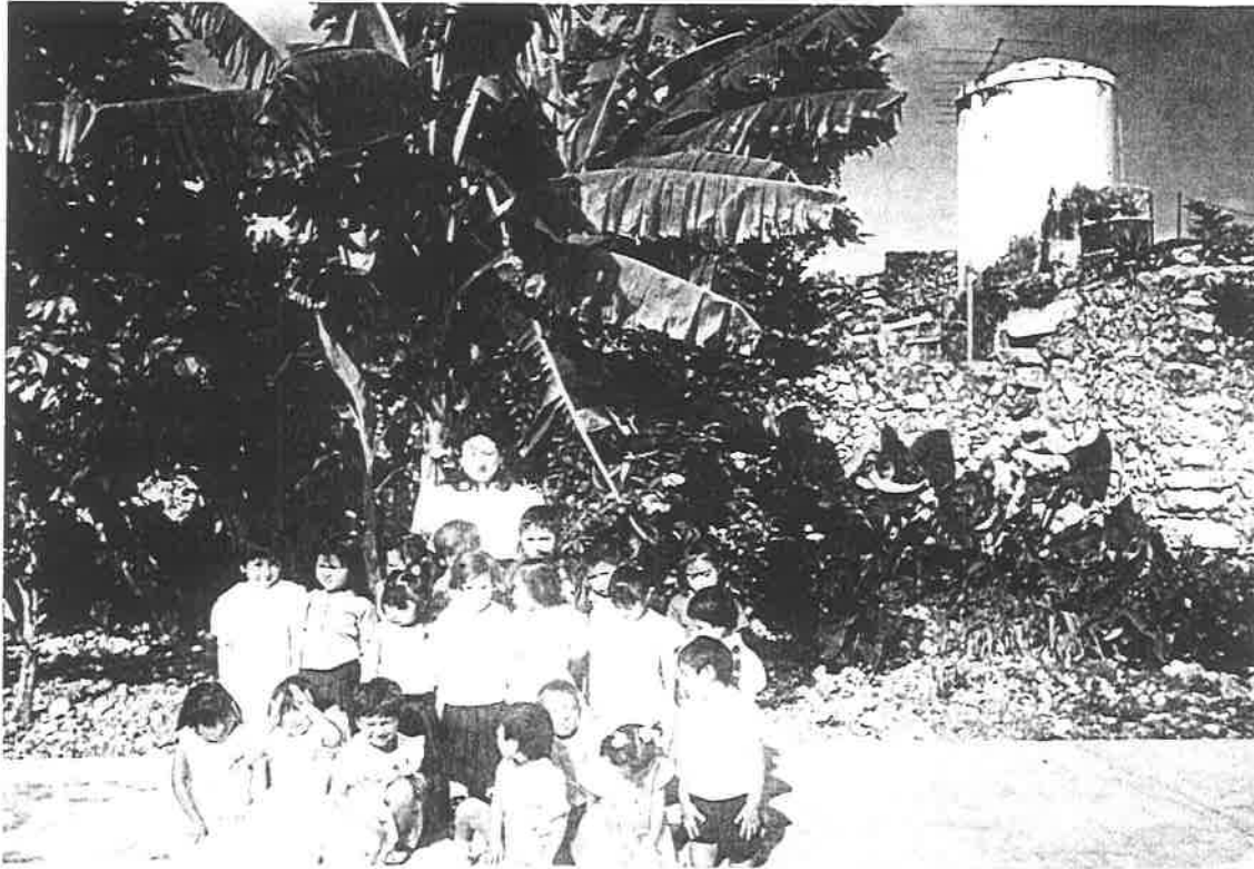
Grupo de niños del primer año, junto con la educadora.