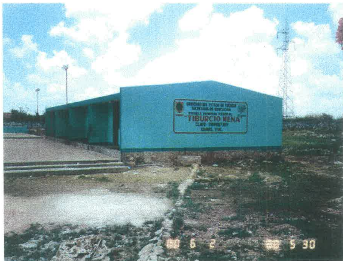
VISTA PANORAMICA DE LA ESCUELA "TIBURCIO MENA"