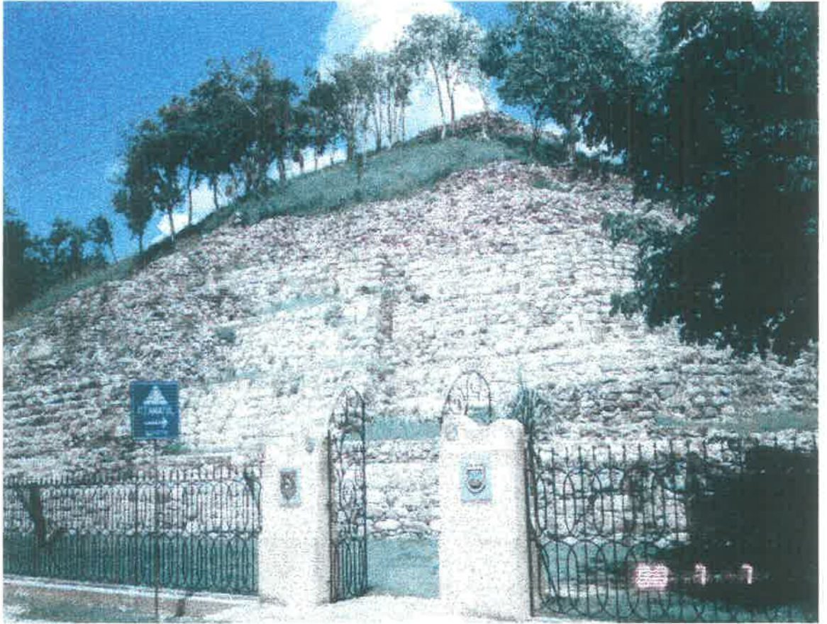
PIRAMIDE MAYA DE ITZAMATUL EN AL CD. DE IZAMAL