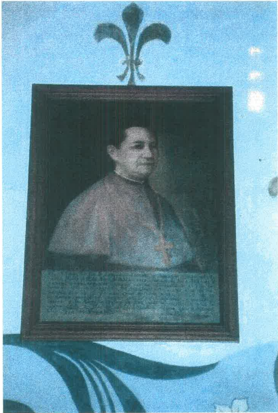
DN. CRESCENCIO CARRILLO Y ANCONA