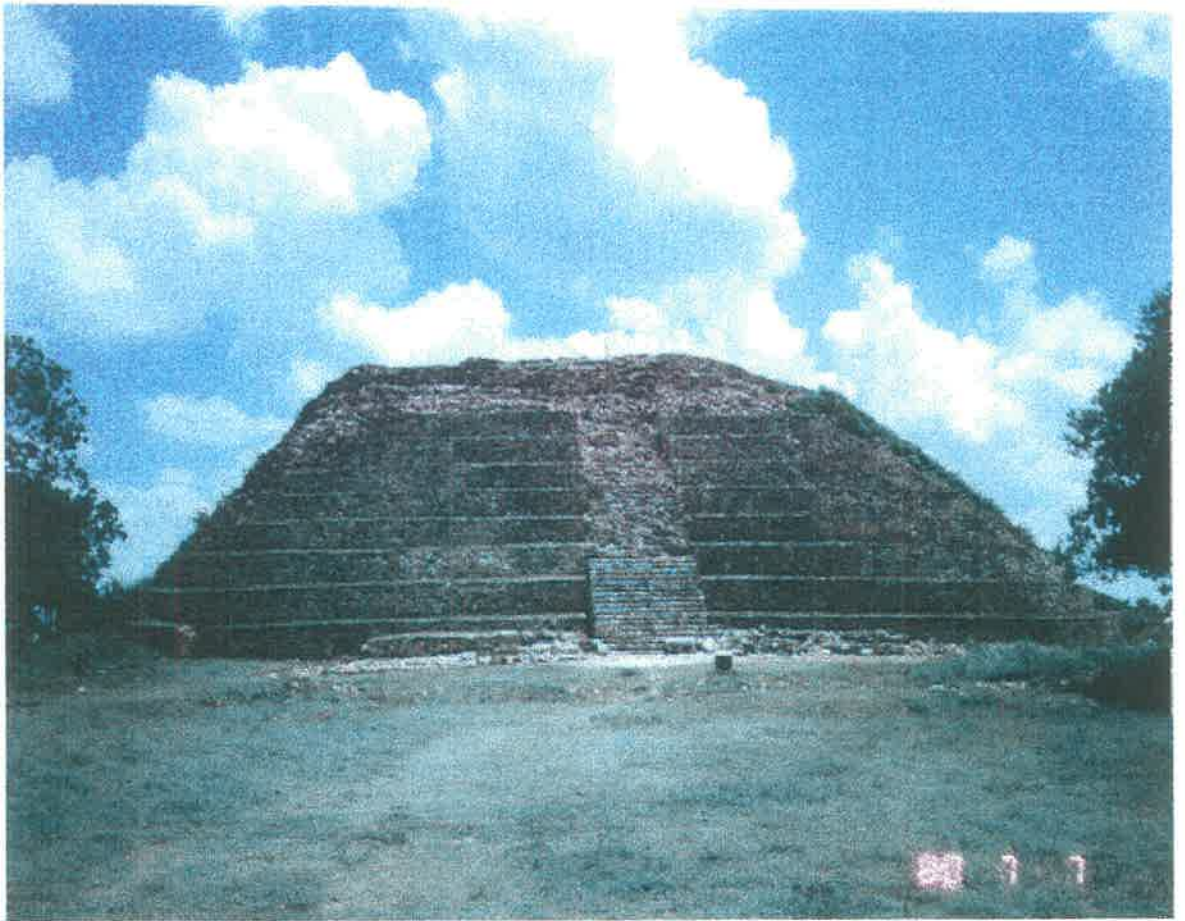
PIRAMIDE MAYA DE KINICH-KAKMÓ EN IZAMAL, YUC.