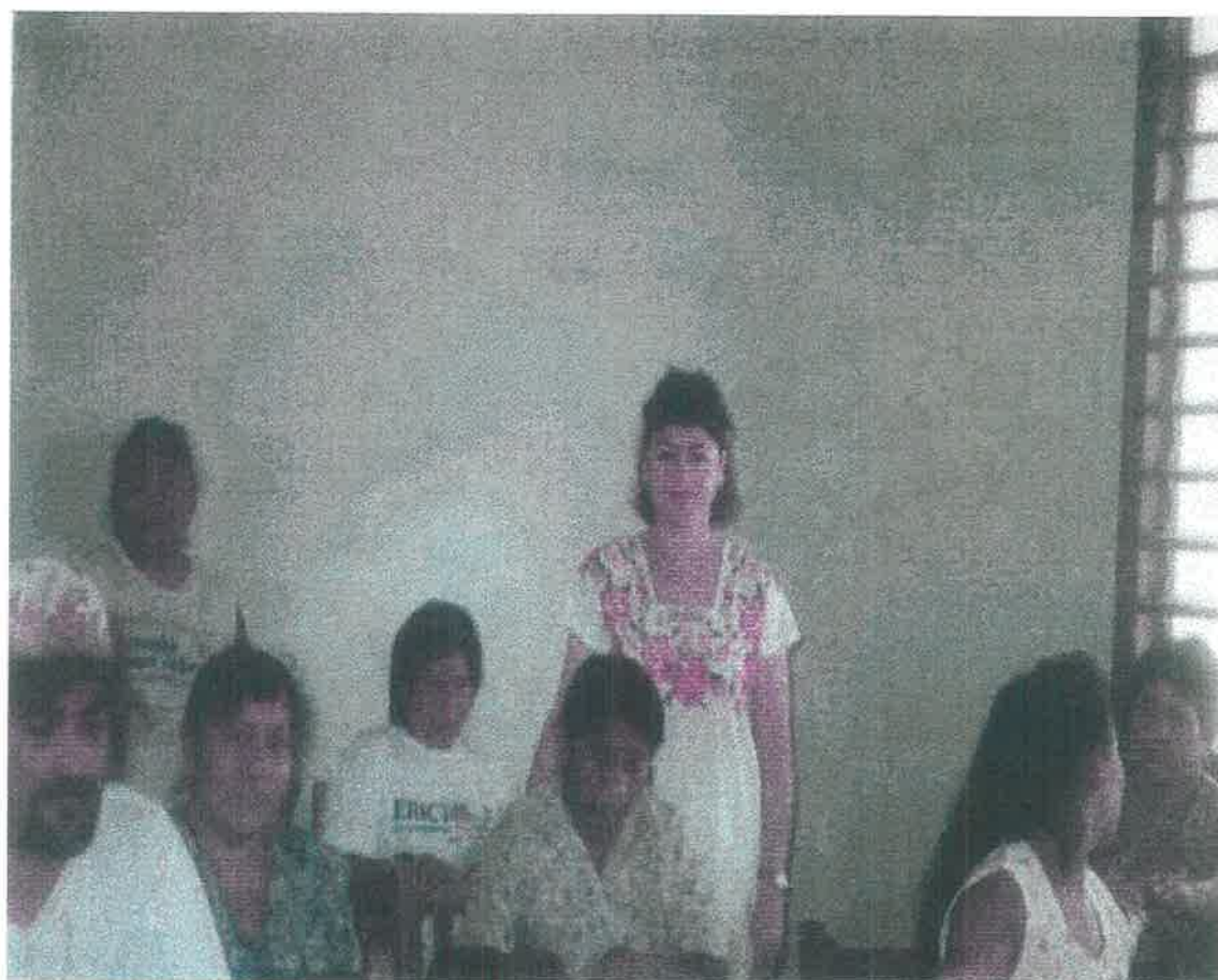
REUNION PARA ENTREVISTAR A LOS PADRES DE FAMILIA