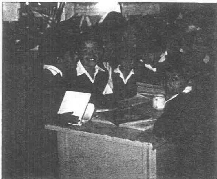
DESPUES DE UNA SESION DE TRABAJO .