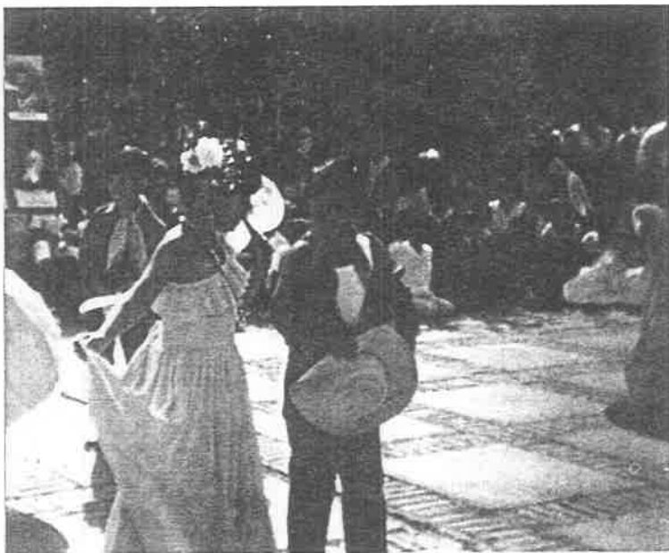
PARTICIPACION FESTIVAL DEL 20 DE NOVIEMBRE.