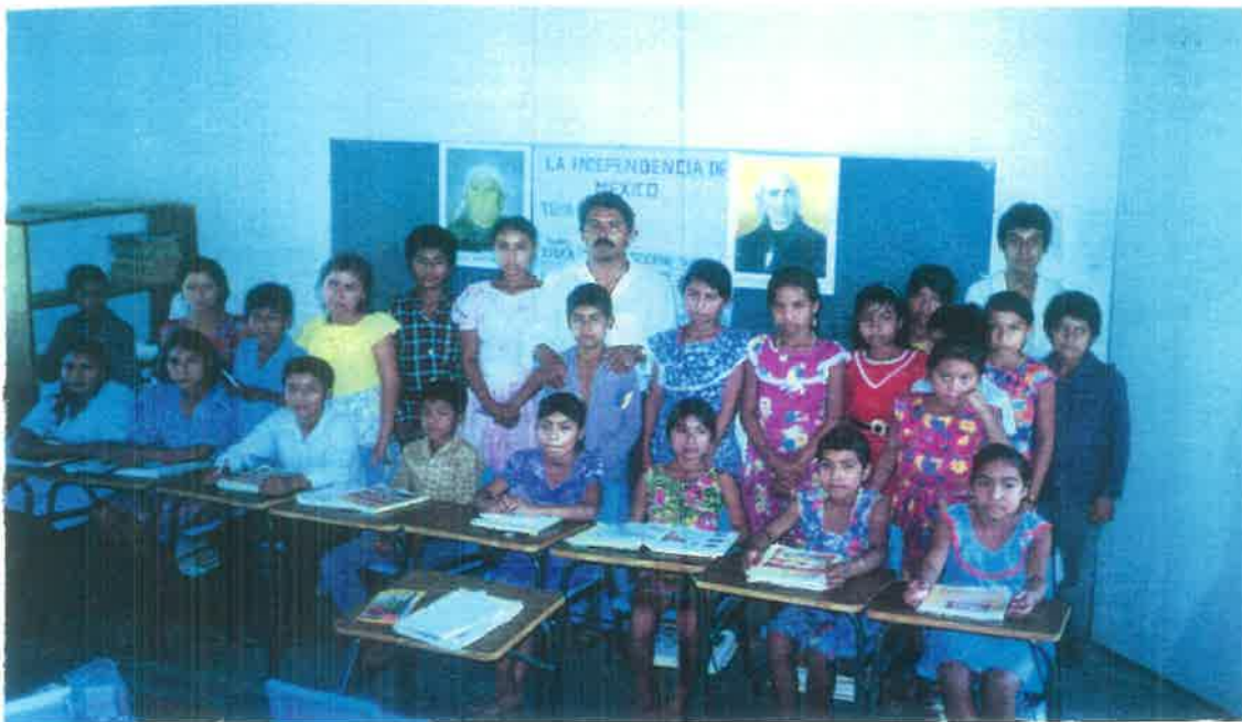
Maestro y alumnos