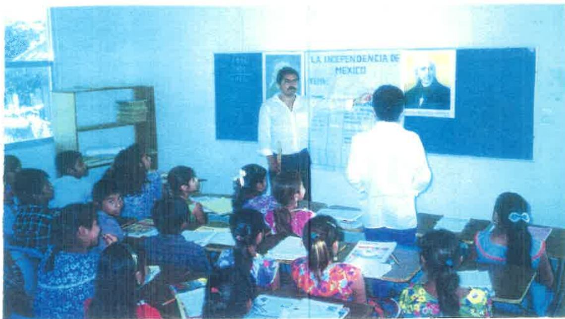
Interacción Maestro y alumnos