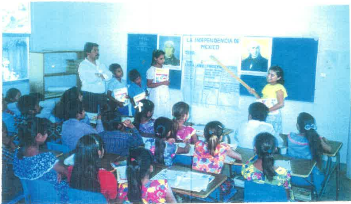
Exposición de trabajo por equipo