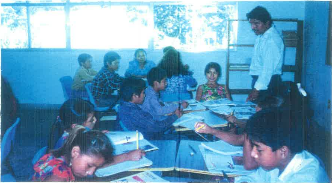
Alumnos trabajando por equipo