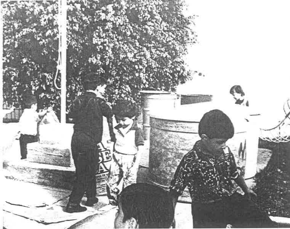
Los niños se mueven con timidez al realizar las actividades.