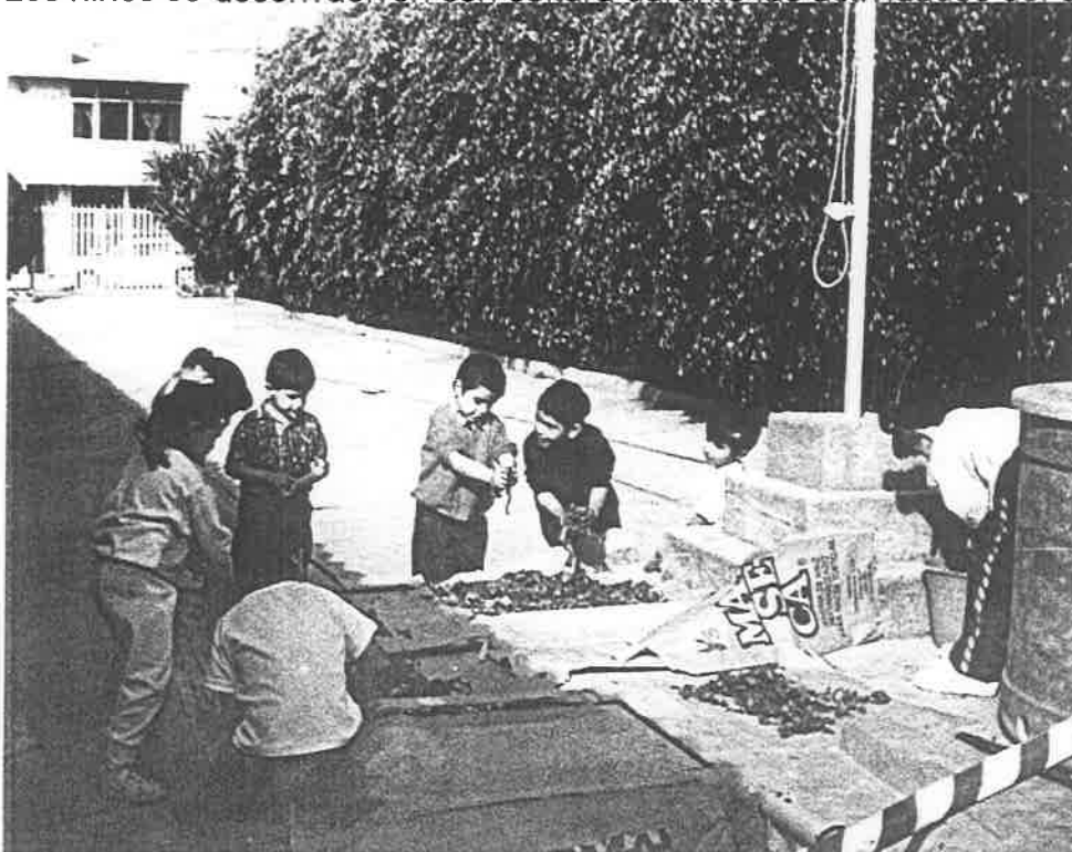
Los niños expresan sus emociones corporales al poder utilizar diferentes materiales.