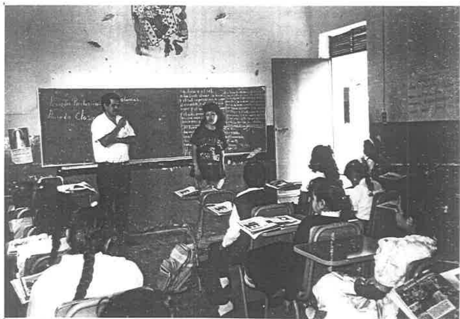
MADRE DE FAMILIA CONSTATANDO EL RENDIMIENTO ESCOLAR.