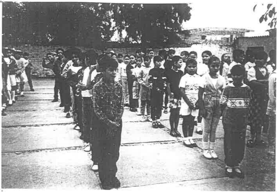
PUNTUALIDAD DEL GRUPO.