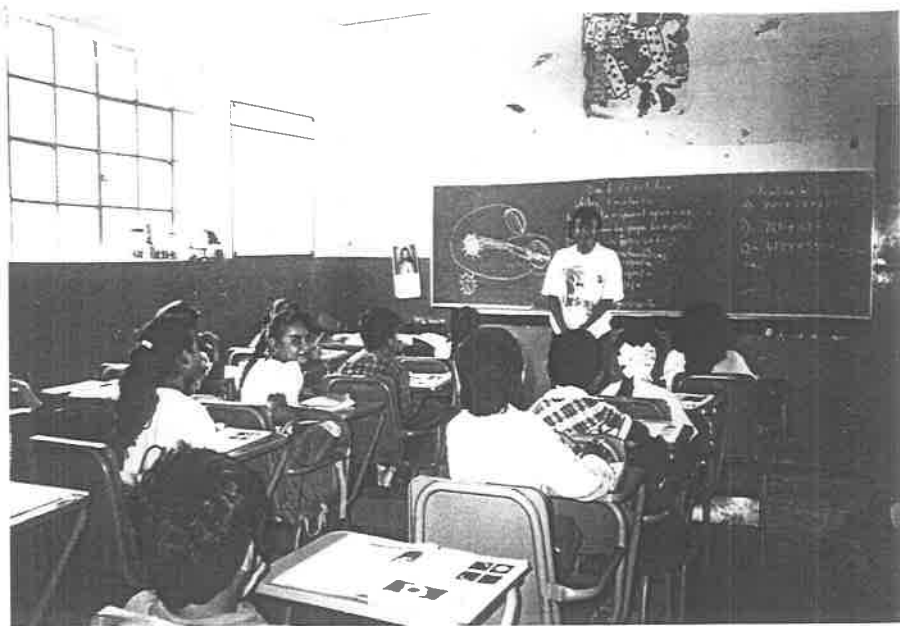
MADRES DE FAMILIA; PARTICIPANDO AL FINAL DE CLASES.